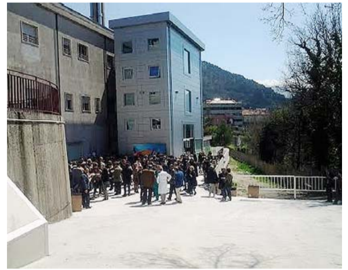
LAURIA Il taglio del nastro della nuova struttura

LAGONEGRO DENUNCIATE DUE PERSONE NEL CORSO DI CONTROLLI SULL'AUTOSTRADA SALERNO-REGGIO