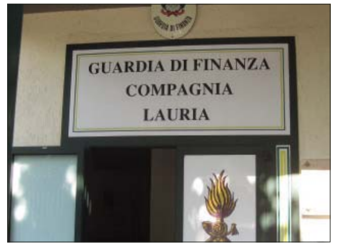
La droga è stata scoperta dalla Guardia di Finanza

Durante il consuntivo delle attività operative poste in essere dalla guardia di finanza della Basilicata nel corso dell'anno 2014 il generale De Benedetto ha citato più volte la Compa-