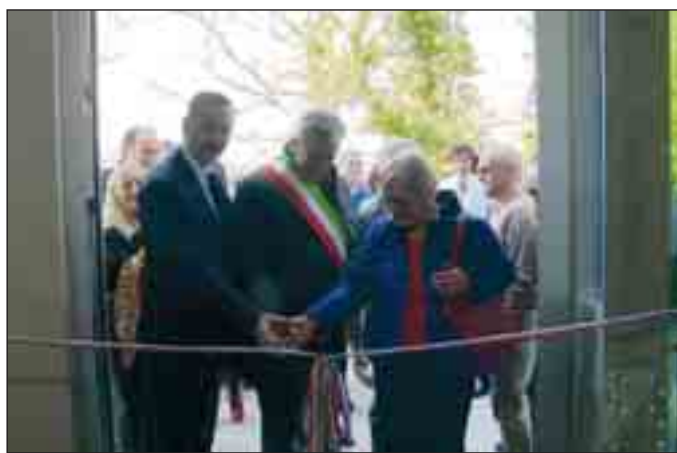
Il taglio del nastro alla presenza delle autorità