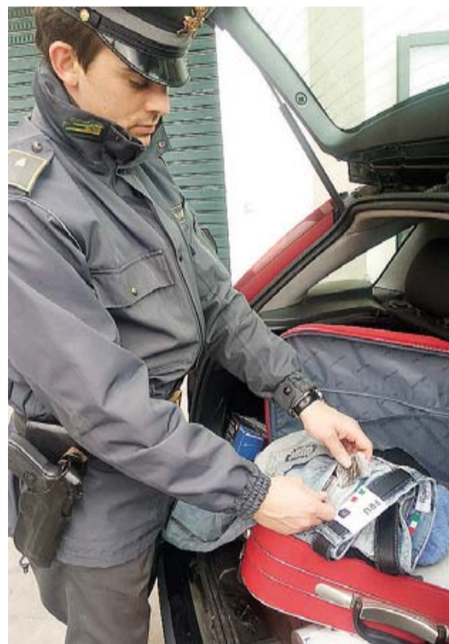
I CONTROLLI Operazione della Guardia di Finanza

■ Da oggi fino al 24 aprile, l'Anas ha istituito il doppio senso di circolazione sulla carreggiata in direzione Salerno, tra i km 14,200 e 15,000, del Raccordo autostradale «Sicignano-Potenza», nel comune di Vietri di Potenza. Il provvedimento si rende necessario per consentire la prosecuzione dei lavori di manutenzione straordinaria per il ripristino strutturale dei viadotti «Pietrastretta Sud», «Le Carre Nord» e «Platano». I veicoli in transito sul tratto e in avvicinamento all'area di cantiere dovranno osservare il limite massimo di velocità di 40 km/h e il divieto di sorpasso.