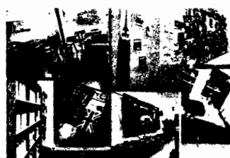
TEMPO LIBERO Particolari del centro di aggregazione