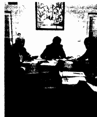
RINUNIONE L'incontro a Potenza

Anci, Confindustria e Società Green Service hanno definito un programma delle attività e dei servizi, da promuovere nella città di Potenza e nei diversi Comuni, e con scadenza mensile una riunione operativa, nella quale verificare gli obiettivi prefissati e i risultati ottenuti.