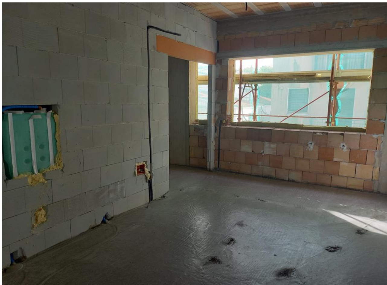
Figura 9 Rilievo fotografico del 24/09/2025