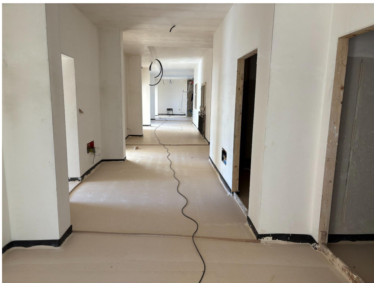
Figura 32 Rilievo fotografico del 22/12/2025