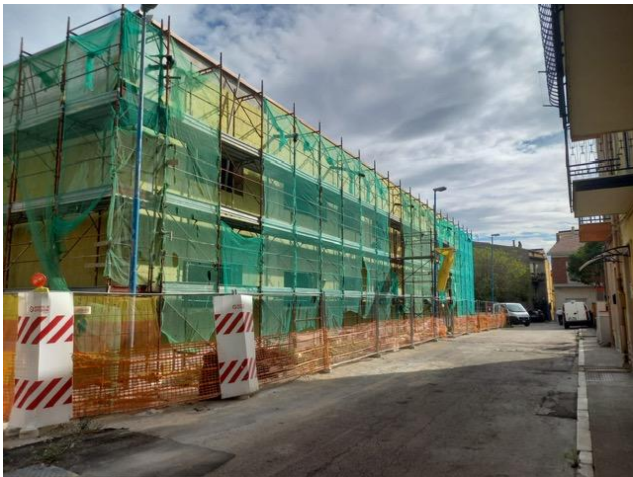
Figura 16 Rilievo fotografico del 24/09/2025