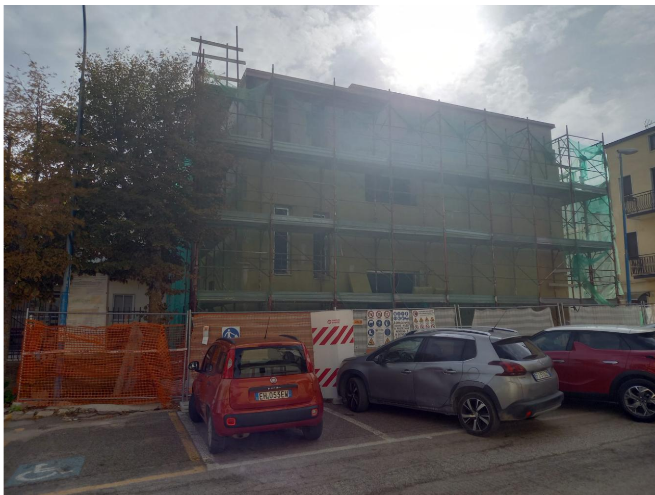
Figura 14 Rilievo fotografico del 24/09/2025