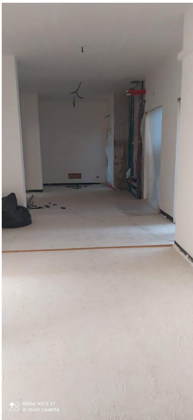
Figura 30 Rilievo fotografico del 22/12/2025