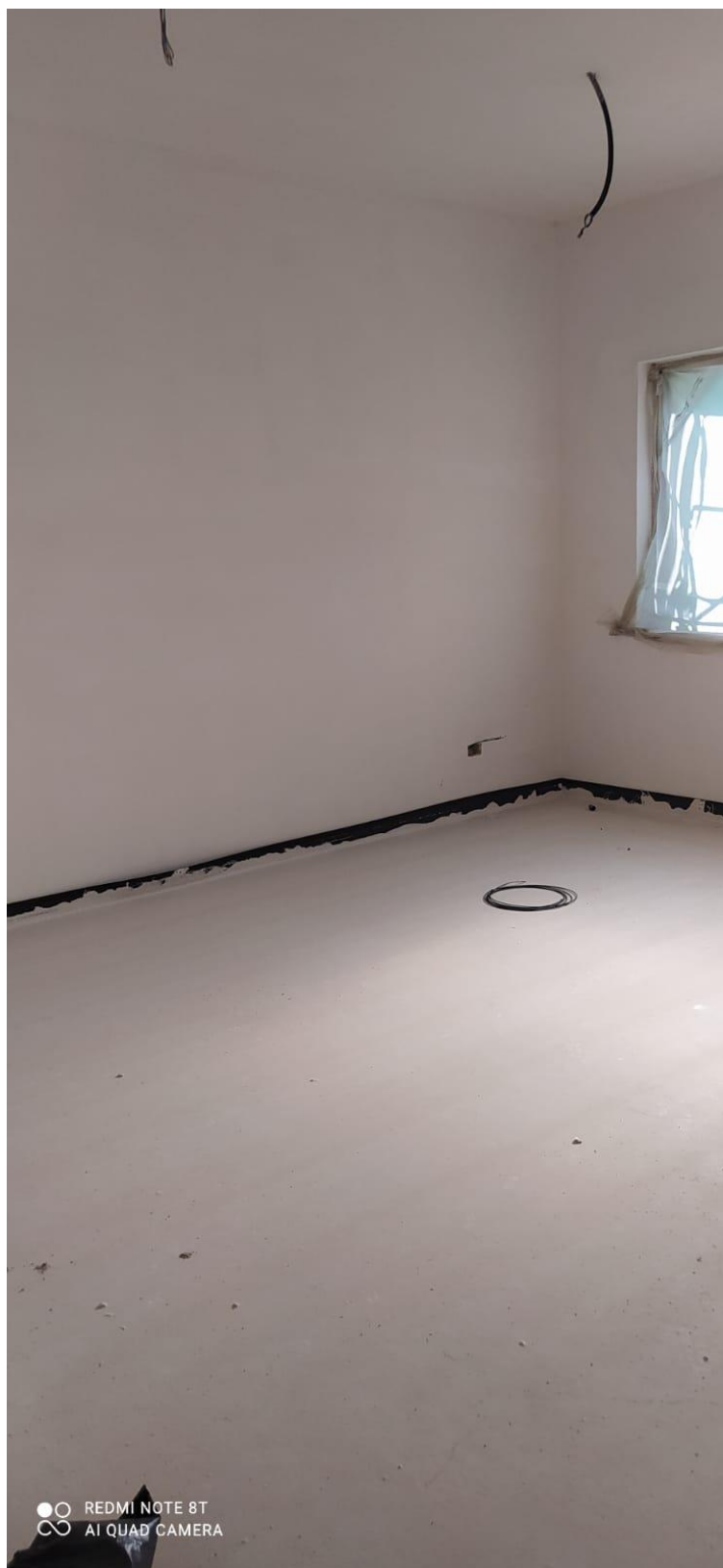
Figura 29 Rilievo fotografico del 22/12/2025