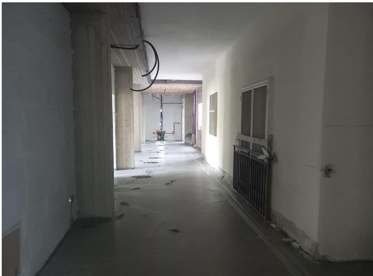
Figura 7 Rilievo fotografico del 24/09/2025