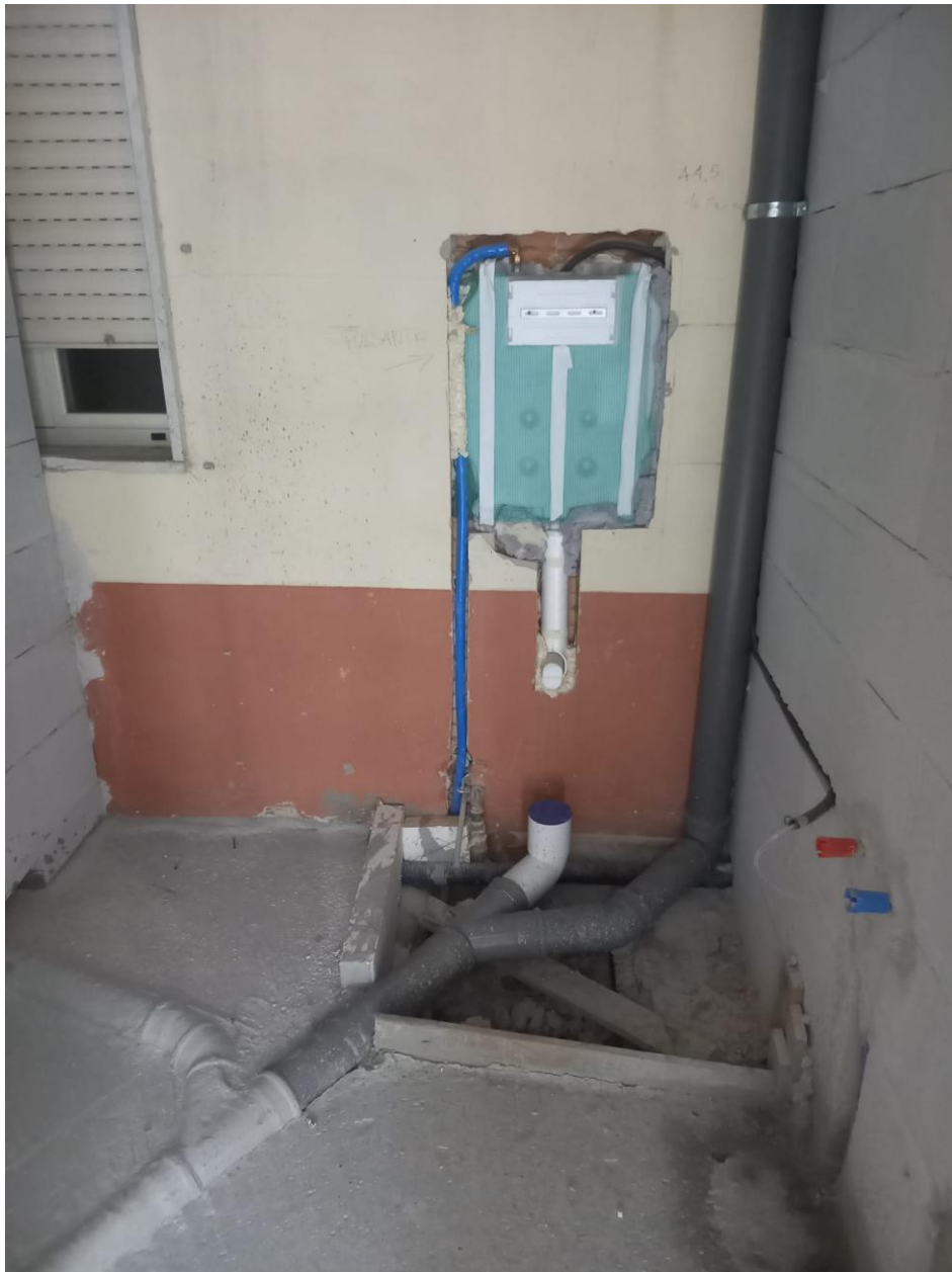
Figura 12 Rilievo fotografico del 24/09/2025