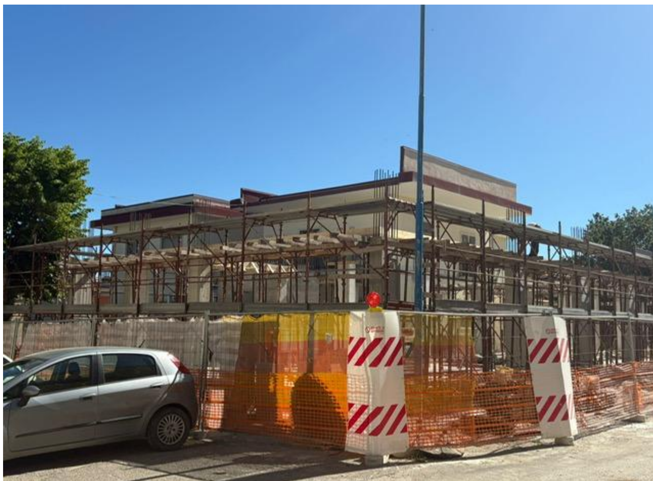
Figura 2 Messa in sicurezza del cantiere, rilievo fotografico del 26/05/2025