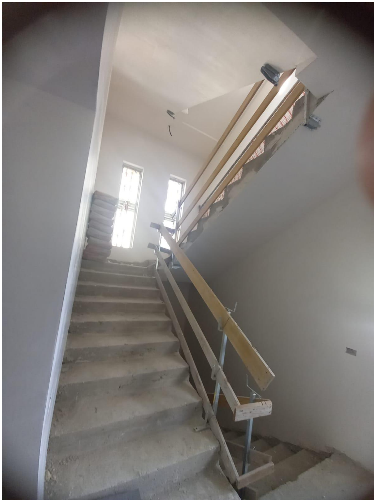
Figura 20 Rilievo fotografico del 30/10/2025