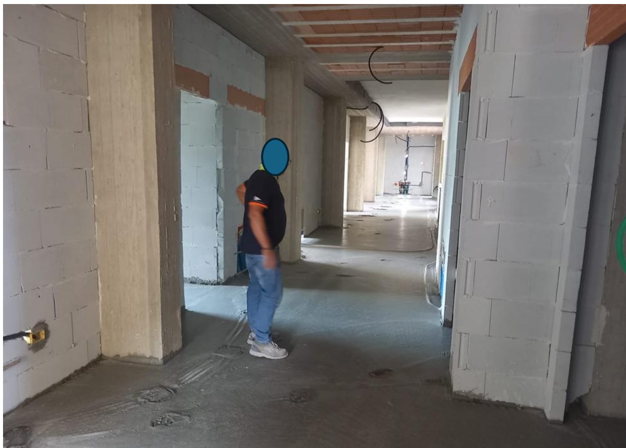
Figura 11 Rilievo fotografico del 24/09/2025