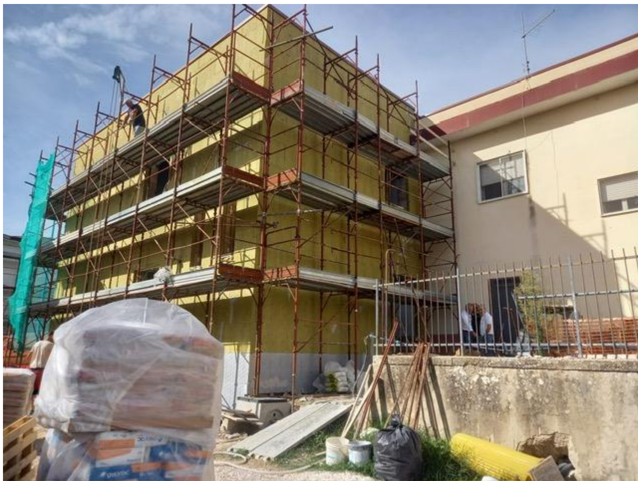
Figura 17 Rilievo fotografico del 24/09/2025