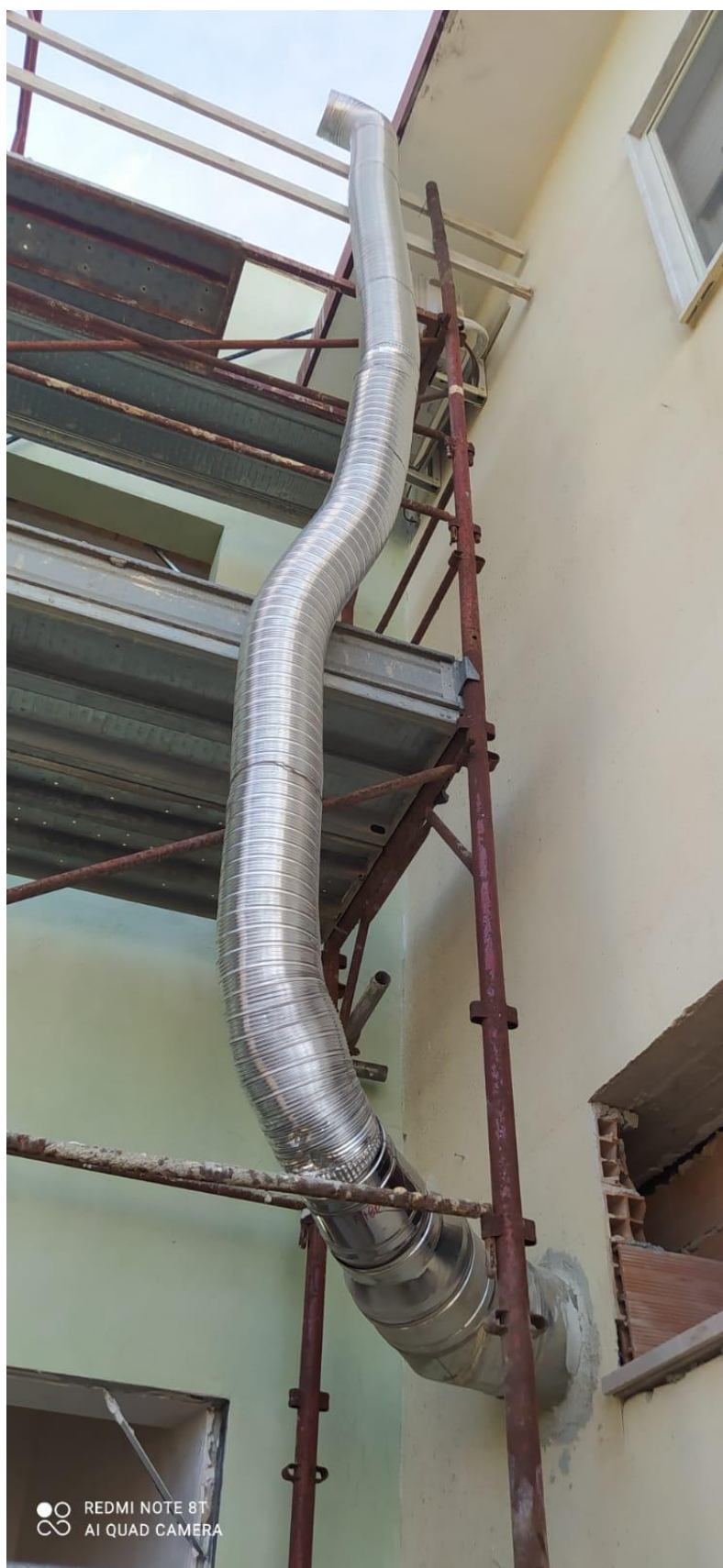
Figura 28 Rilievo fotografico del 22/12/2025