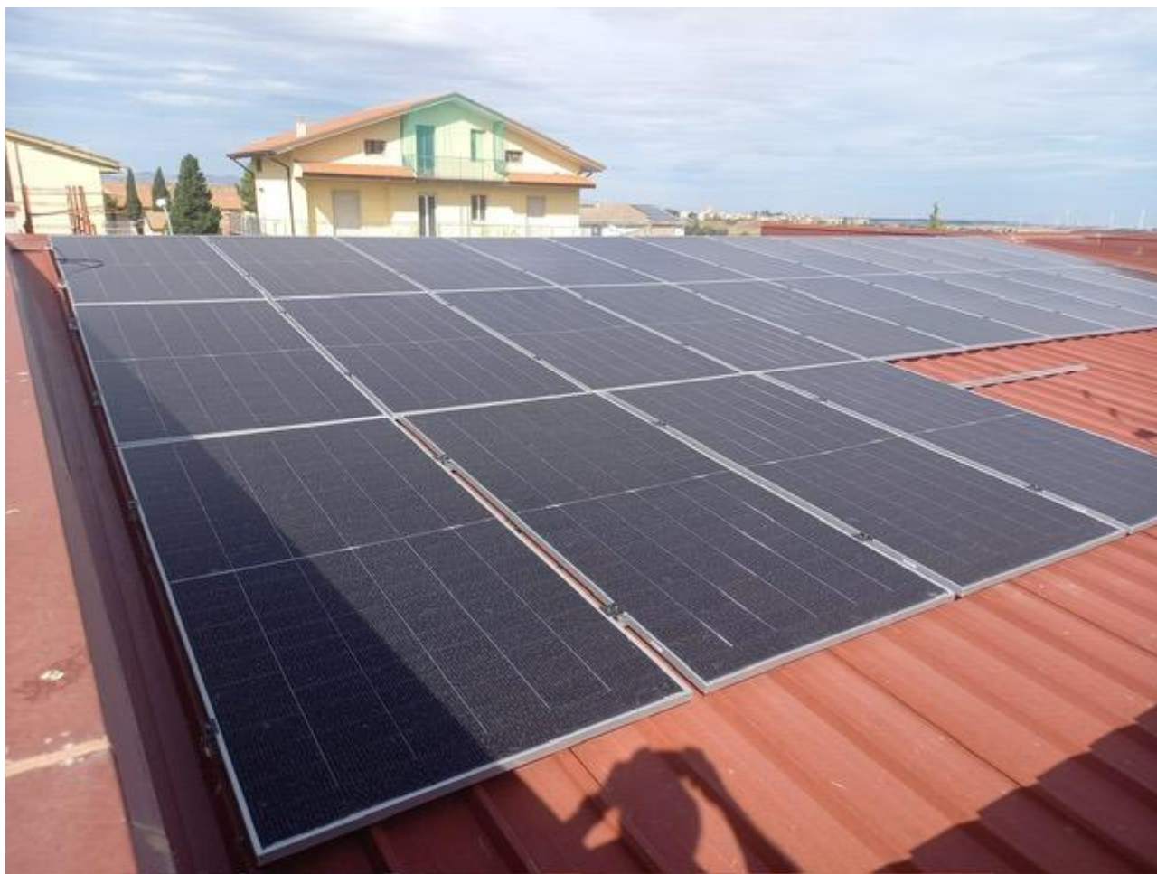
Figura 19 Rilievo fotografico del 24/09/2025