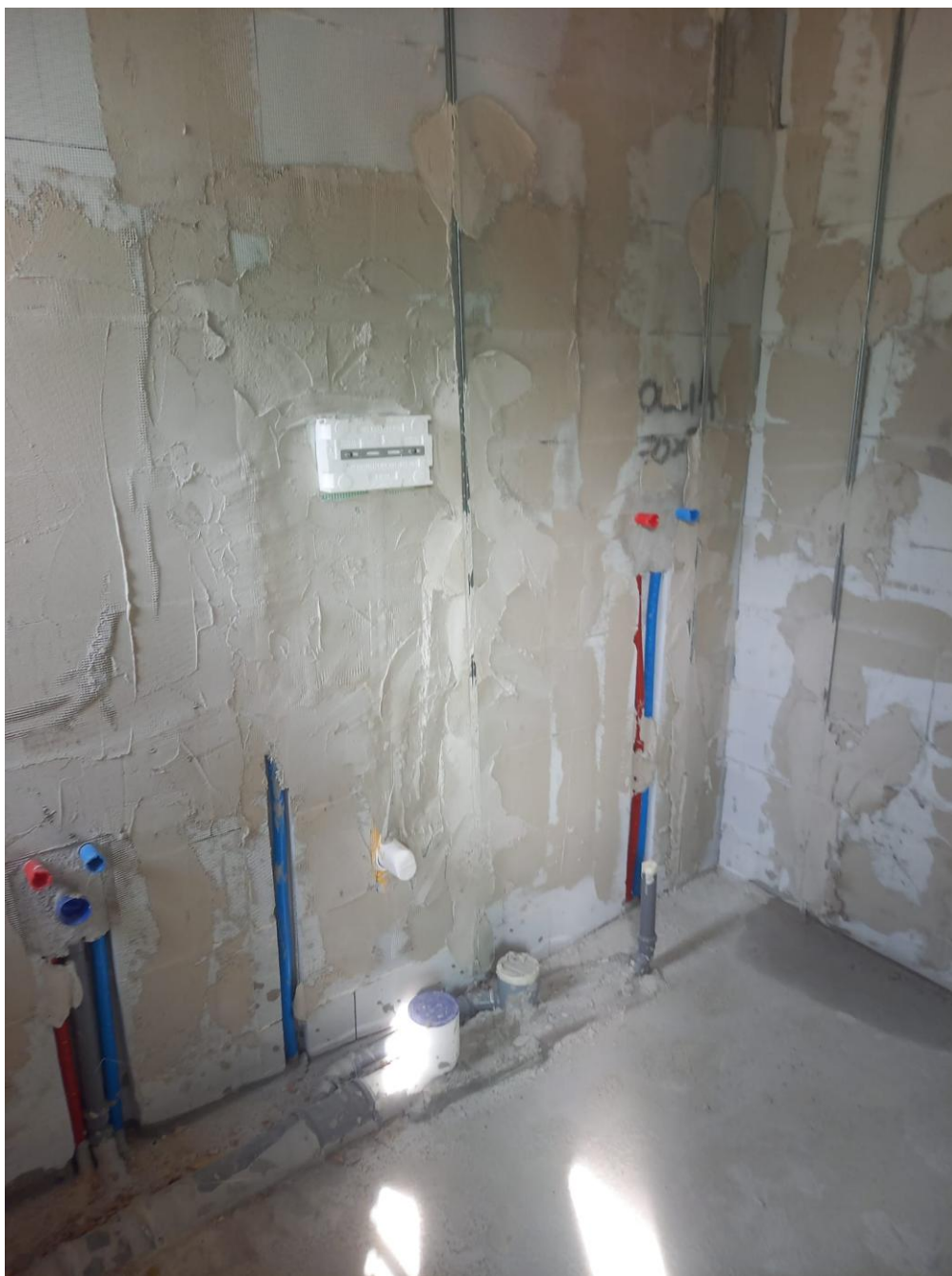
Figura 13 Rilievo fotografico del 24/09/2025