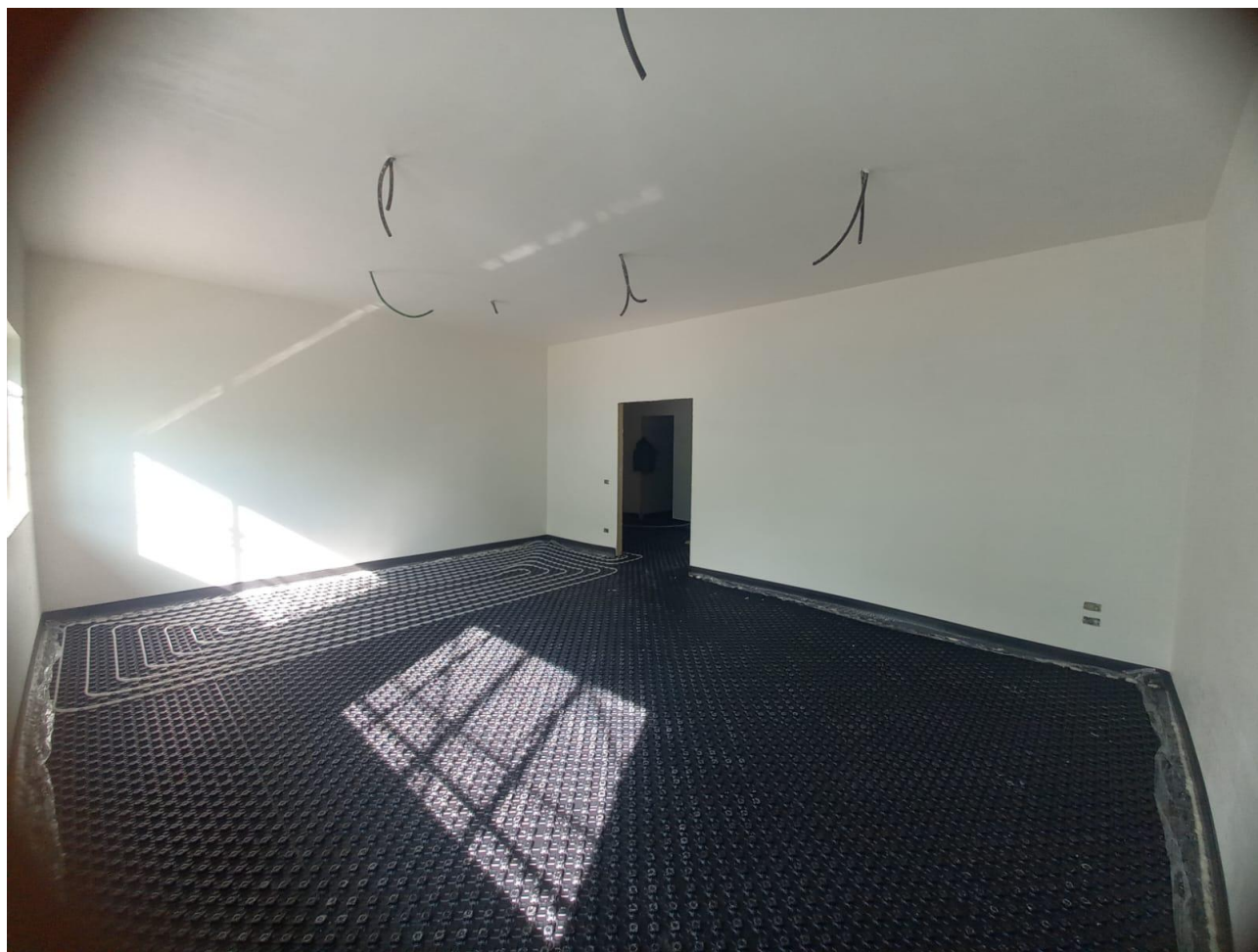
Figura 22 Rilievo fotografico del 30/10/2025