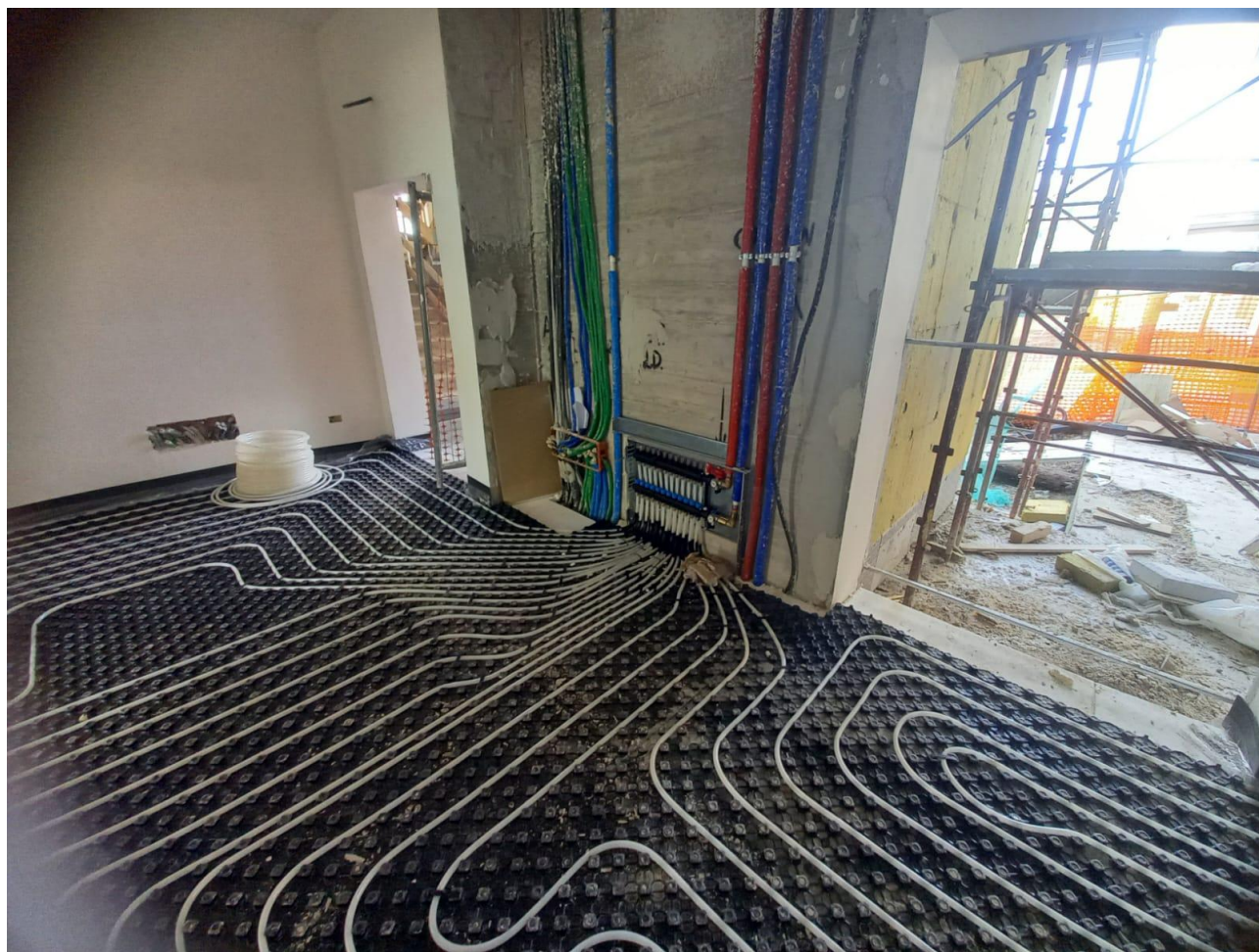
Figura 21 Rilievo fotografico del 30/10/2025