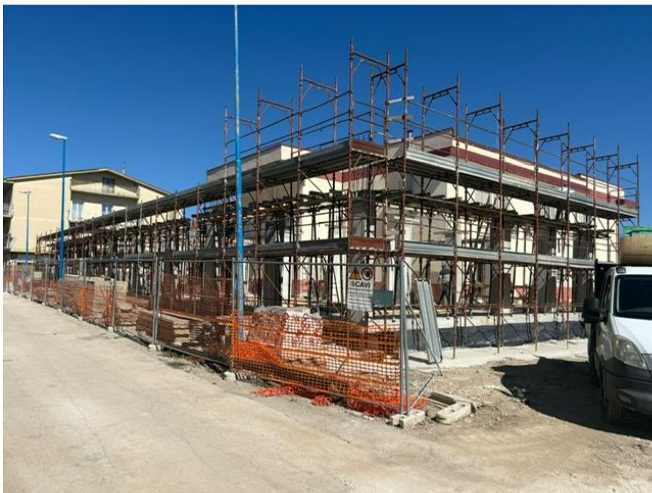
Figura 3 Installazione impalcato, rilievo fotografico del 26/05/2025