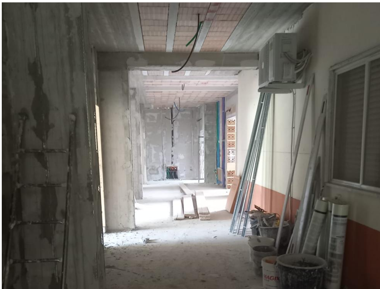
Figura 6 Rilievo fotografico del 24/09/2025