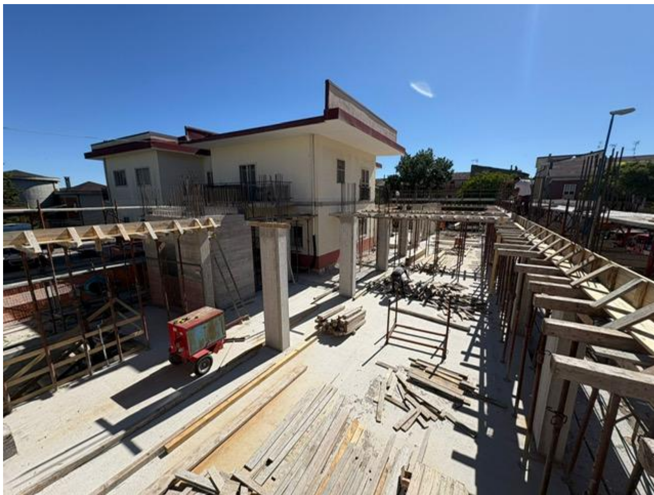
Figura 4 Ampliamento, rilievo fotografico del 26/05/2025