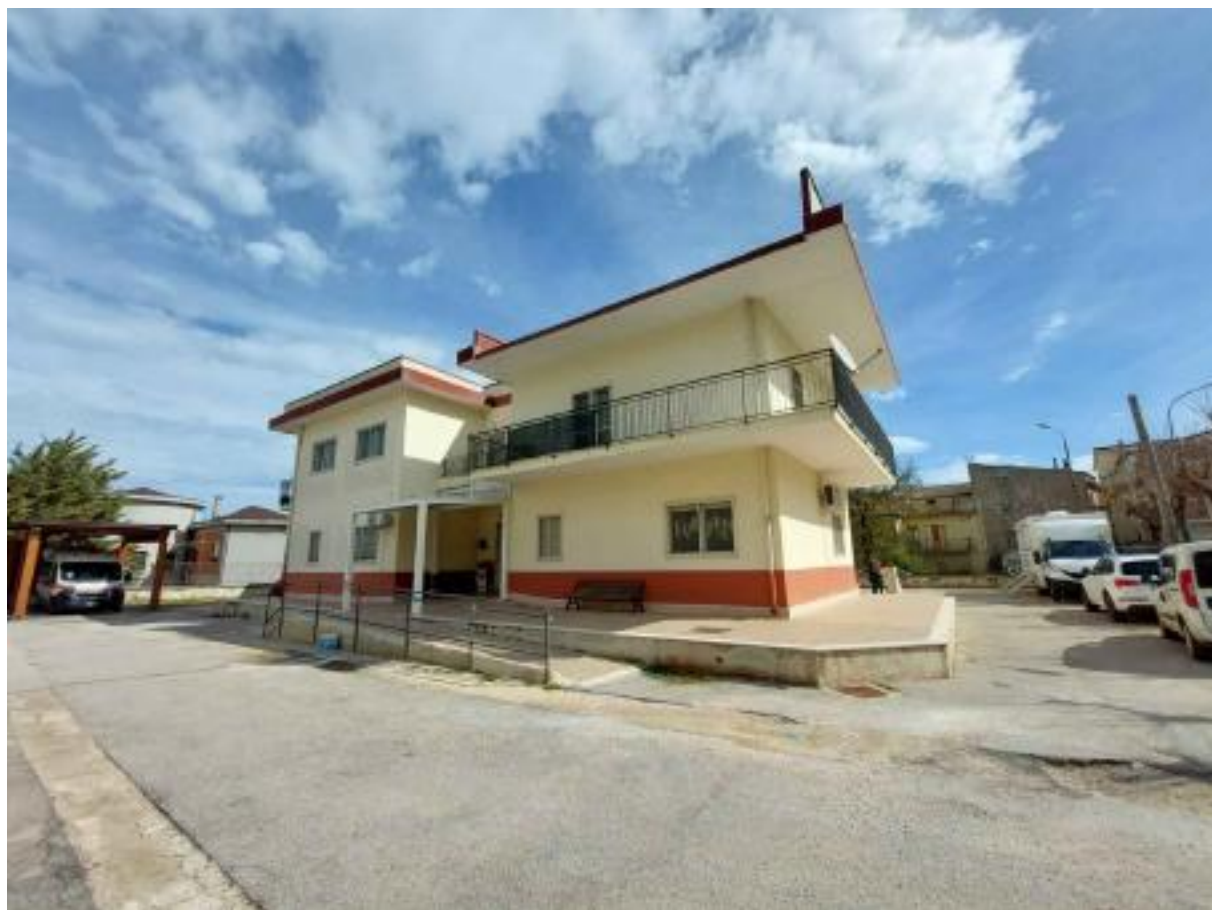
Figura 1 Ante operam