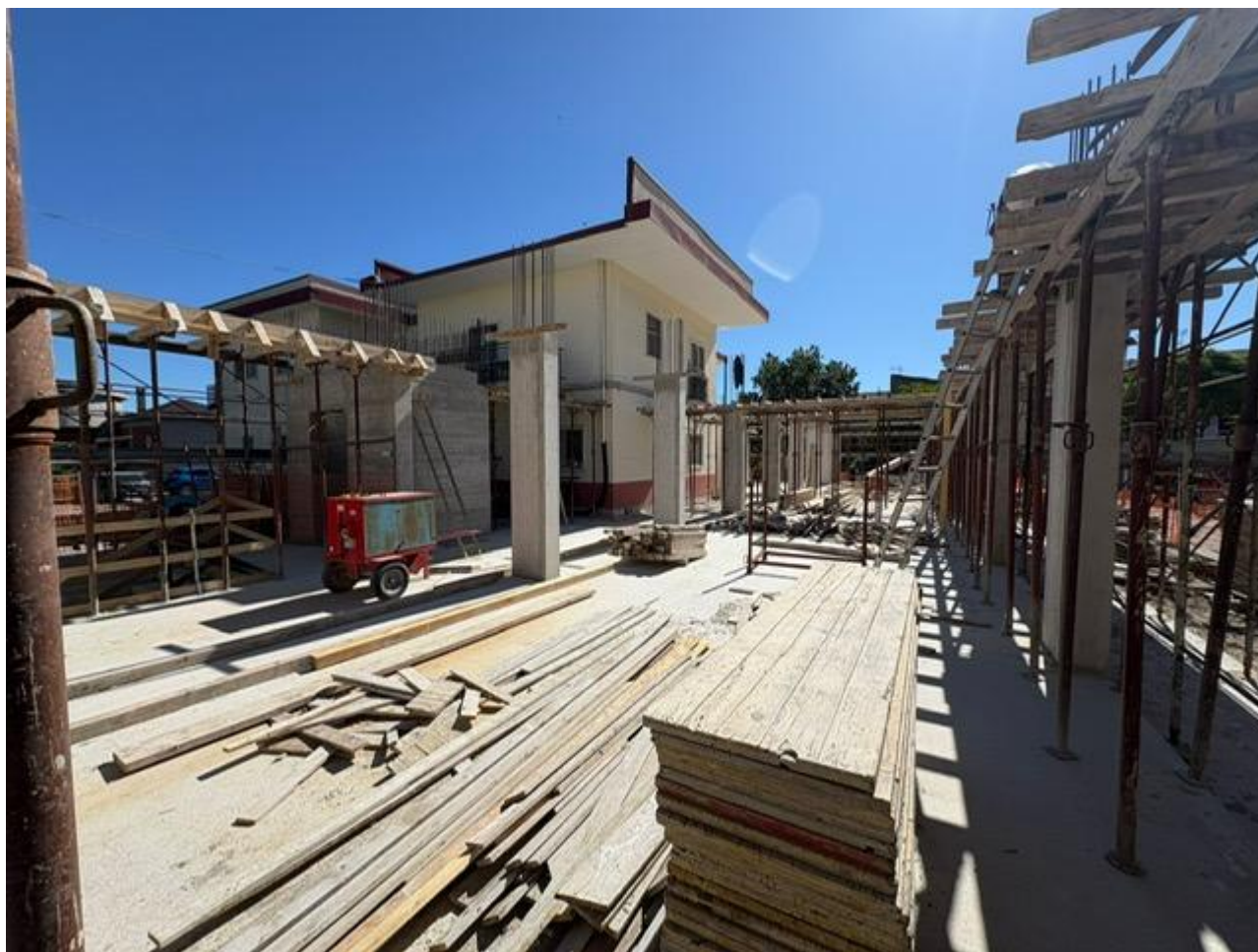
Figura 5 Ampliamento, rilievo fotografico del 26/05/2025