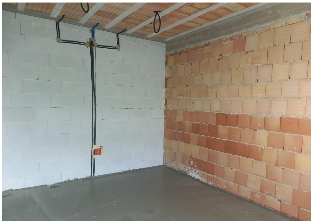
Figura 10 Rilievo fotografico del 24/09/2025