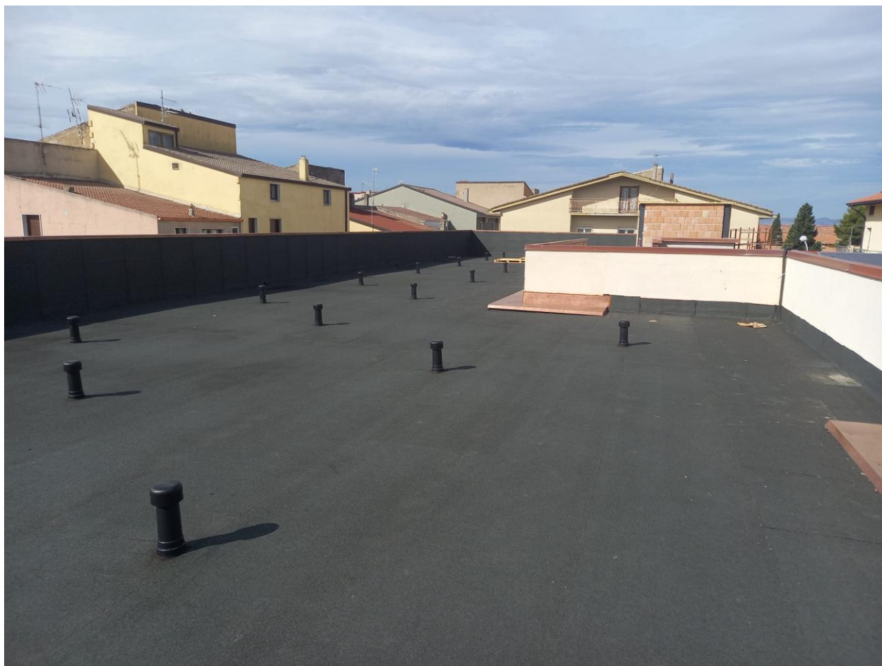
Figura 18 Rilievo fotografico del 24/09/2025