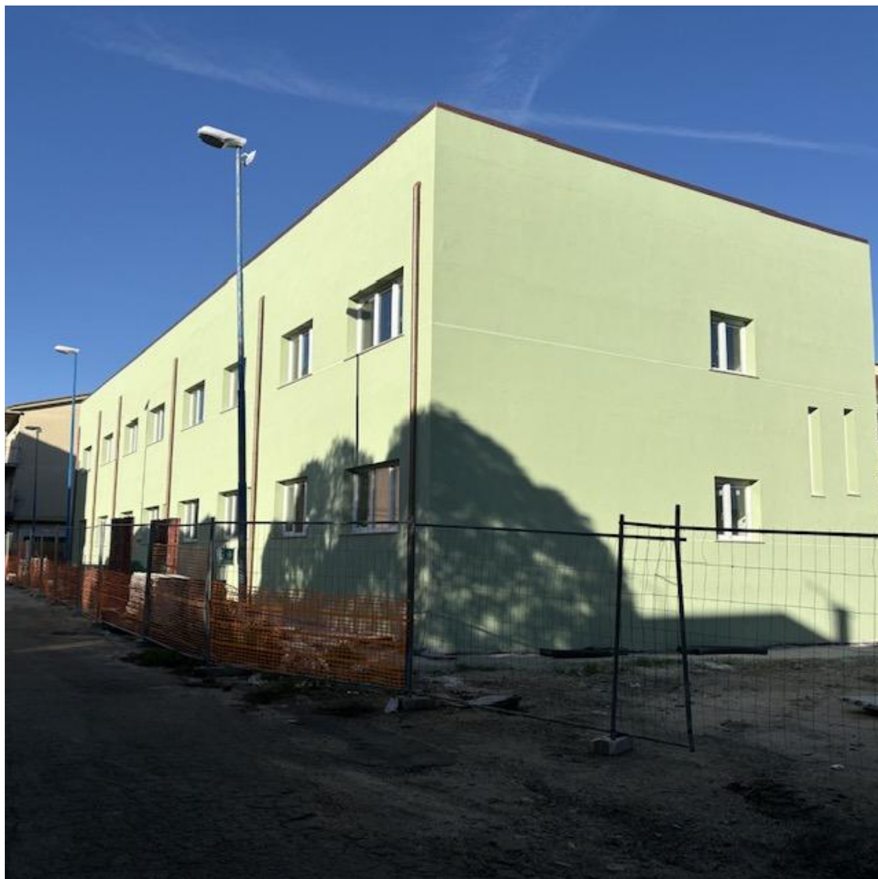
Figura 33 Rilievo fotografico del 22/12/2025