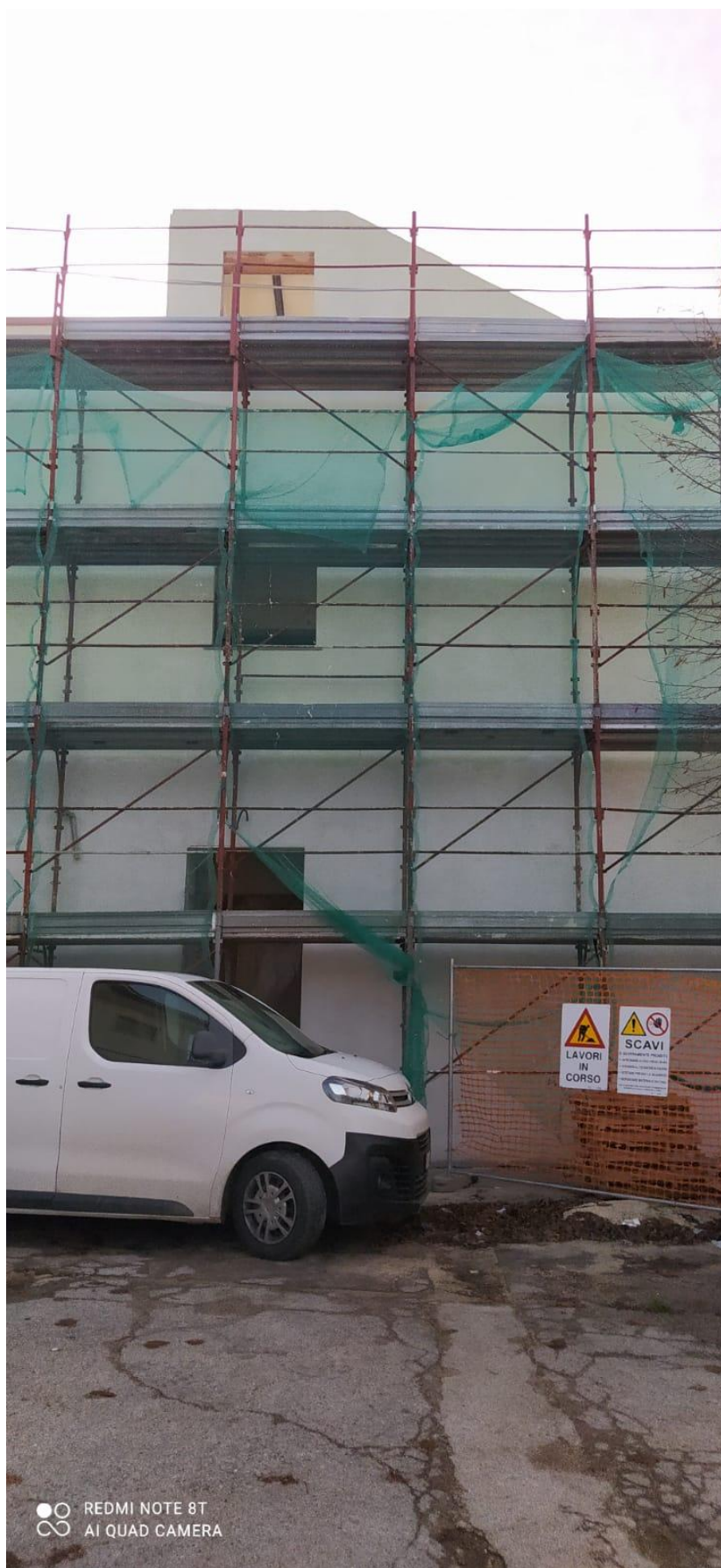
Figura 31 Rilievo fotografico del 22/12/2025