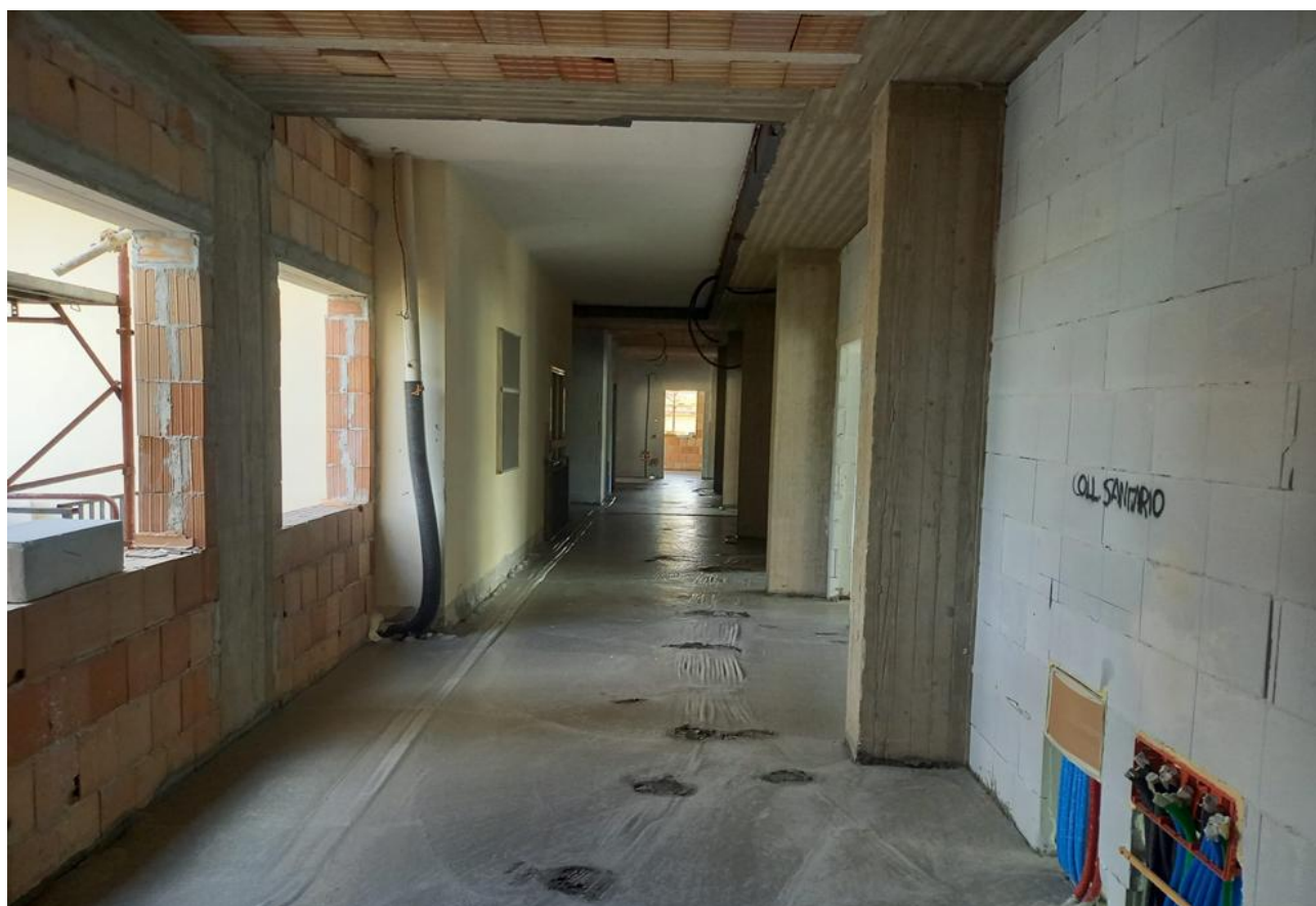
Figura 8 Rilievo fotografico del 24/09/2025