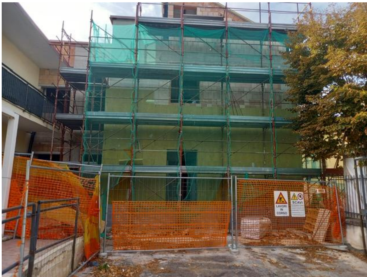
Figura 15 Rilevamento fotografico del 24/09/2025