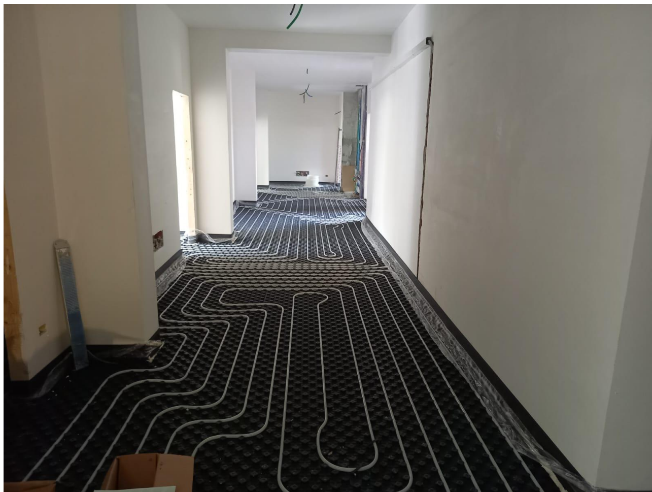
Figura 24 Rilievo fotografico del 30/10/2025