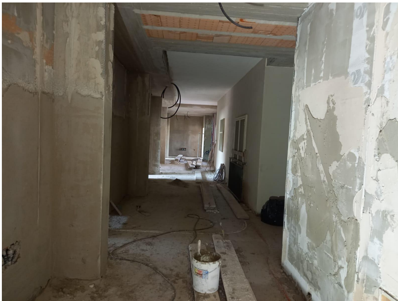
Figura 23 Rilievo fotografico del 30/10/2025