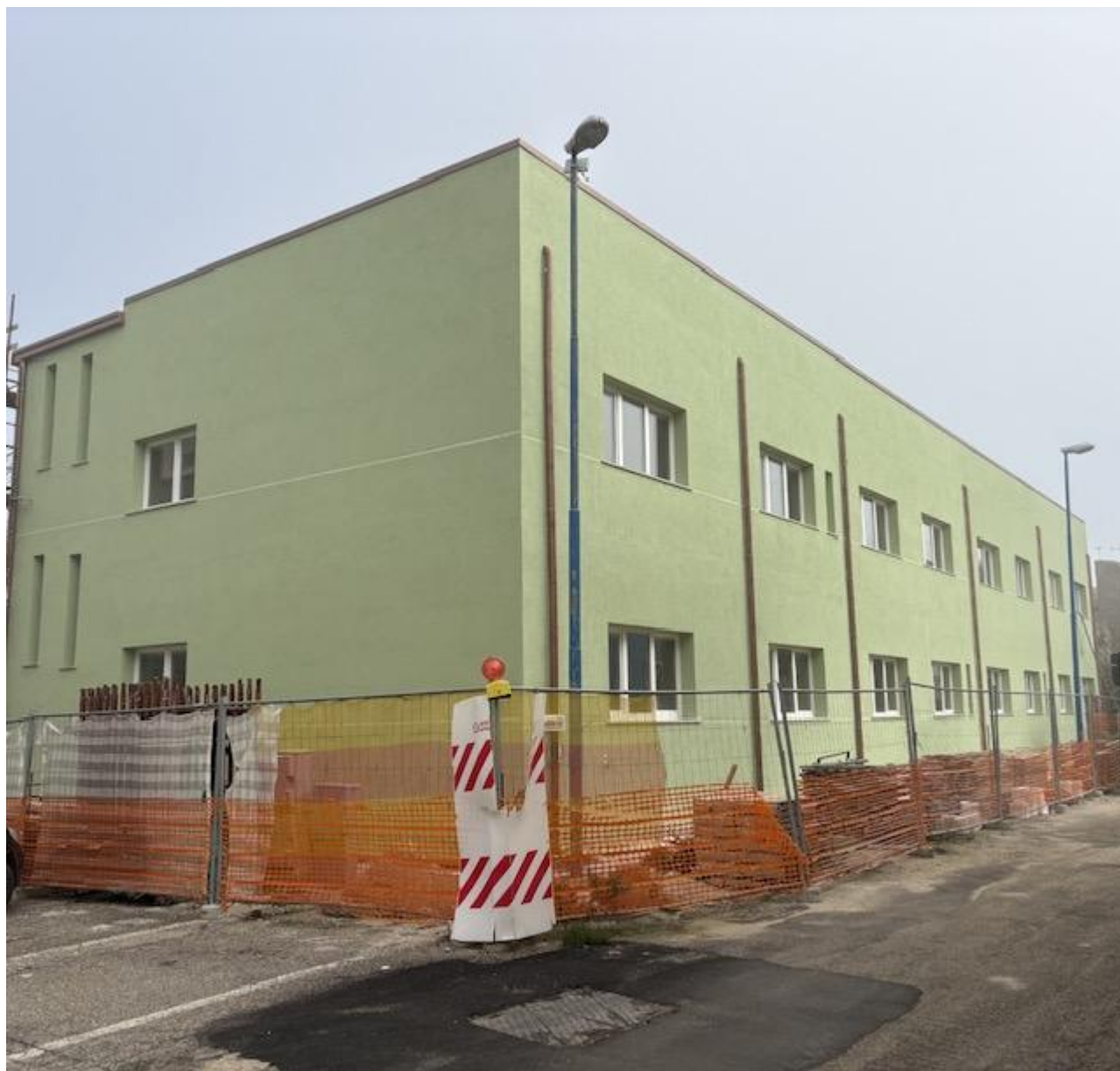
Figura 34 Rilievo fotografico del 22/12/2025