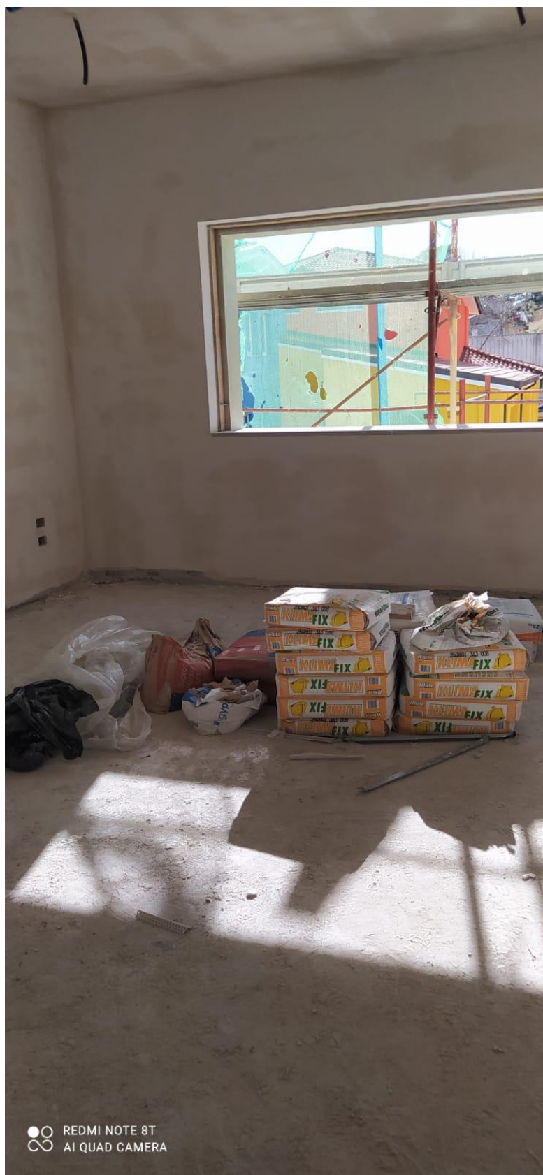
Figura 27 Rilievo fotografico del 22/12/2025