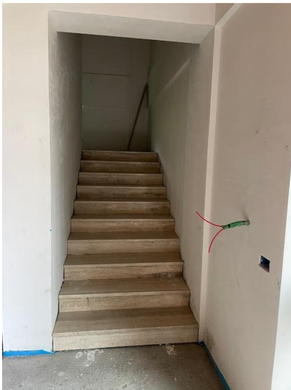
Figura 38 Rilievo fotografico del 07/01/2025