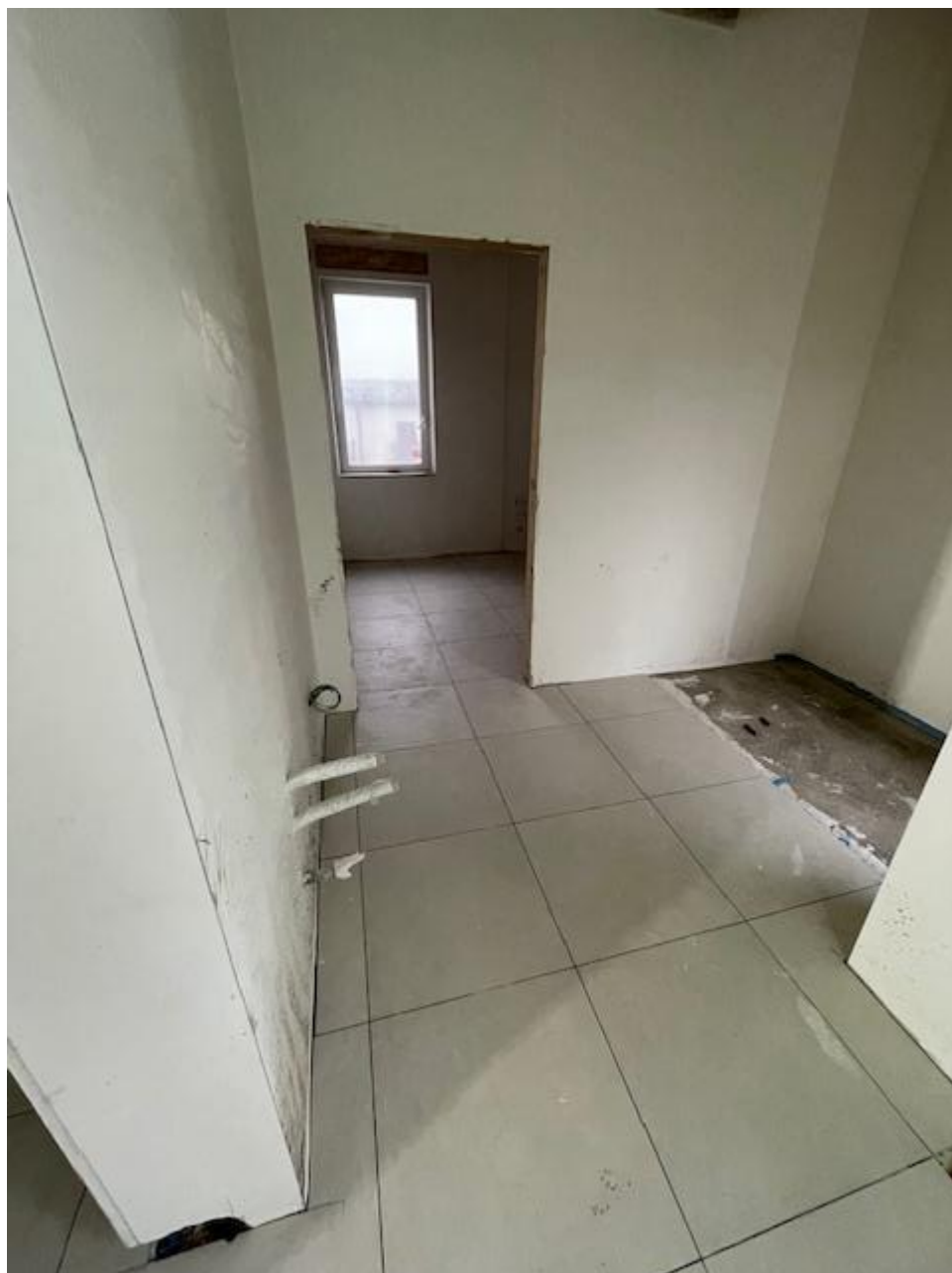
Figura 34 Rilievo fotografico del 07/01/2025