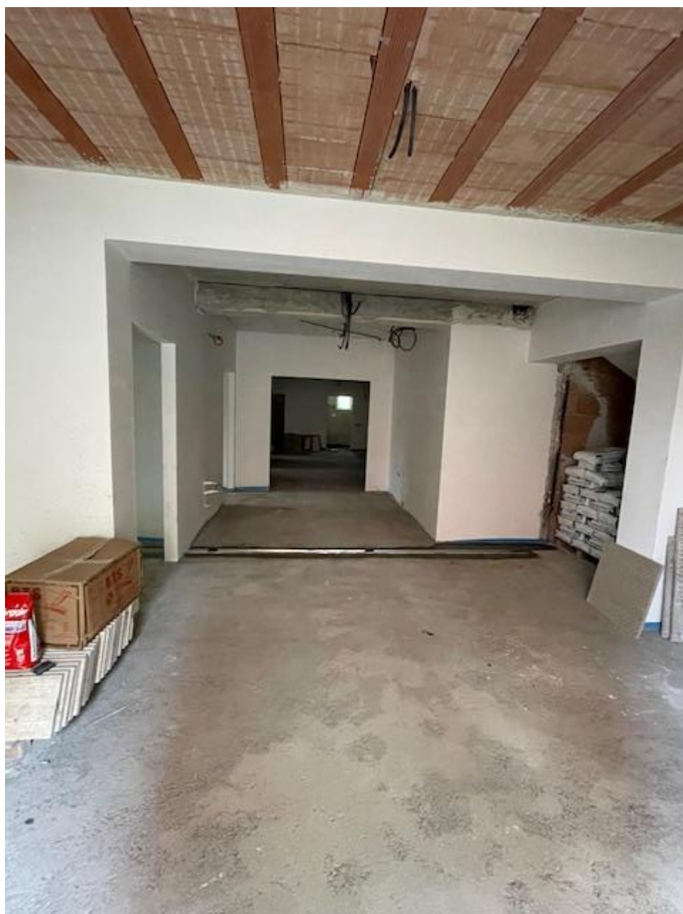
Figura 37 Rilievo fotografico del 07/01/2025