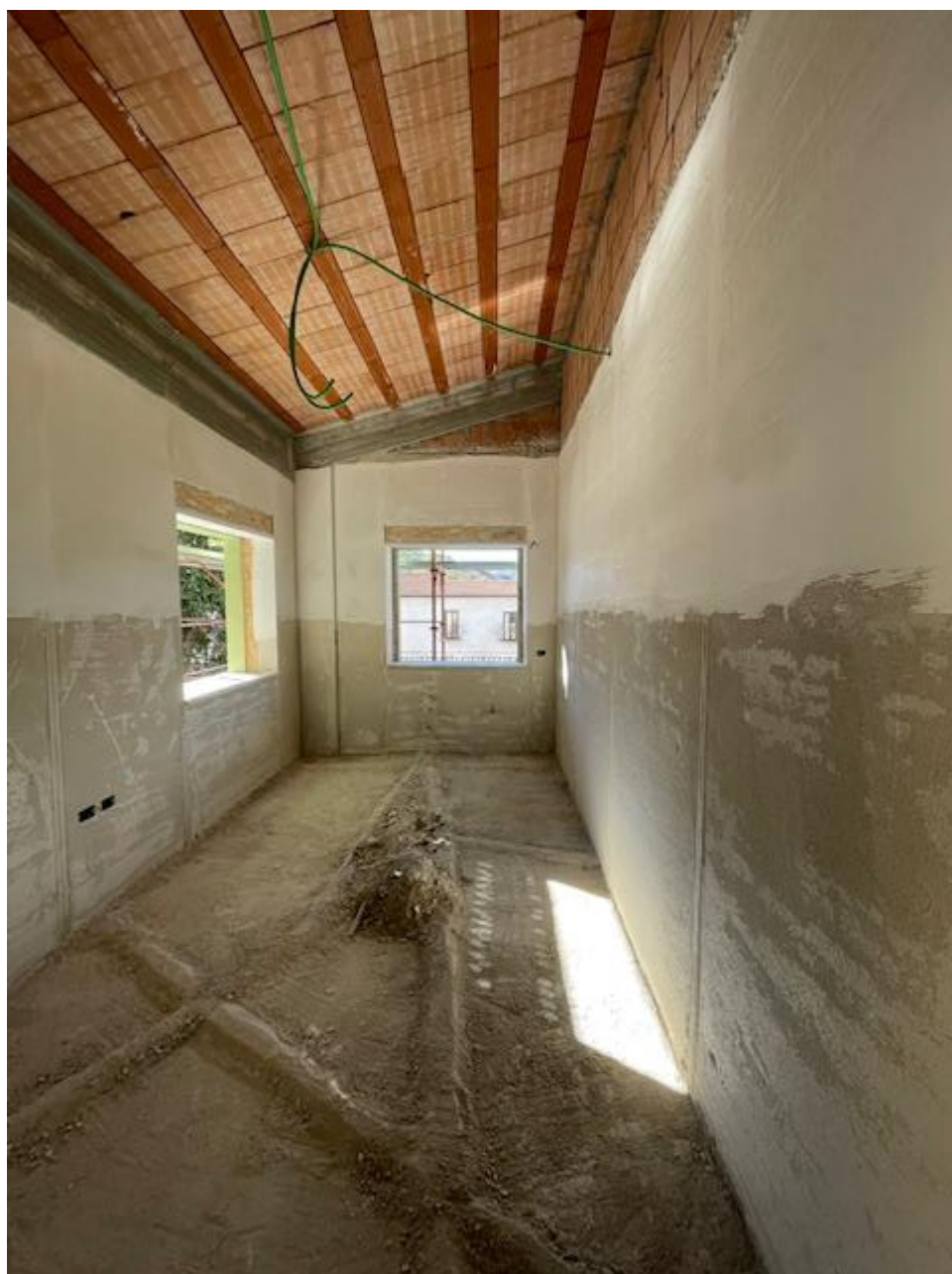
Figura 23 Rilievo fotografico del 13/11/2025