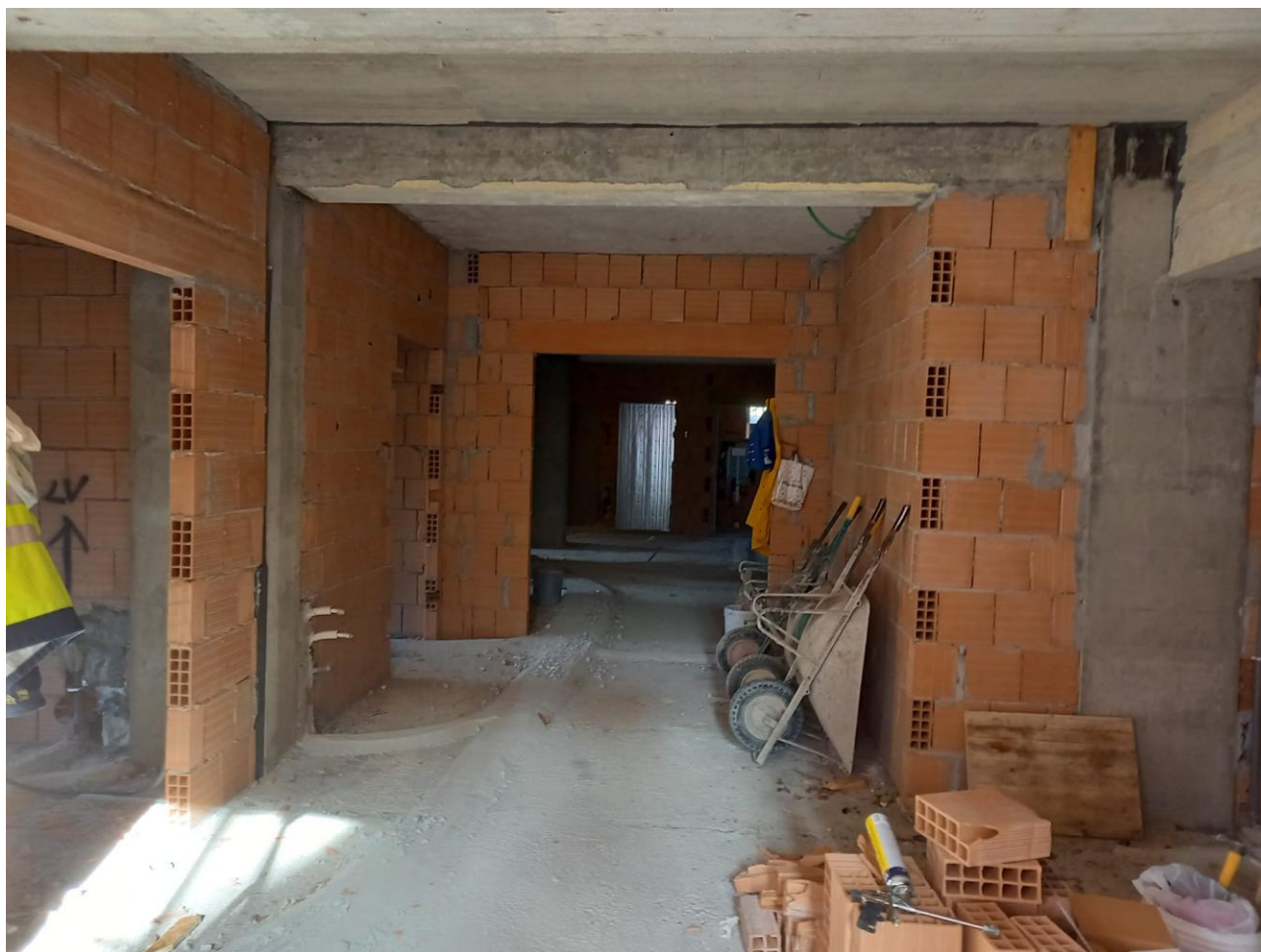
Figura 10 Rilievo fotografico del 23/10/2025