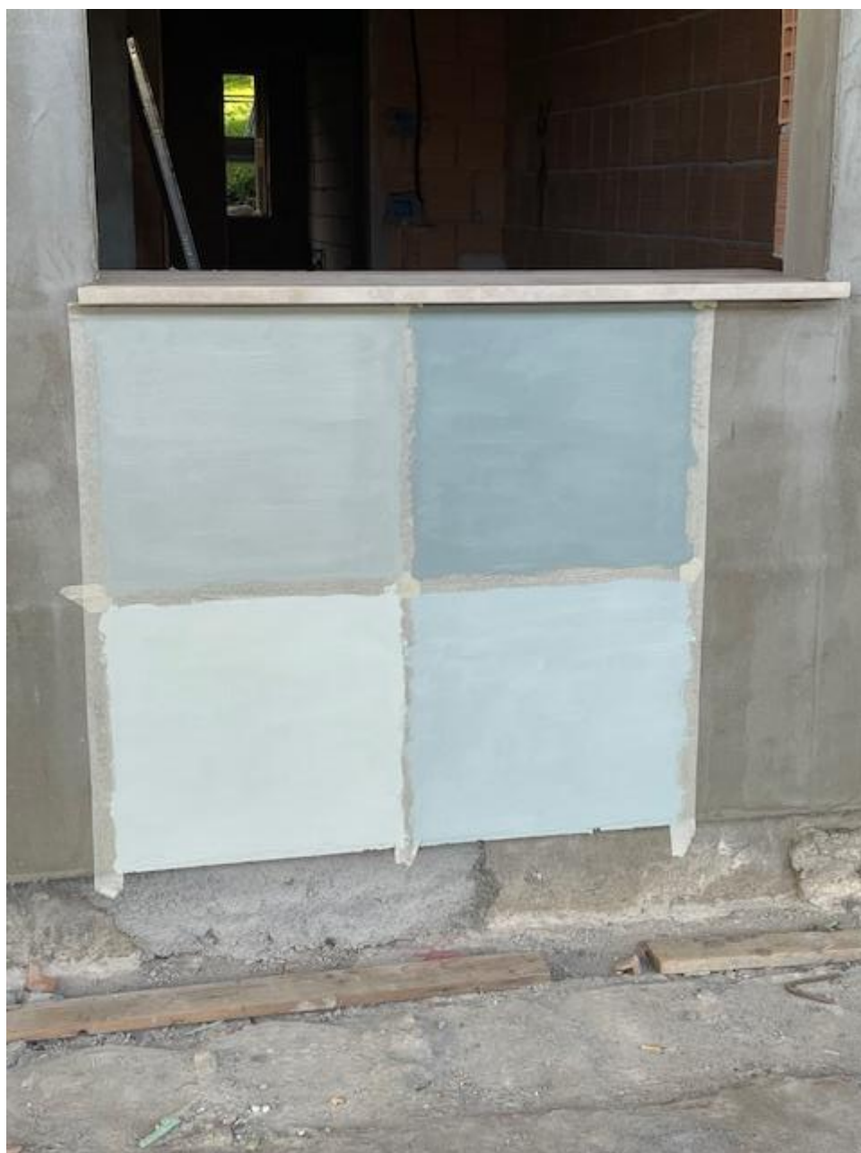
Figura 13 Rilievo fotografico del 23/10/2025