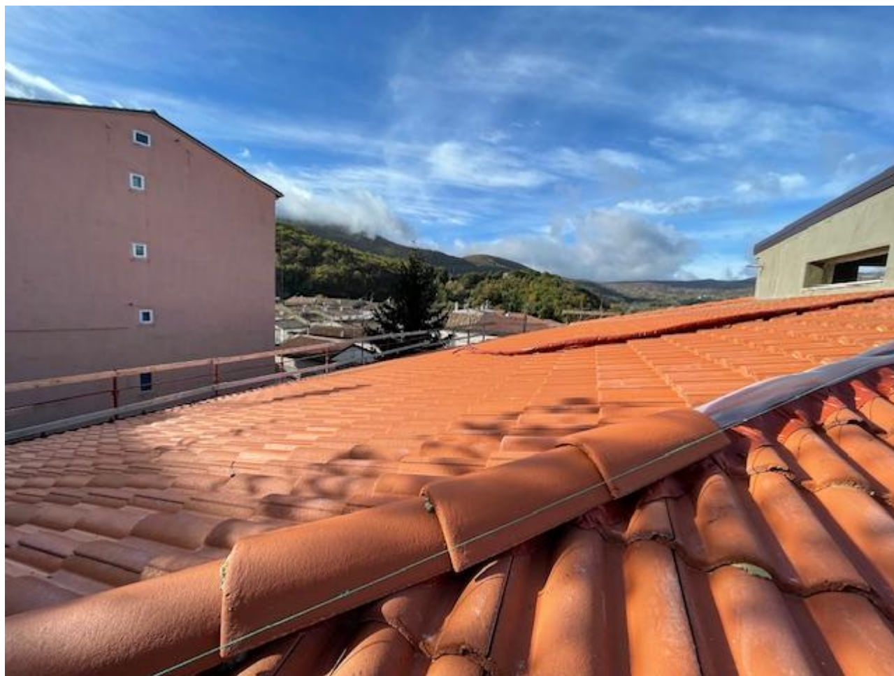
Figura 14 Rilievo fotografico del 23/10/2025