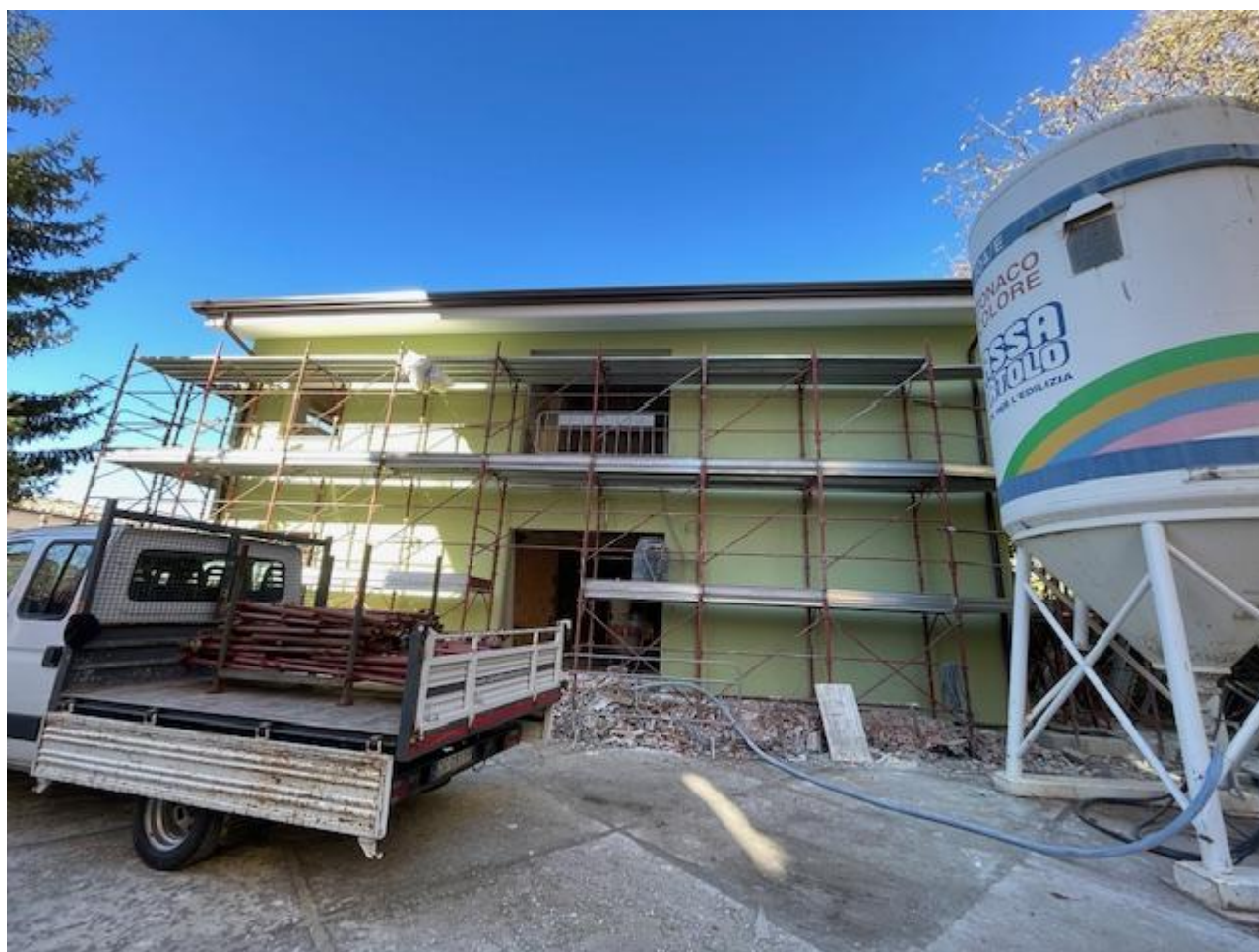
Figura 21 Rilievo fotografico del 13/11/2025