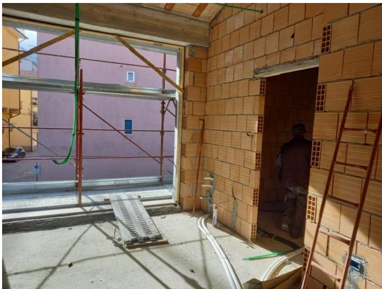
Figura 8 Rilievo fotografico del 23/10/2025