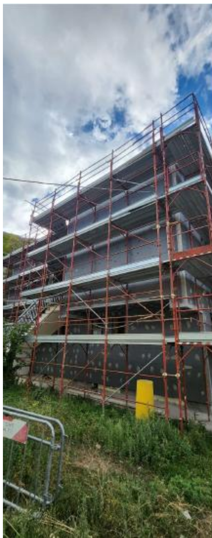
Figura 6 Realizzazione del cappotto sul fabbricato esistente, rilievo fotografico del 18/09/2025