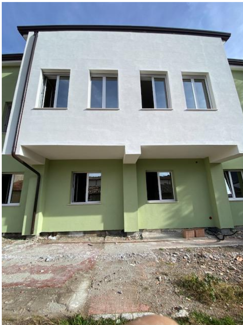
Figura 42 Rilievo fotografico del 22/12/2025