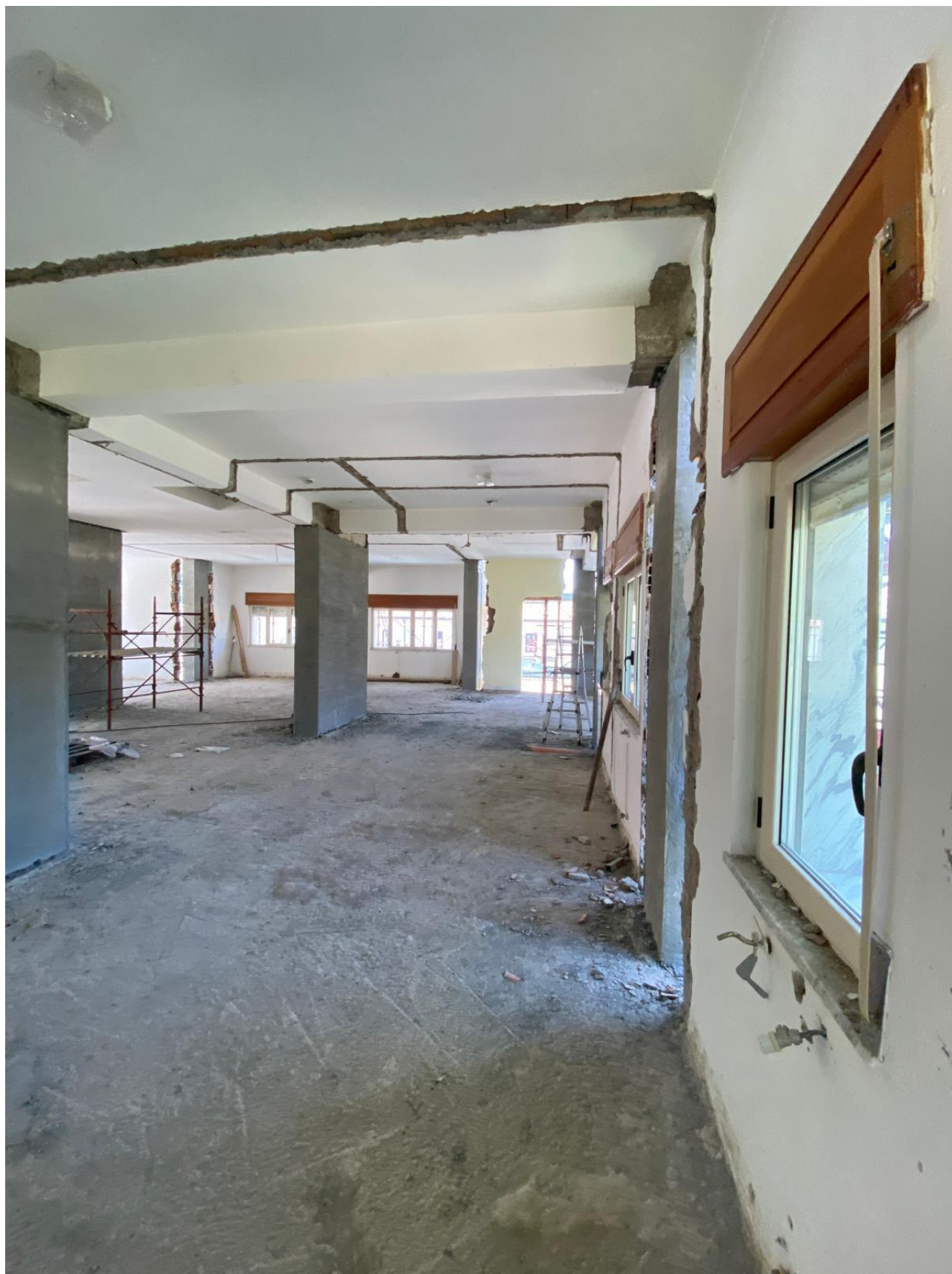
Figura 3 Lavori di ristrutturazione interni, rilievi fotografici del 27/06/2025