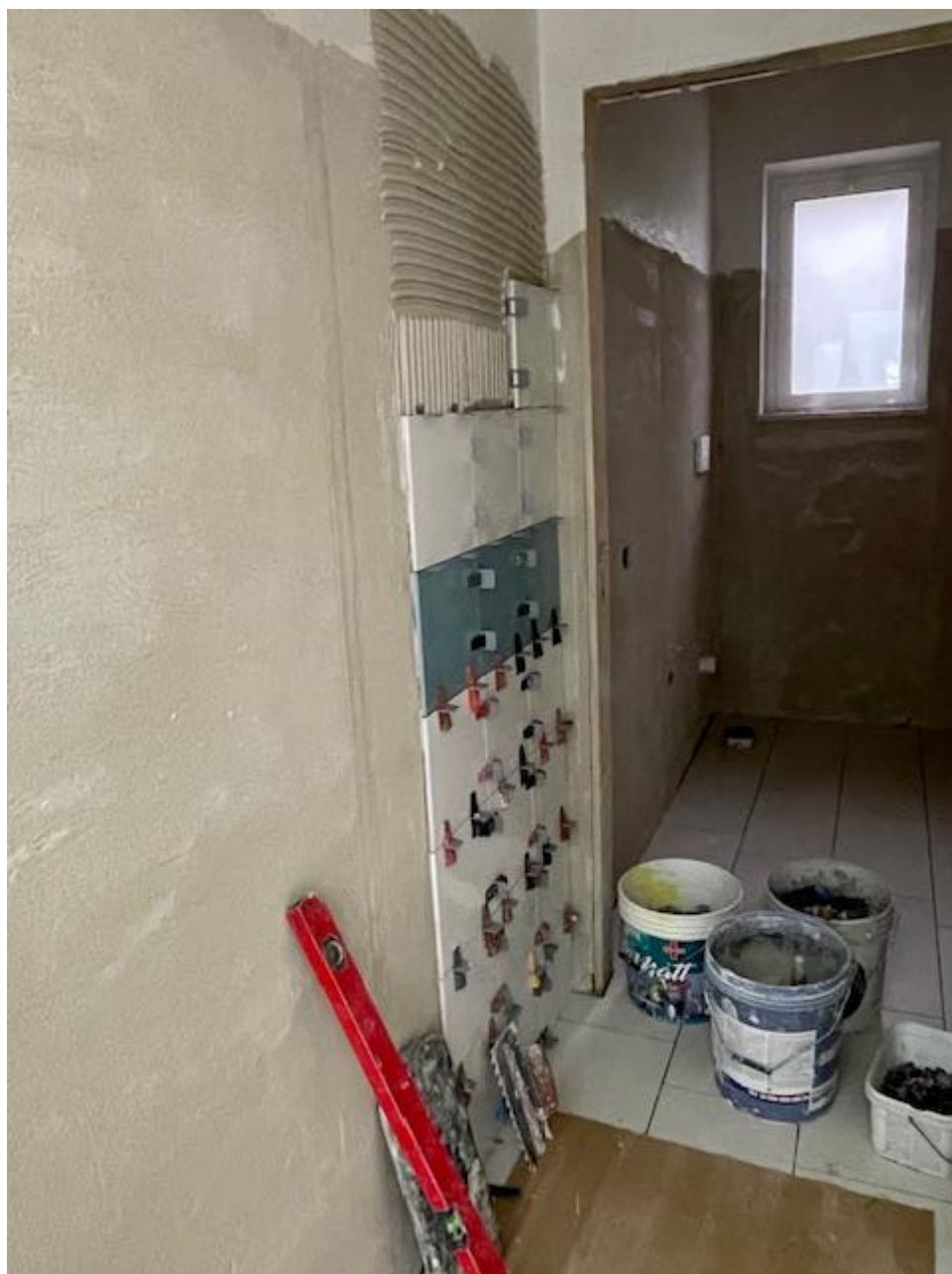
Figura 33 Rilievo fotografico del 07/01/2025