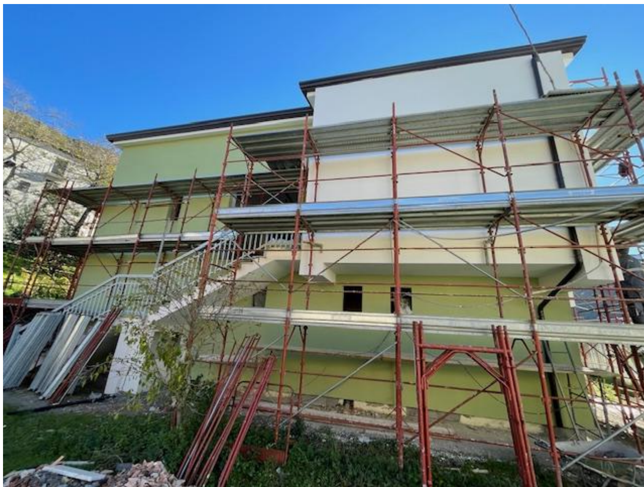
Figura 19 Rilievo fotografico del 13/11/2025