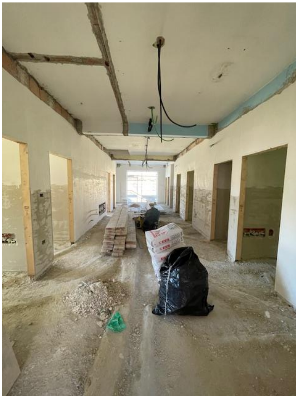
Figura 24 Rilievo fotografico del 13/11/2025