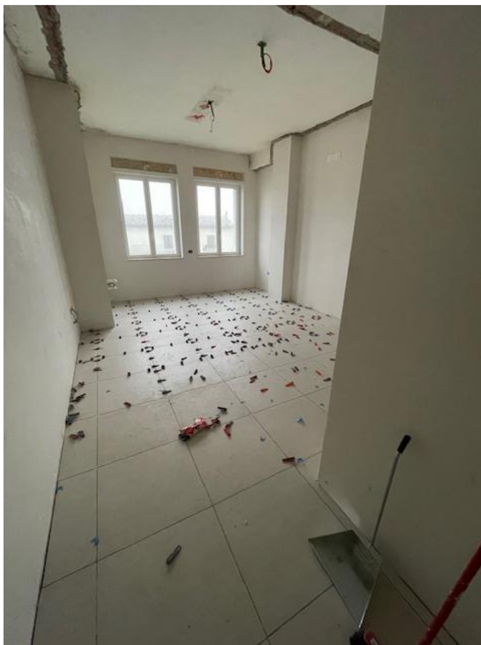
Figura 36 Rilievo fotografico del 07/01/2025