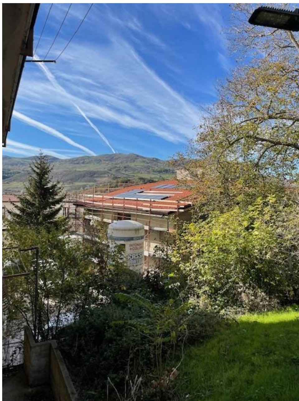
Figura 32 Rilievo fotografico del 06/01/2025