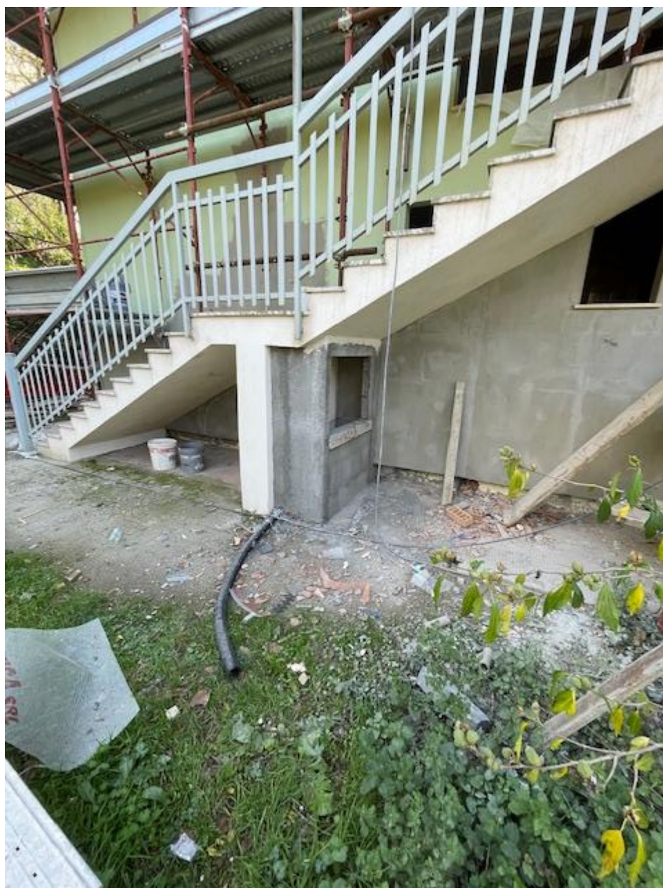
Figura 18 Rilievo fotografico del 23/10/2025