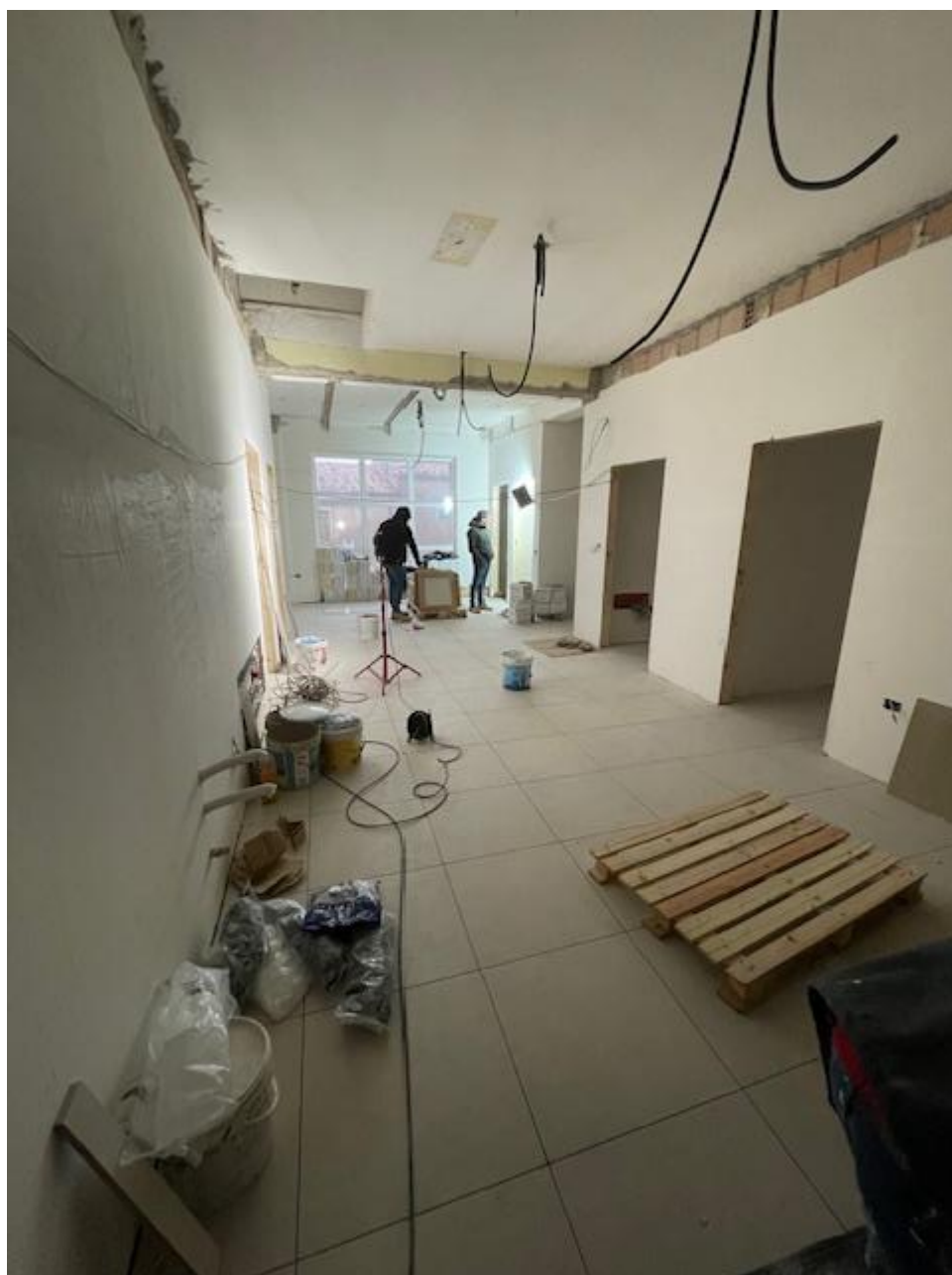
Figura 35 Rilievo fotografico del 07/01/2025