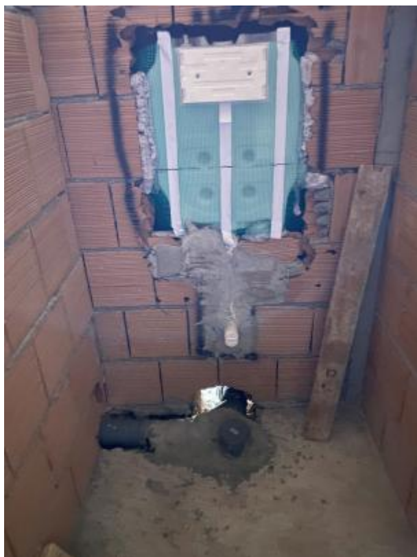
Figura 7 Impianto idrico sanitario