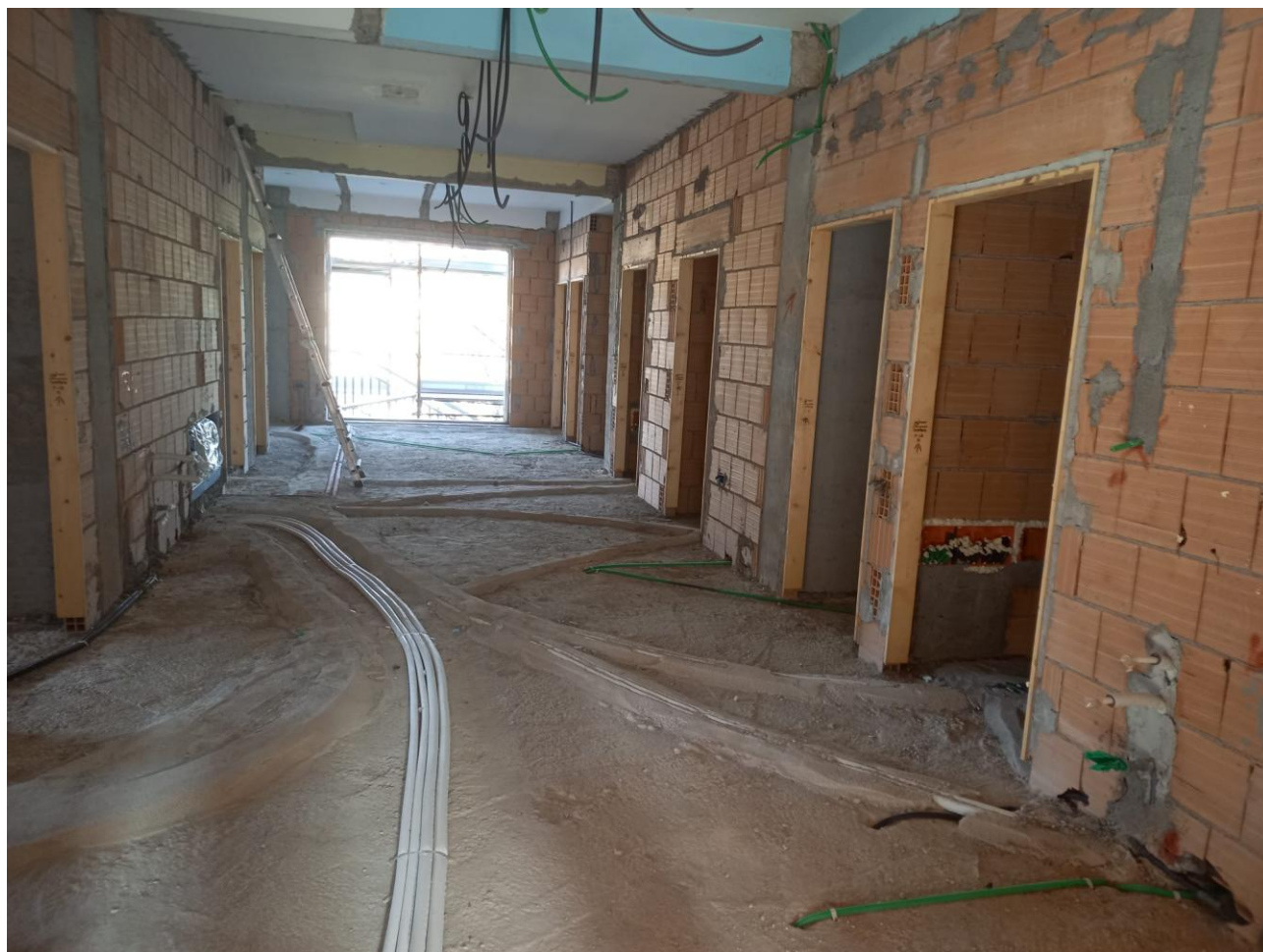
Figura 9 Rilievo fotografico del 23/10/2025