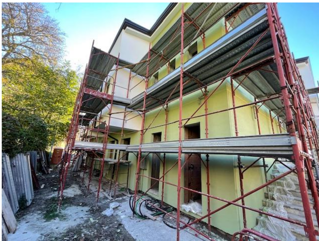
Figura 20 Rilievo fotografico del 13/11/2025