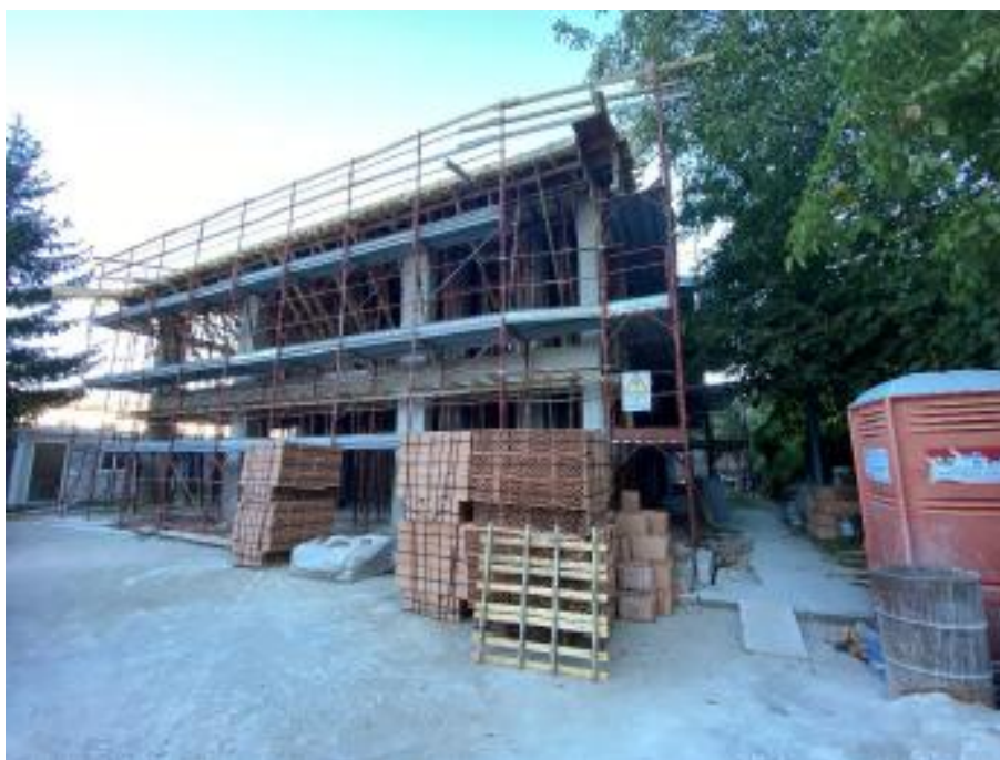
Figura 4 Nuovo corpo di fabbrica, rilievo fotografico del 18/09/2025