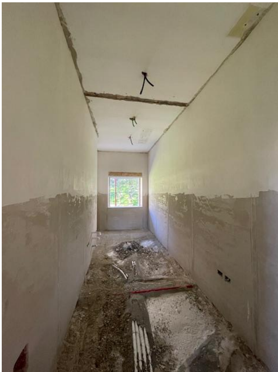
Figura 25 Rilievo fotografico del 13/11/2025