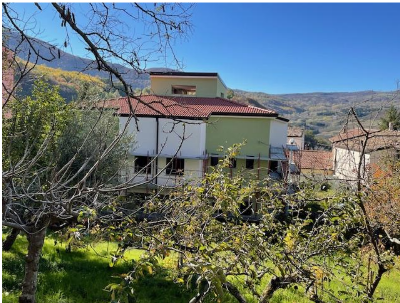
Figura 26 Rilievo fotografico del 13/11/2025