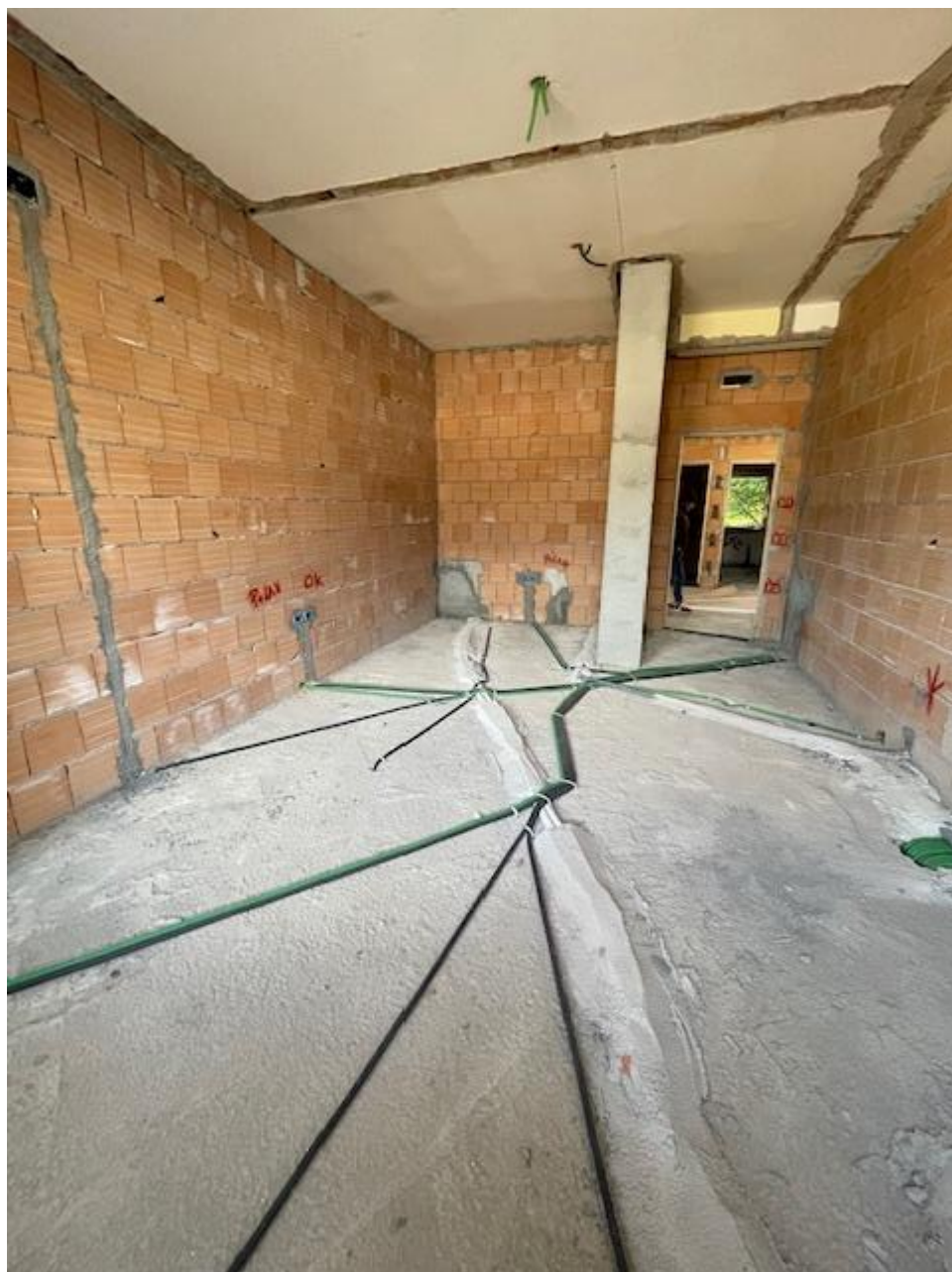
Figura 15 Rilievo fotografico del 23/10/2025