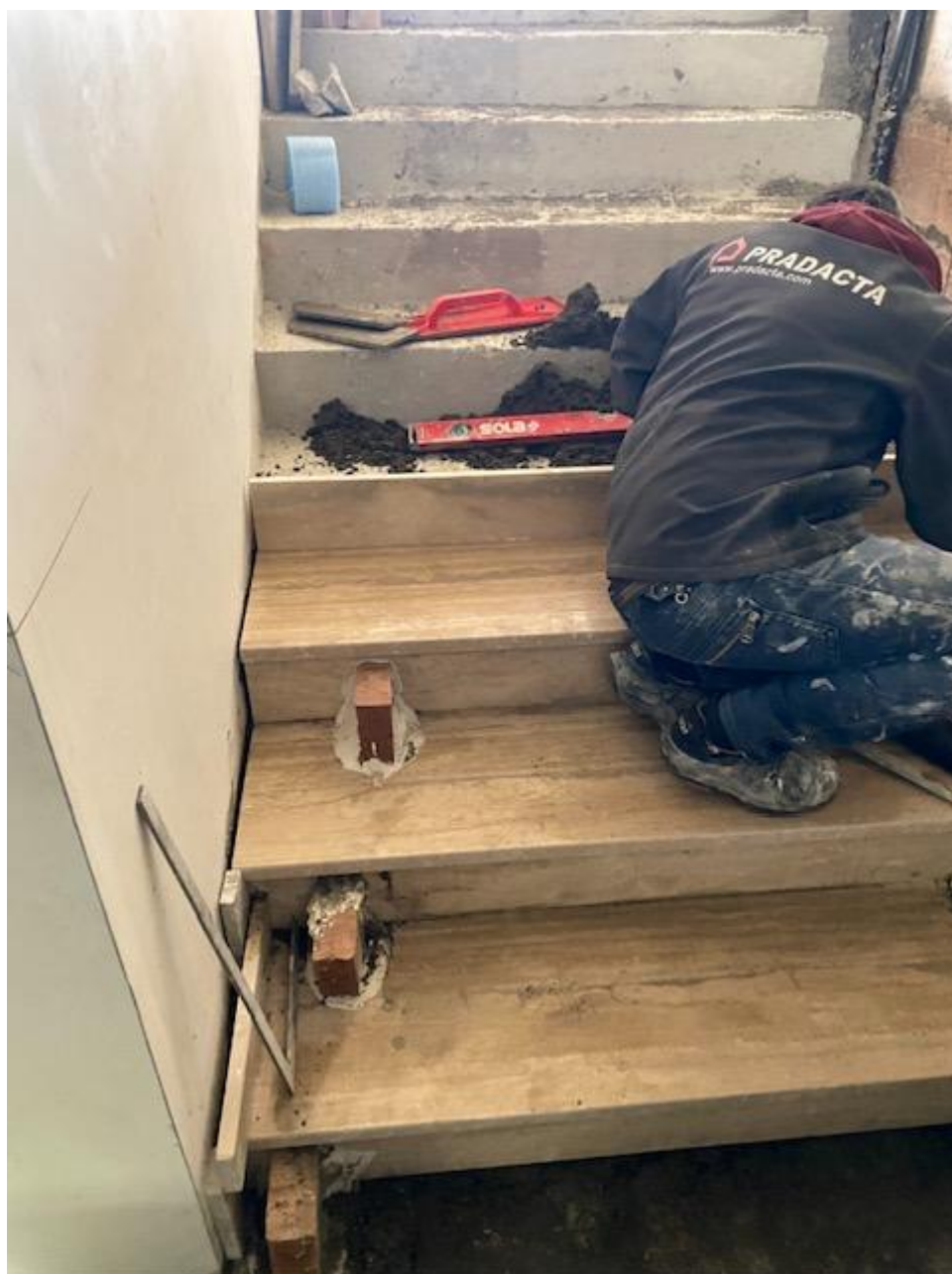
Figura 39 Rilievo fotografico del 22/12/2025