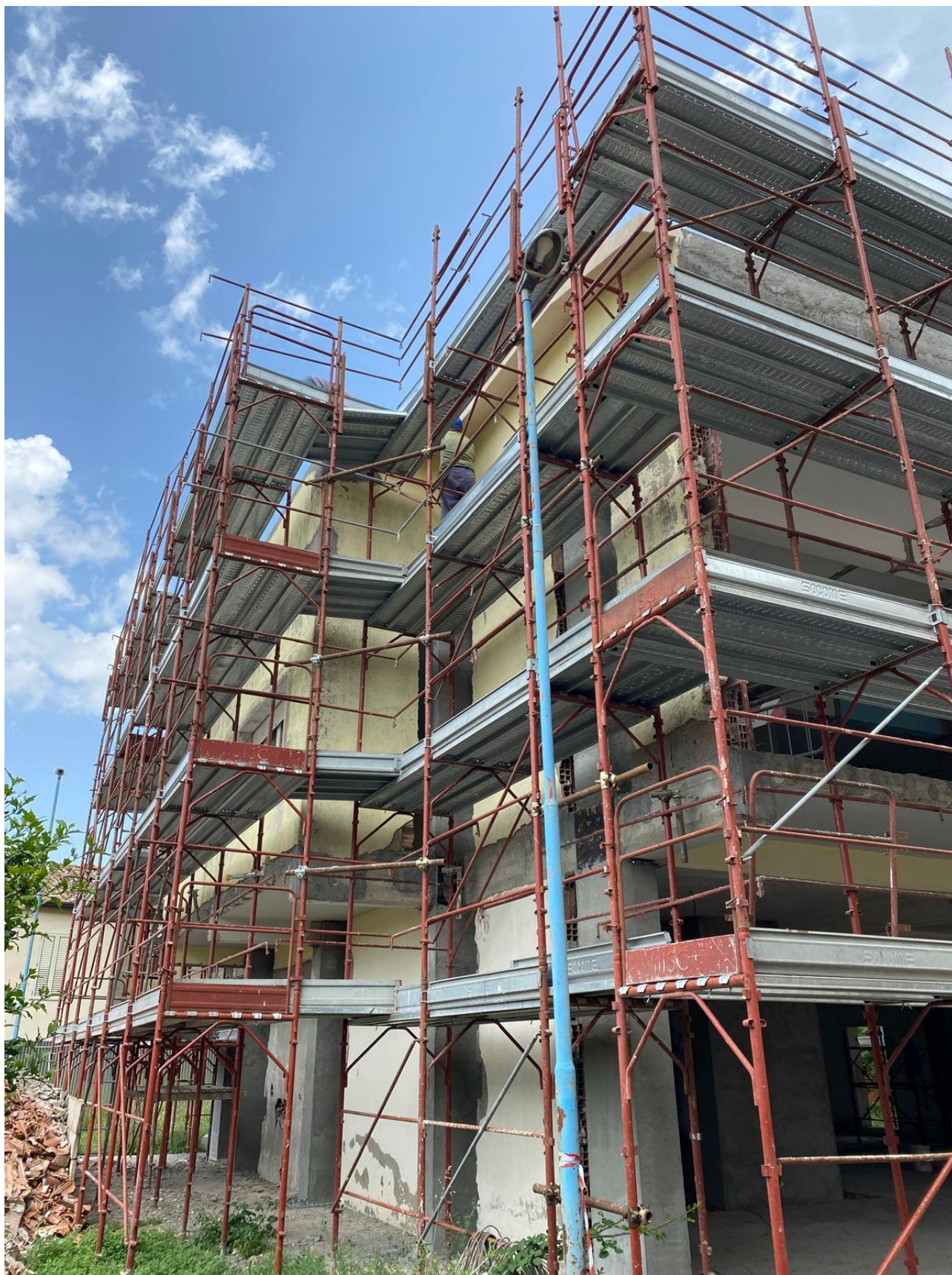
Figura 2 Montaggio ponteggio per ristrutturazione estern, rilievo fotografico del 27/06/2025