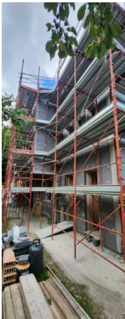
Figura 5 Realizzazione del cappotto sul fabbricato esistente, rilievo fotografico del 18/09/2025