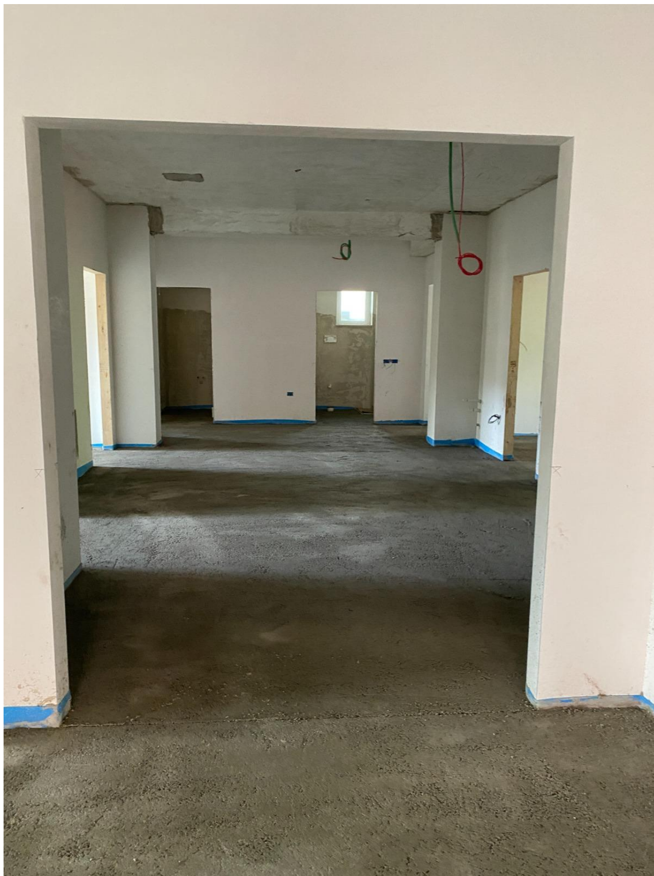
Figura 40 Rilievo fotografico del 22/12/2025