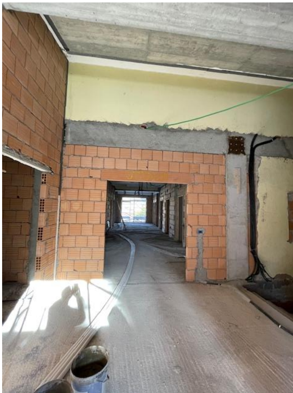
Figura 16 Rilievo fotografico del 23/10/2025