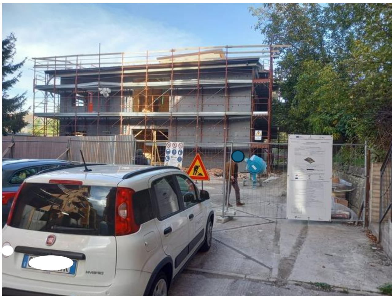
Figura 11 Rilievo fotografico del 23/10/2025