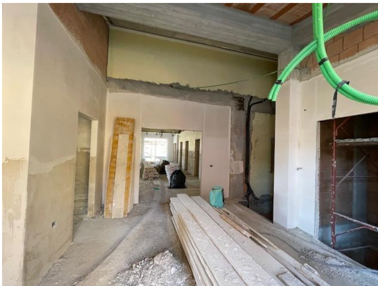
Figura 22 Rilievo fotografico del 13/11/2025