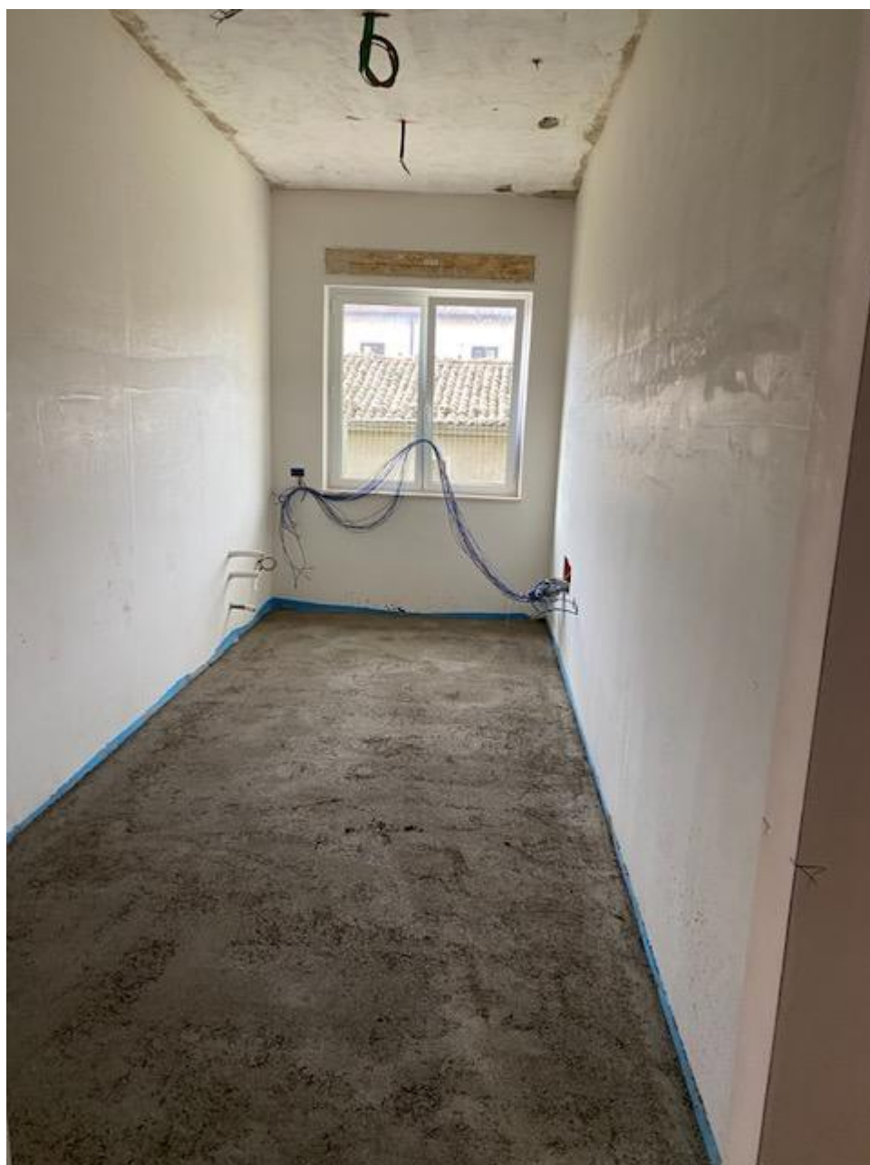
Figura 29 Rilievo fotografico del 22/12/2025