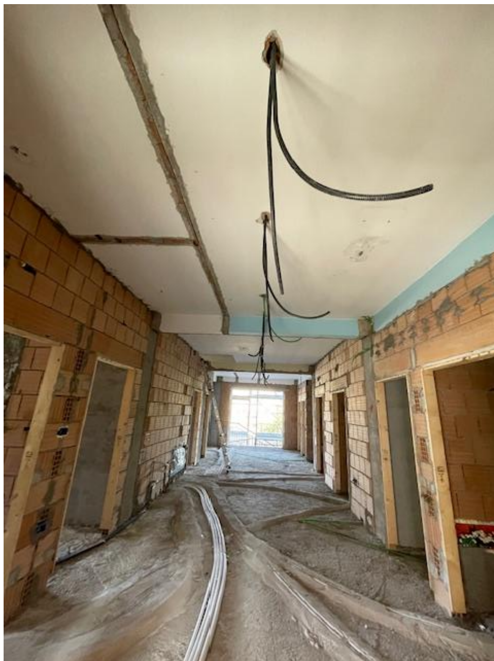
Figura 17 Rilievo fotografico del 23/10/2025