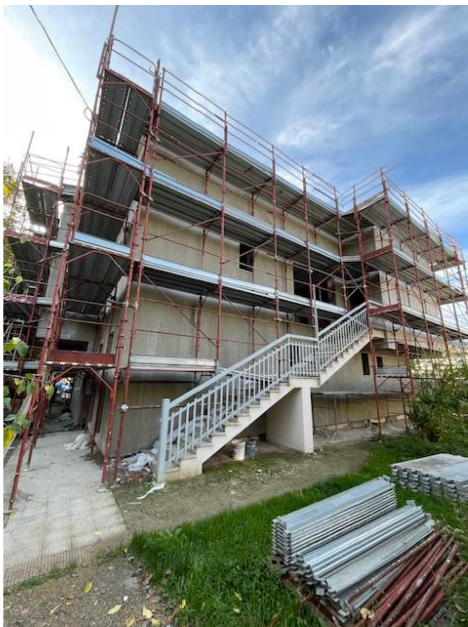
Figura 12 Rilievo fotografico del 23/10/2025