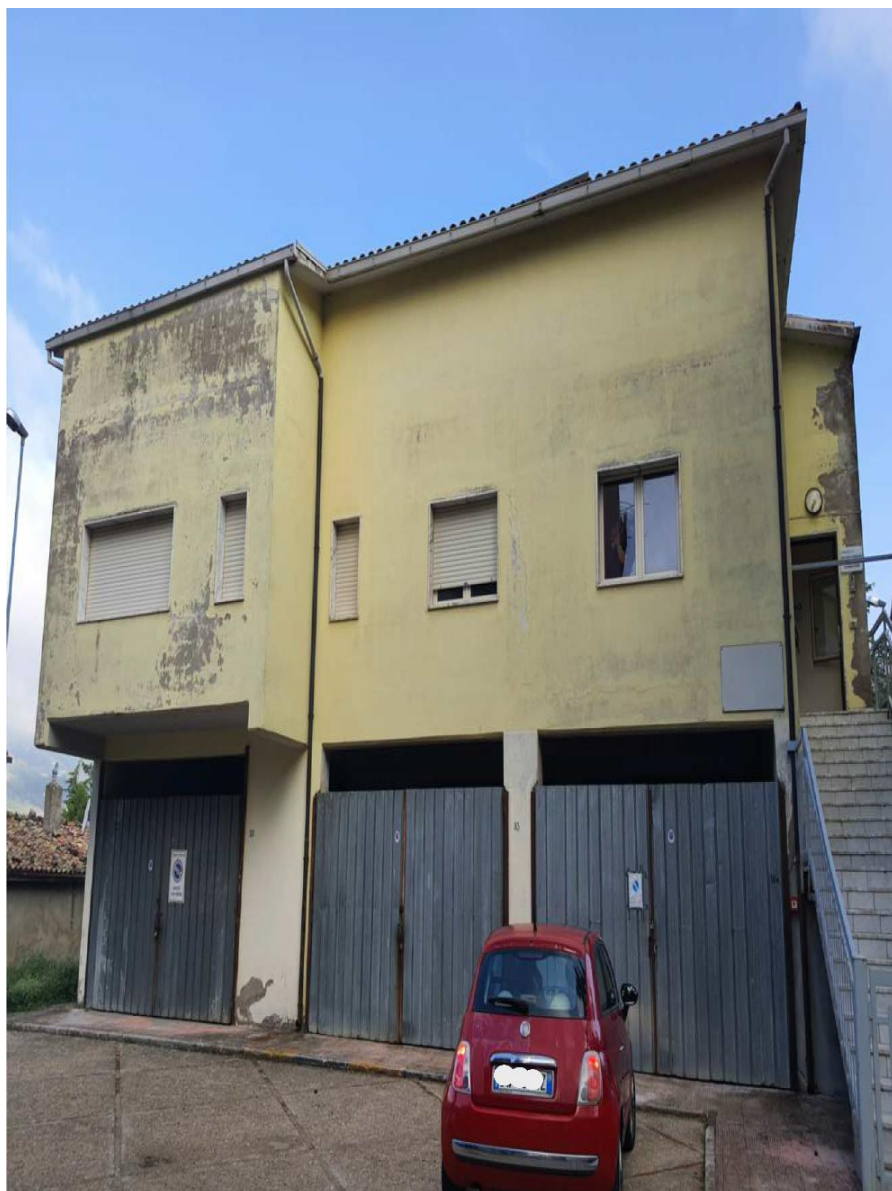
Figura 1 Ante operam