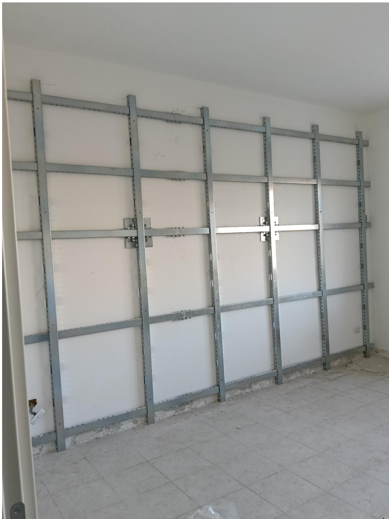
Figura 21 Rilievo fotografico del 20/10/2025