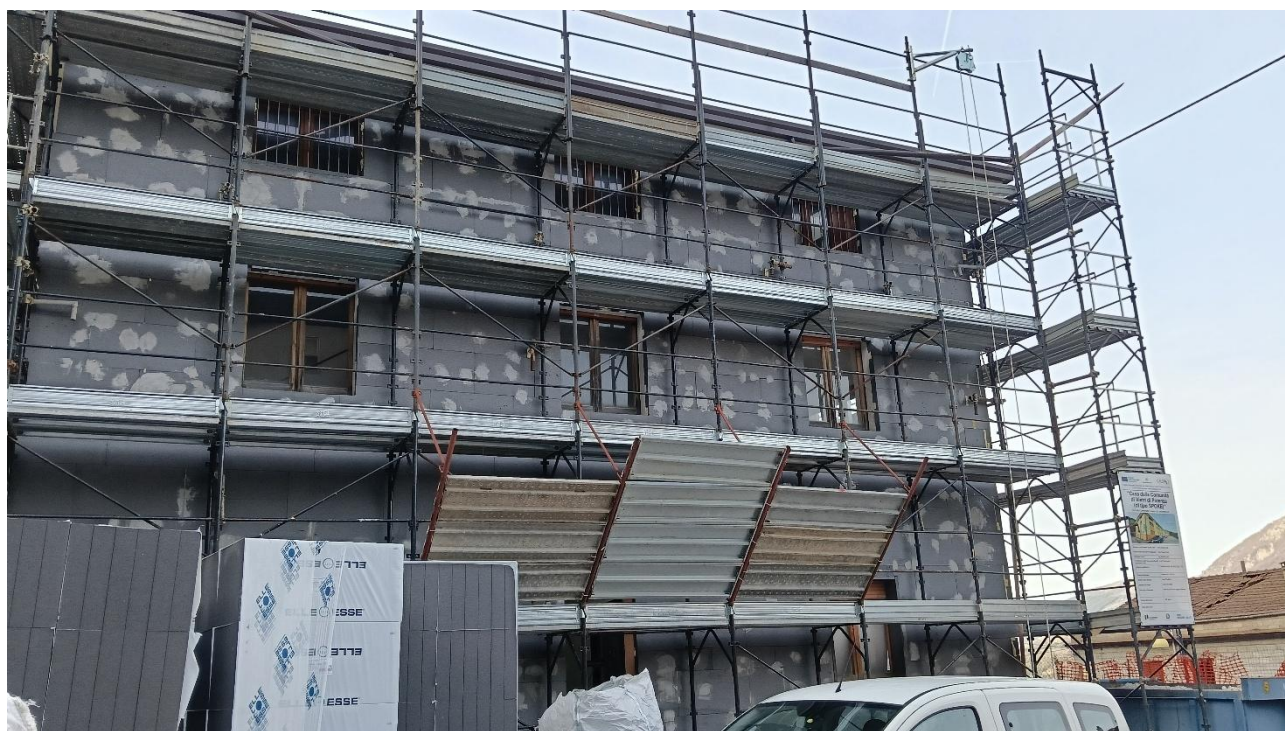
Figura 34 Rilievo fotografico del 12/01/2026