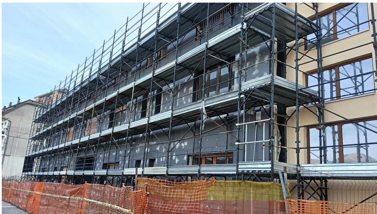
Figura 32 Rilievo fotografico del 12/01/2026