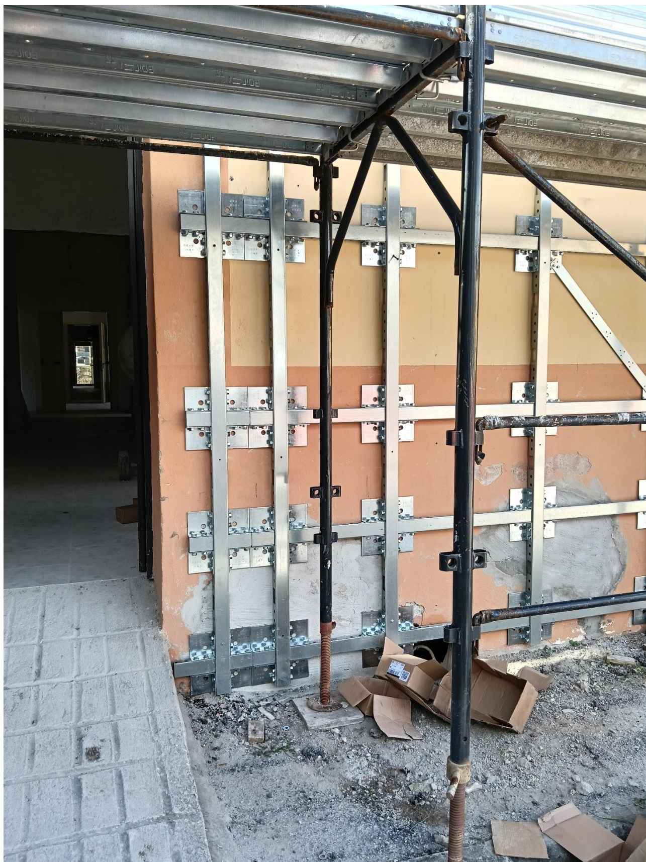
Figura 14 Rilievo fotografico del 20/10/2025