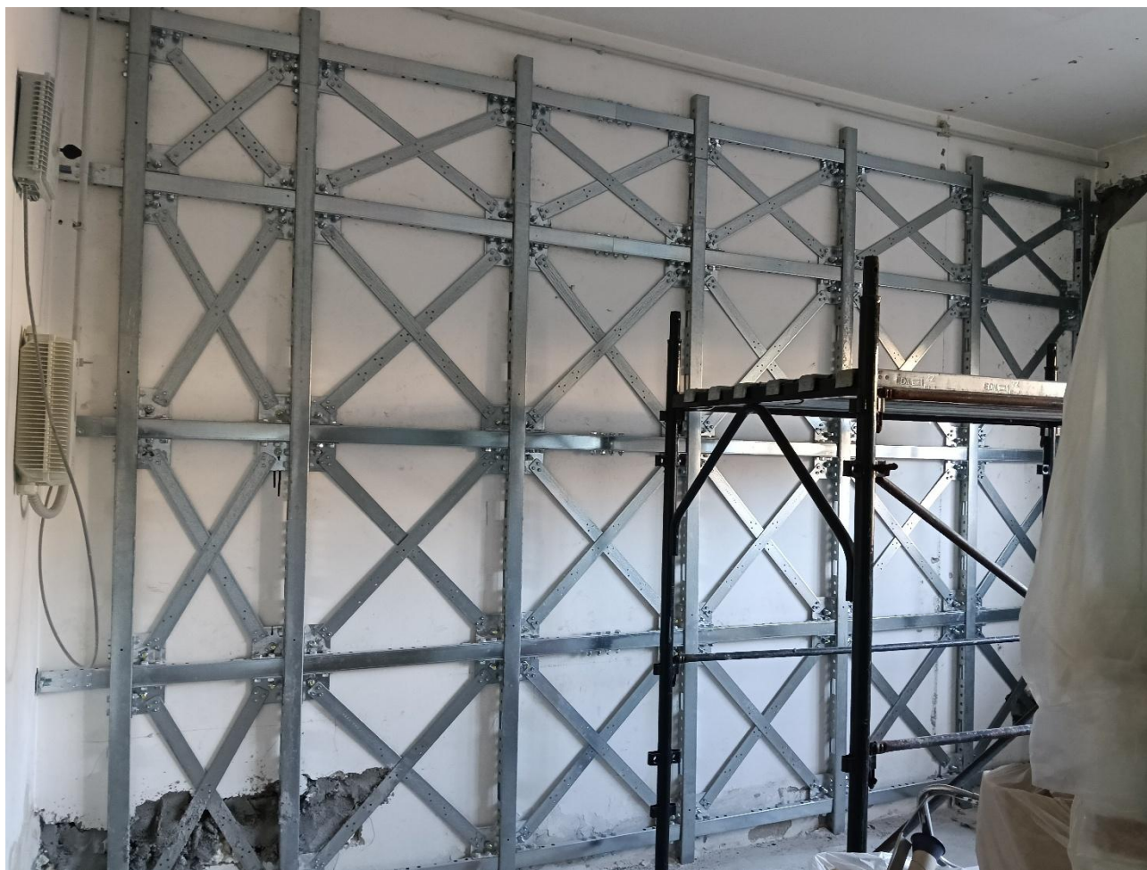
Figura 17 Rilievo fotografico del 20/10/2025