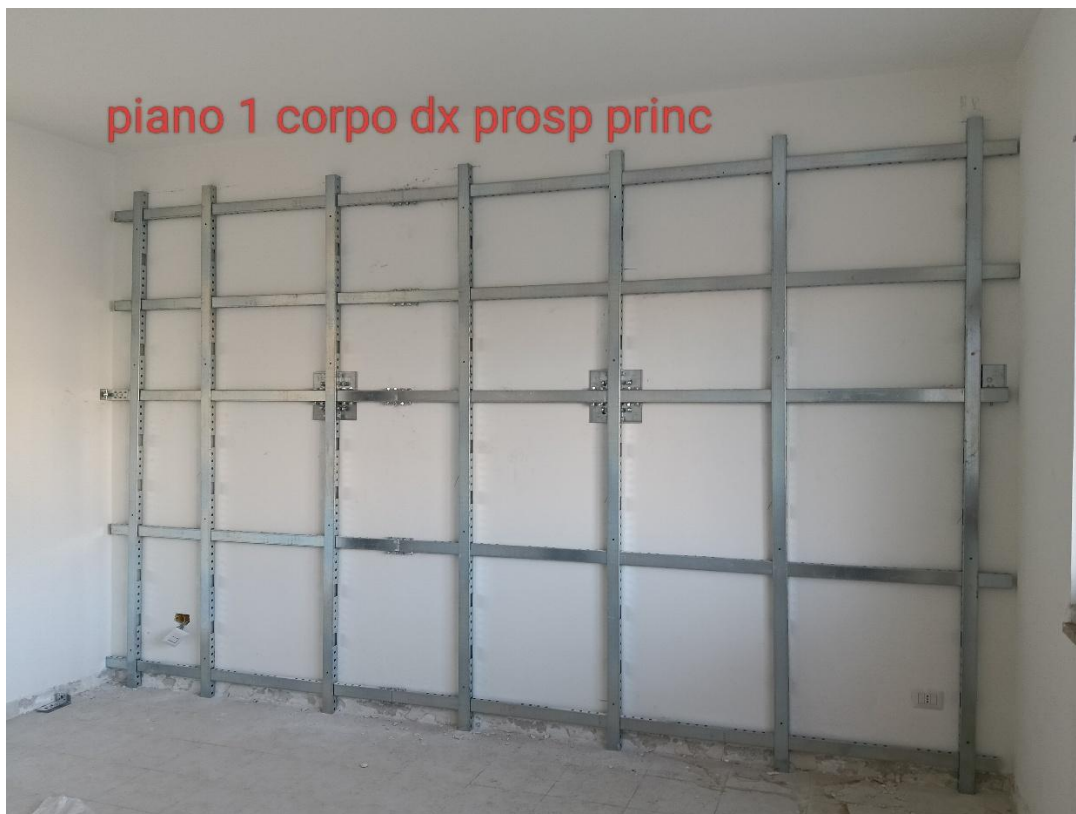
Figura 8 Rilievo fotografico del 20/10/2025