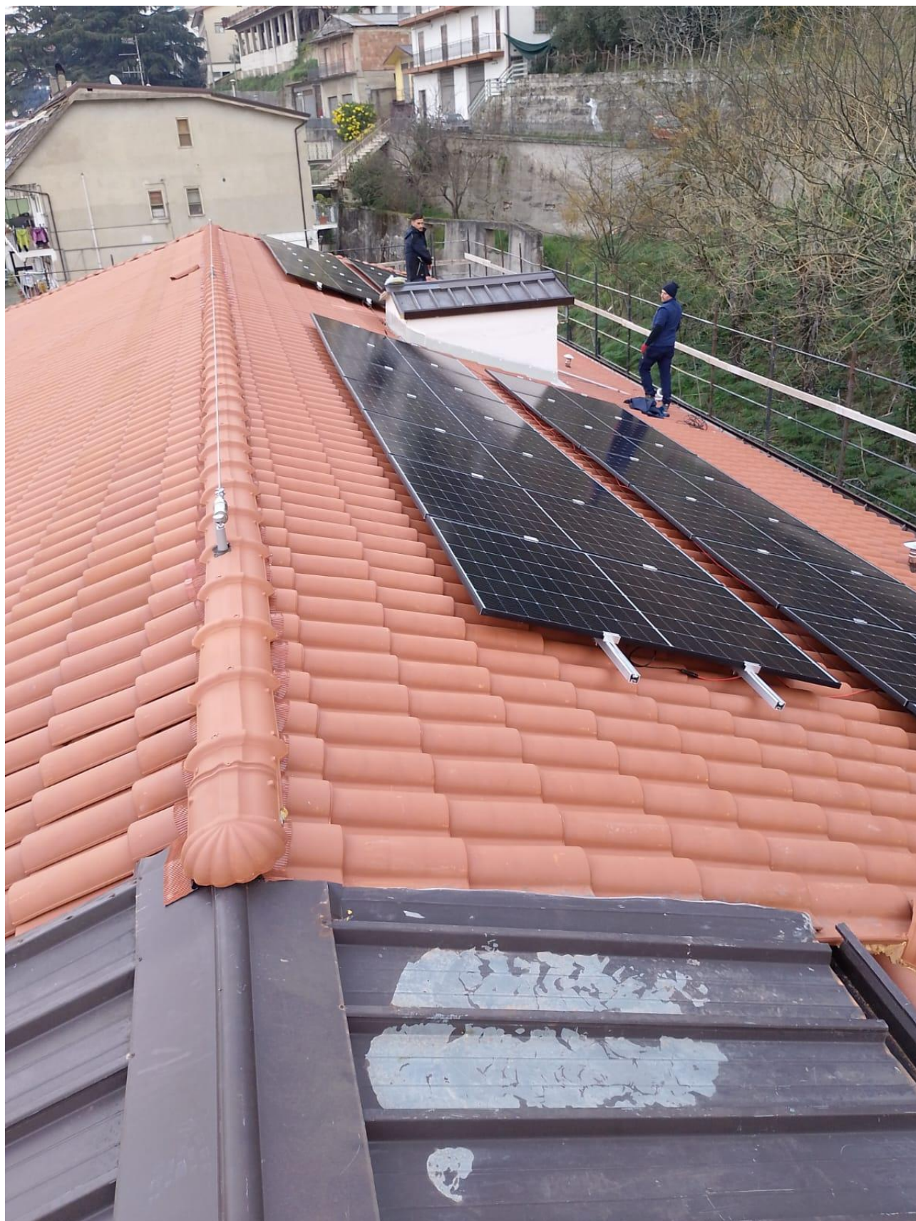
Figura 4 Efficientamento energetico, rilievo fotografico del 27/02/2025