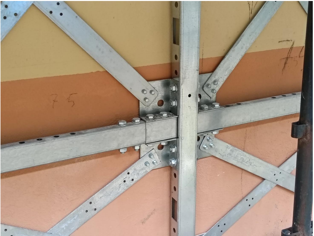
Figura 25 Rilievo fotografico del 20/10/2025