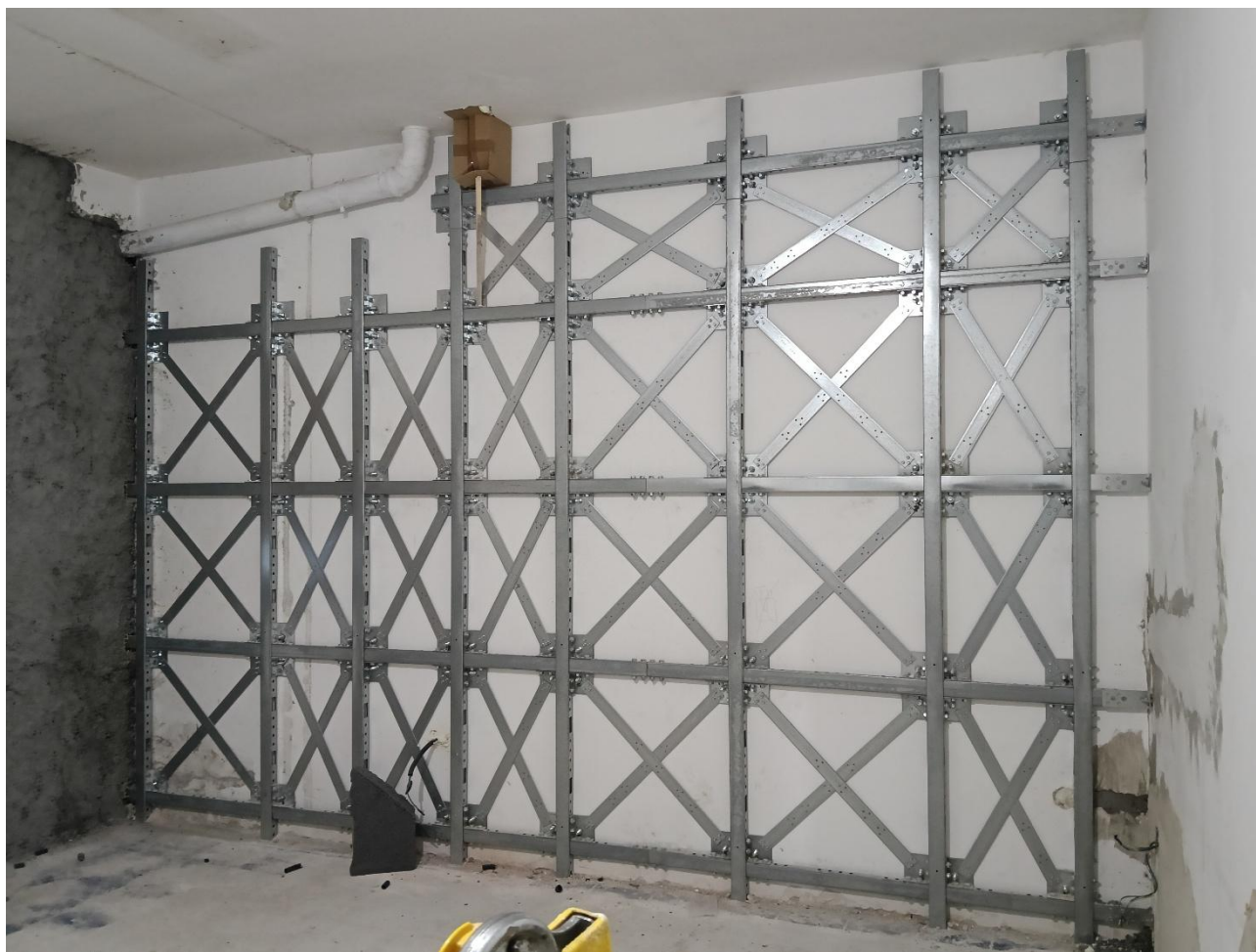
Figura 18 Rilievo fotografico del 20/10/2025