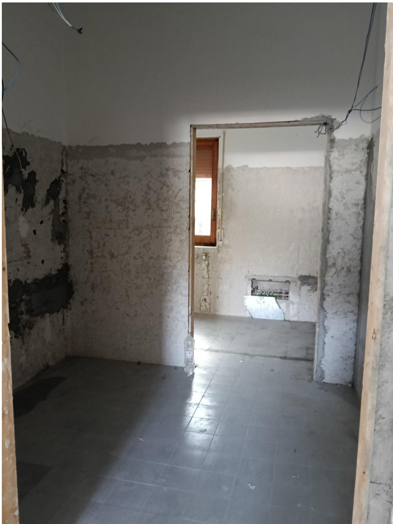
Figura 12 Rilievo fotografico del 20/10/2025