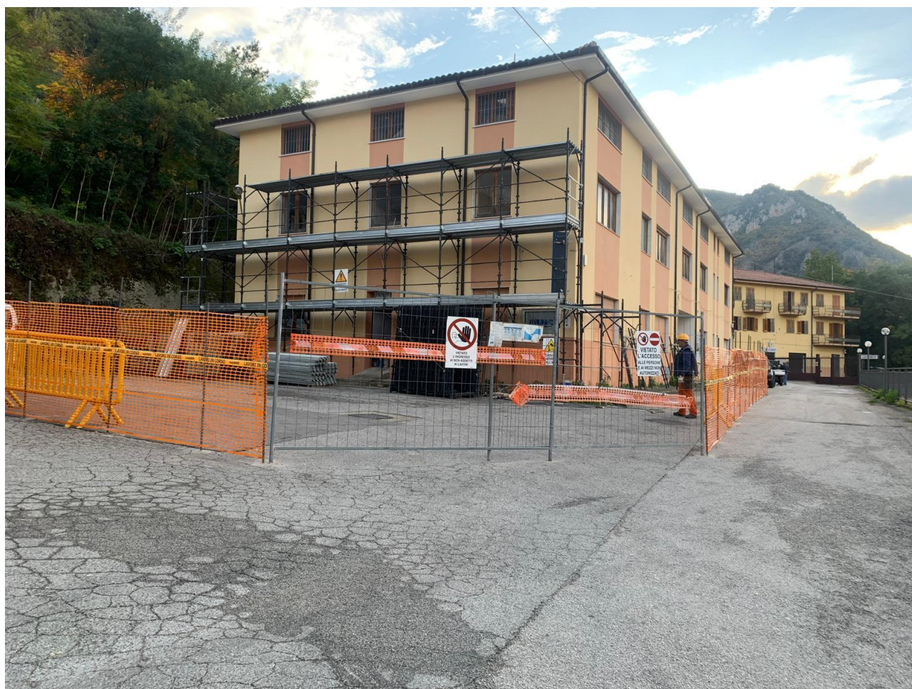
Figura 1 Ante operam