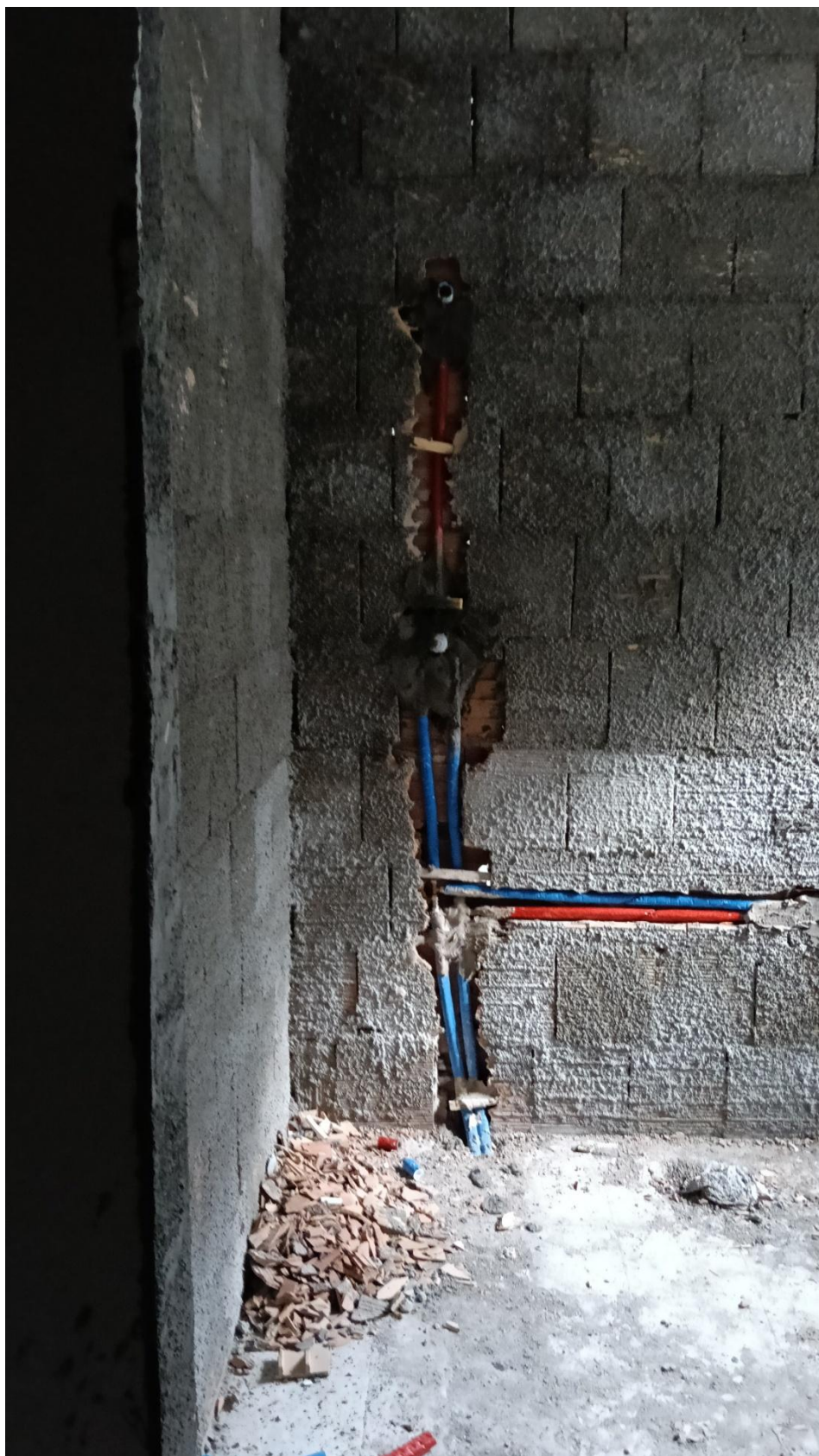
Figura 28 Rilievo fotografico del 20/10/2025