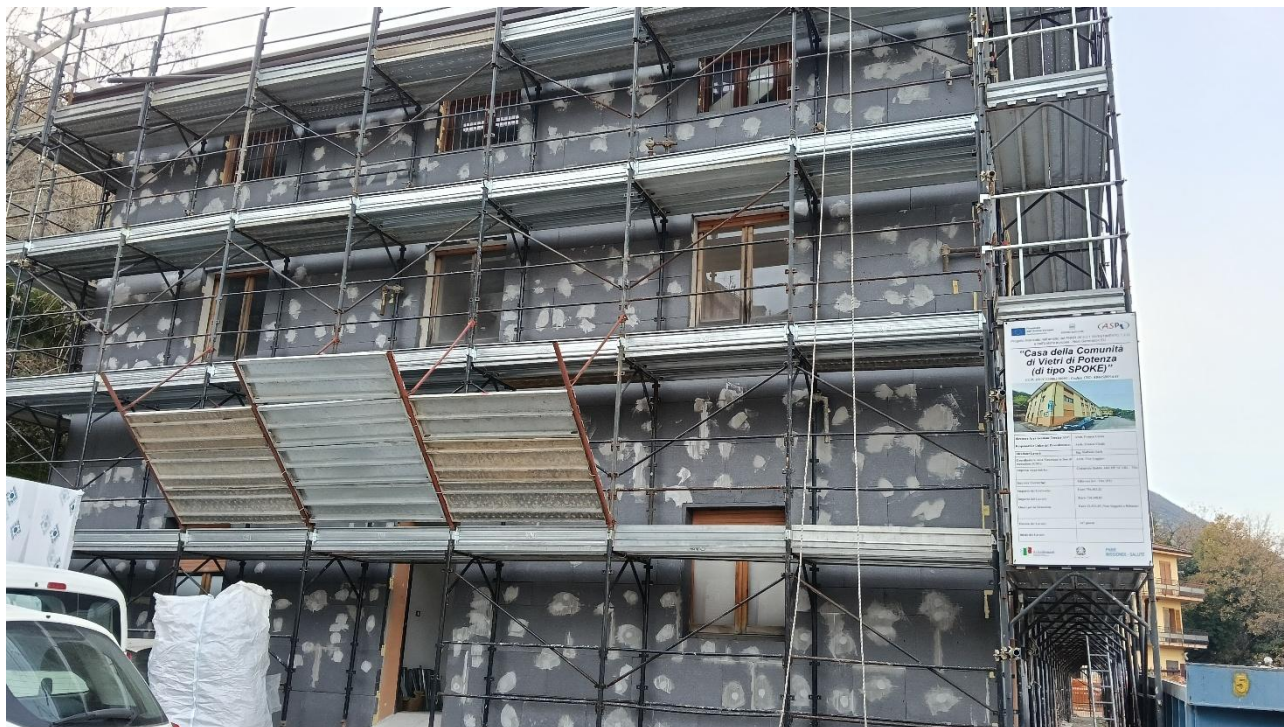
Figura 33 Rilievo fotografico del 12/01/2026