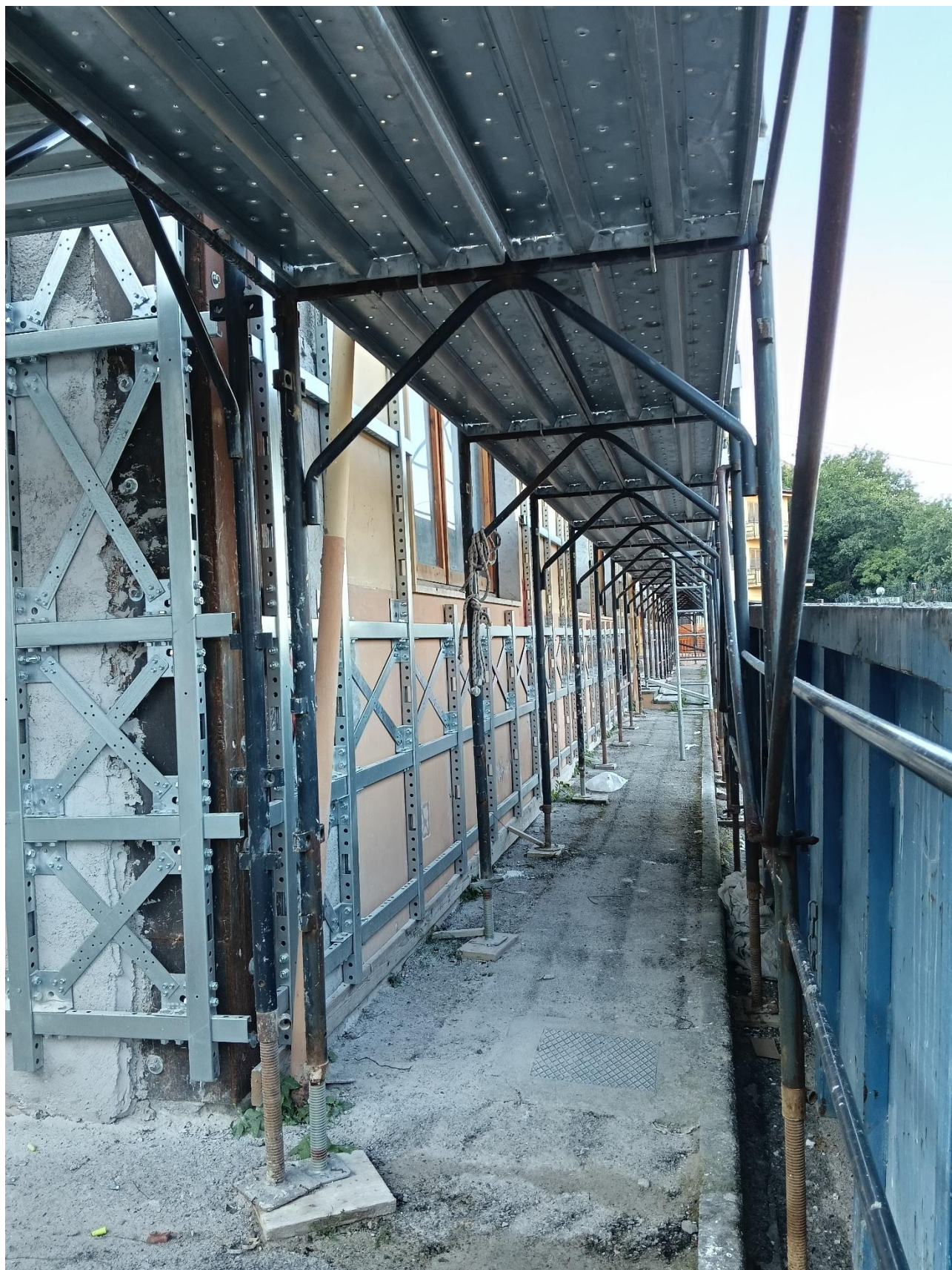
Figura 15 Rilievo fotografico del 20/10/2025