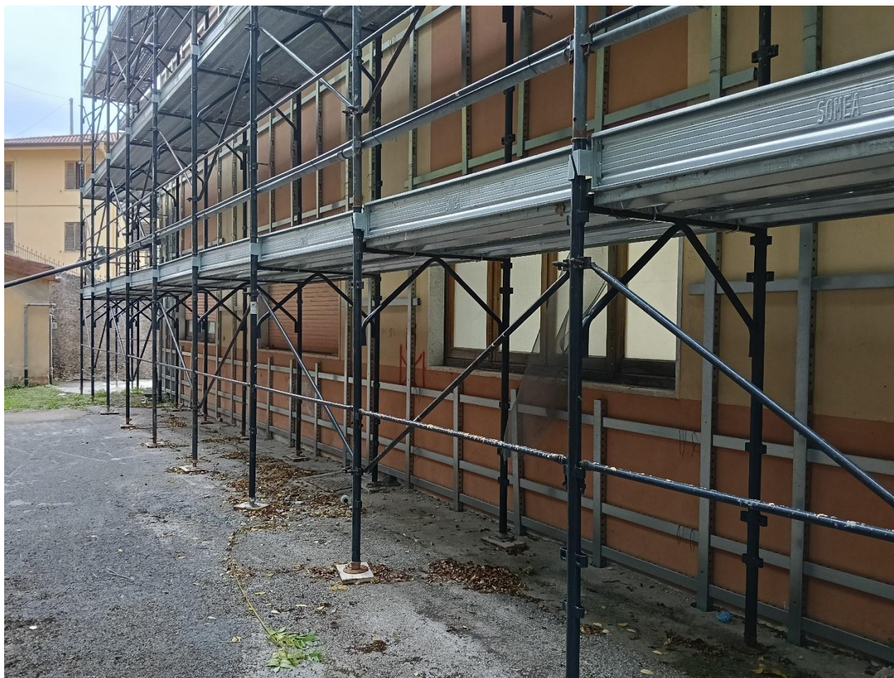
Figura 10 Rilievo fotografico del 20/10/2025