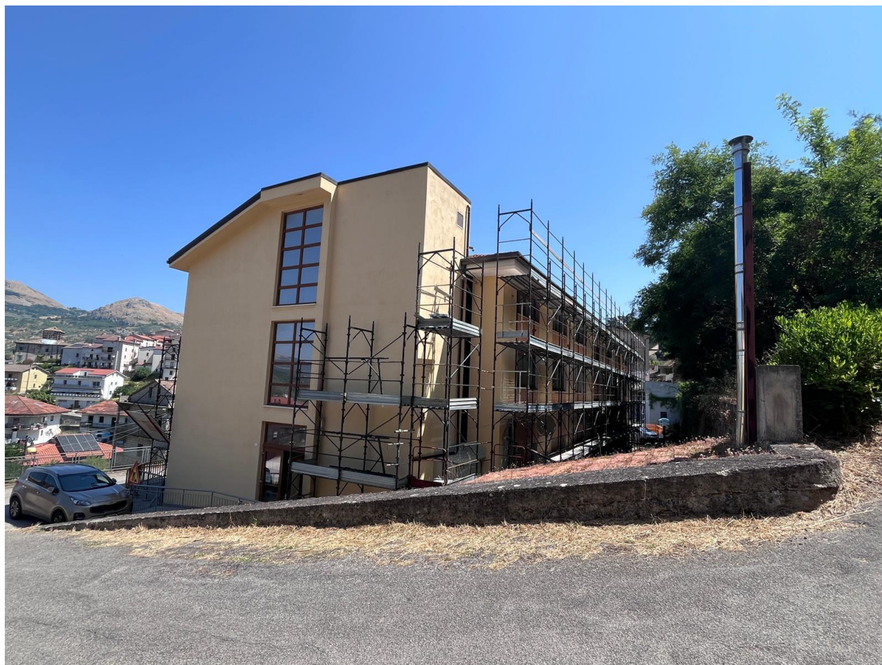
Figura 7 Ristrutturazione, rilievo fotografico del 25/06/2025