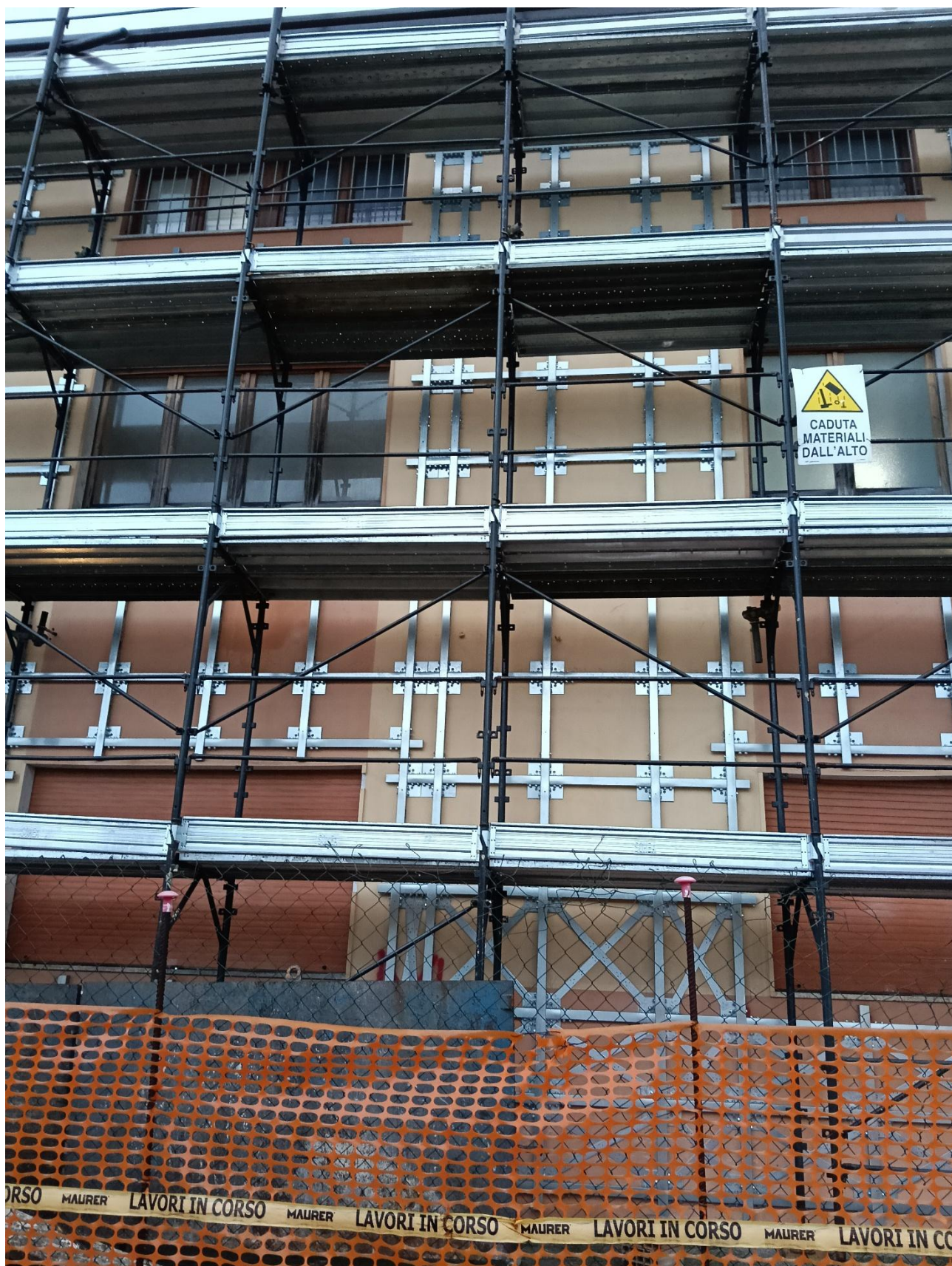
Figura 23 Rilievo fotografico del 20/10/2025