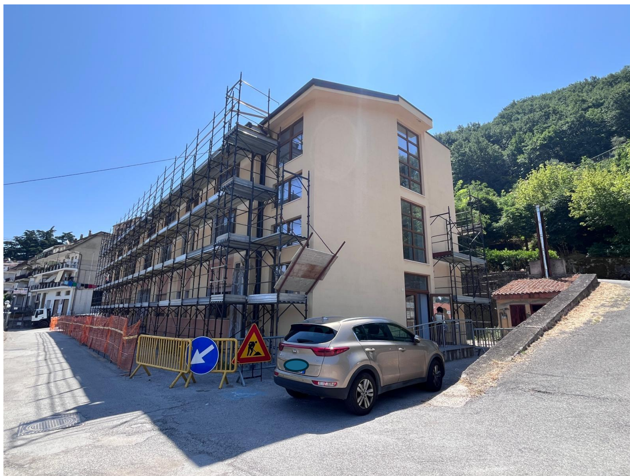
Figura 6 Ristrutturazione, rilievo fotografico del 25/06/2025