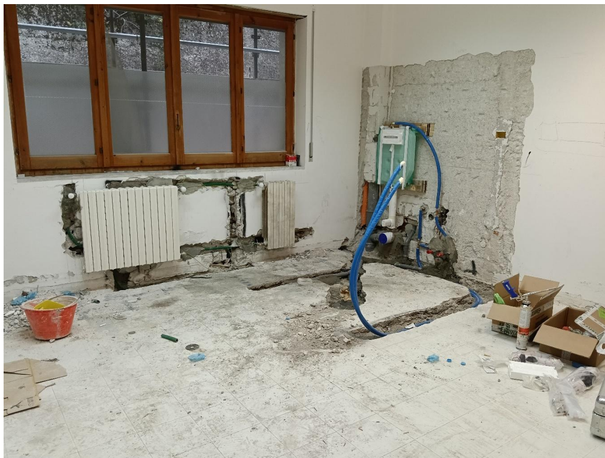
Figura 19 Rilievo fotografico del 20/10/2025