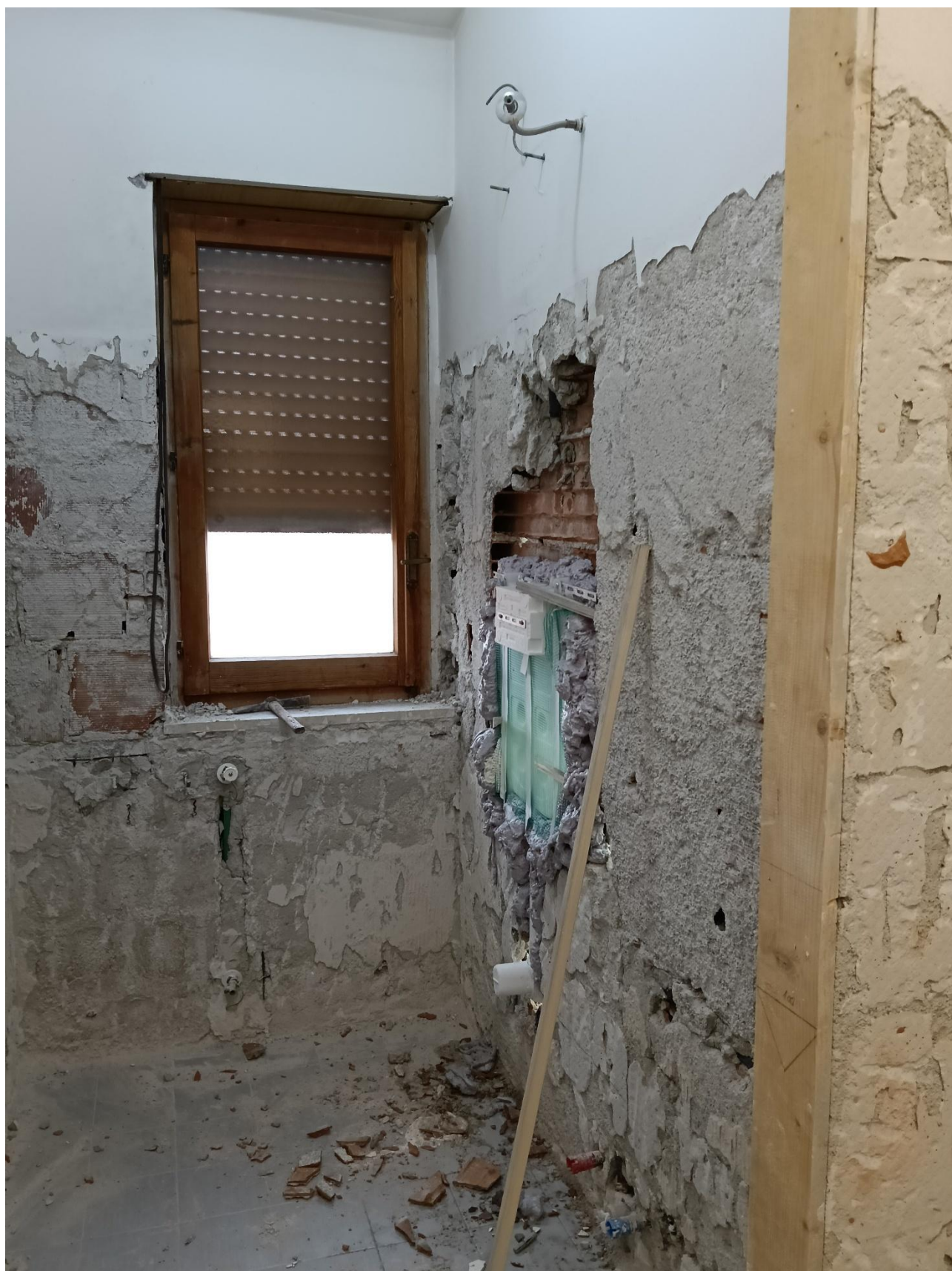
Figura 20 Rilievo fotografico del 20/10/2025