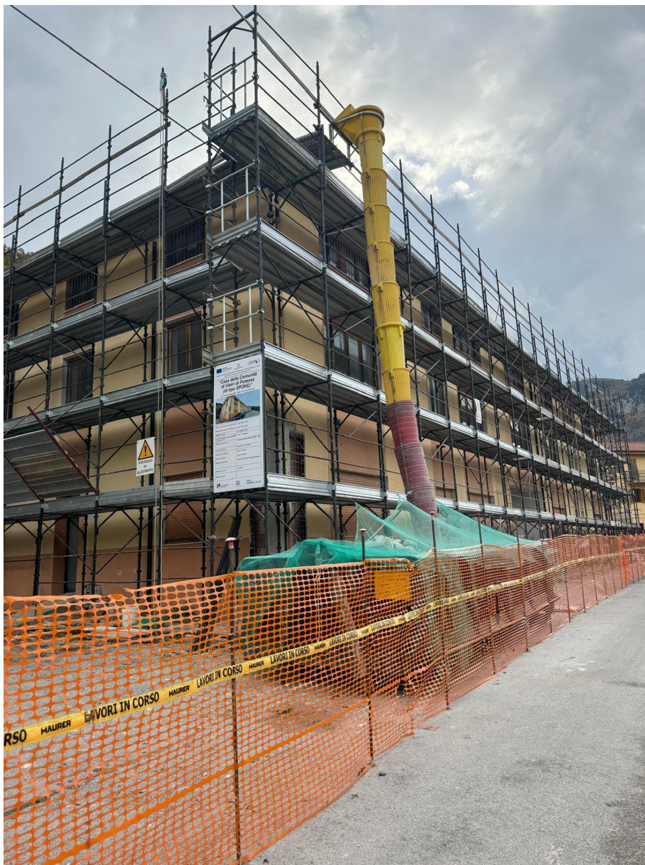
Figura 2 Opera con ponteggio, rilievo fotografico del 18/11/2024