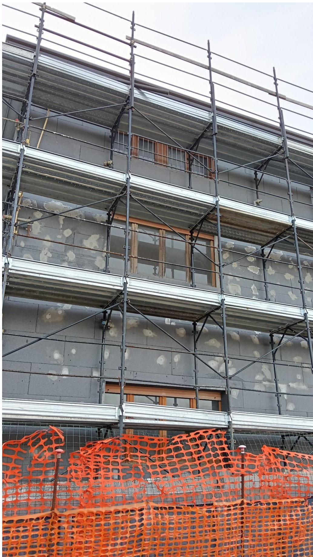
Figura 31 Rilievo fotografico del 12/01/2026