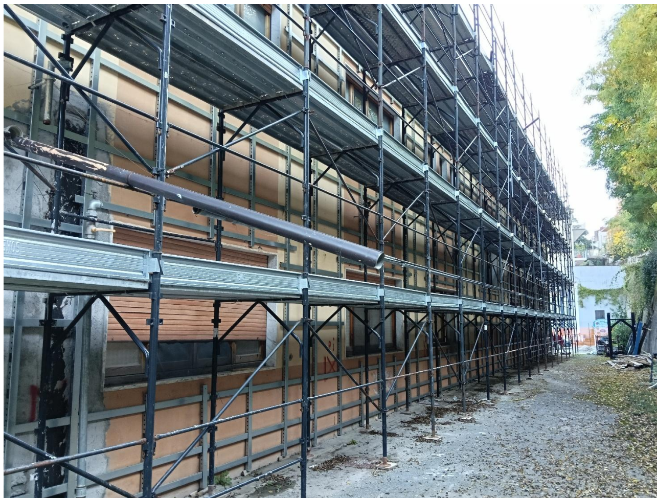
Figura 16 Rilievo fotografico del 20/10/2025