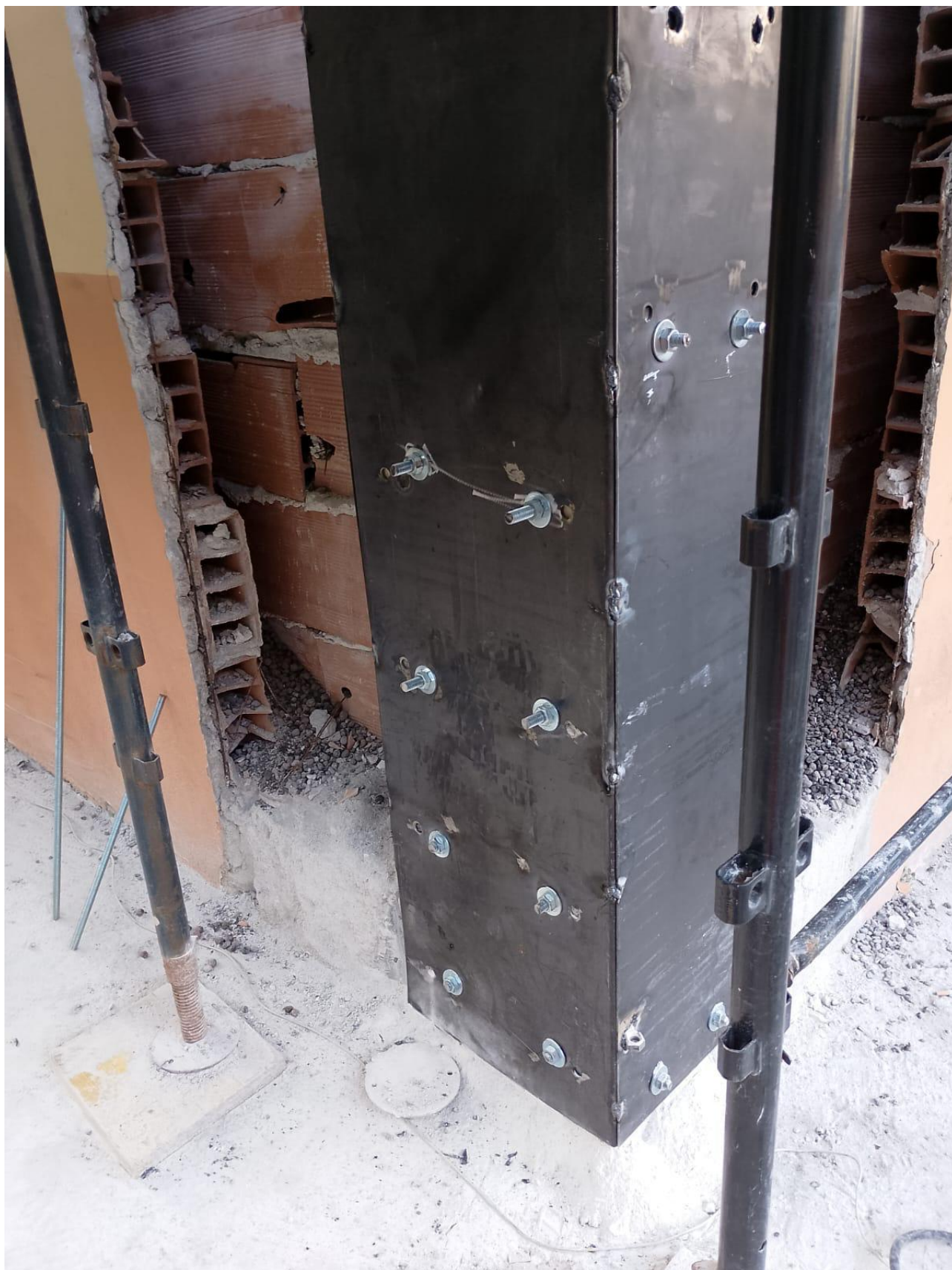
Figura 5 Interventi strutturali, rilievo fotografico del 27/02/2025