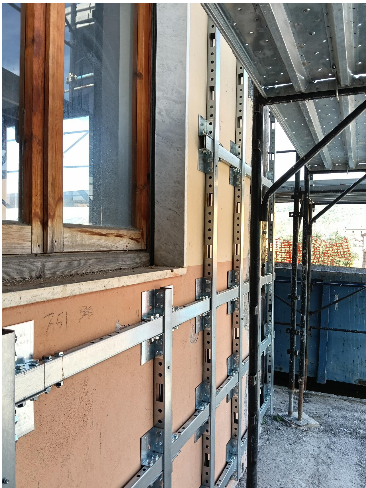
Figura 13 Rilievo fotografico del 20/10/2025