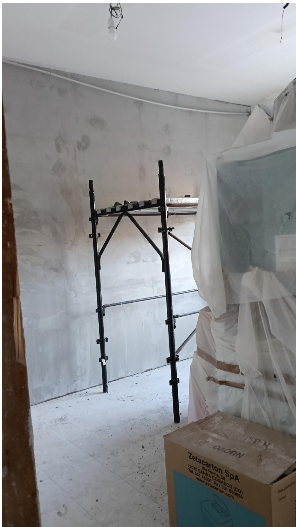
Figura 29 Rilievo fotografico del 20/10/2025