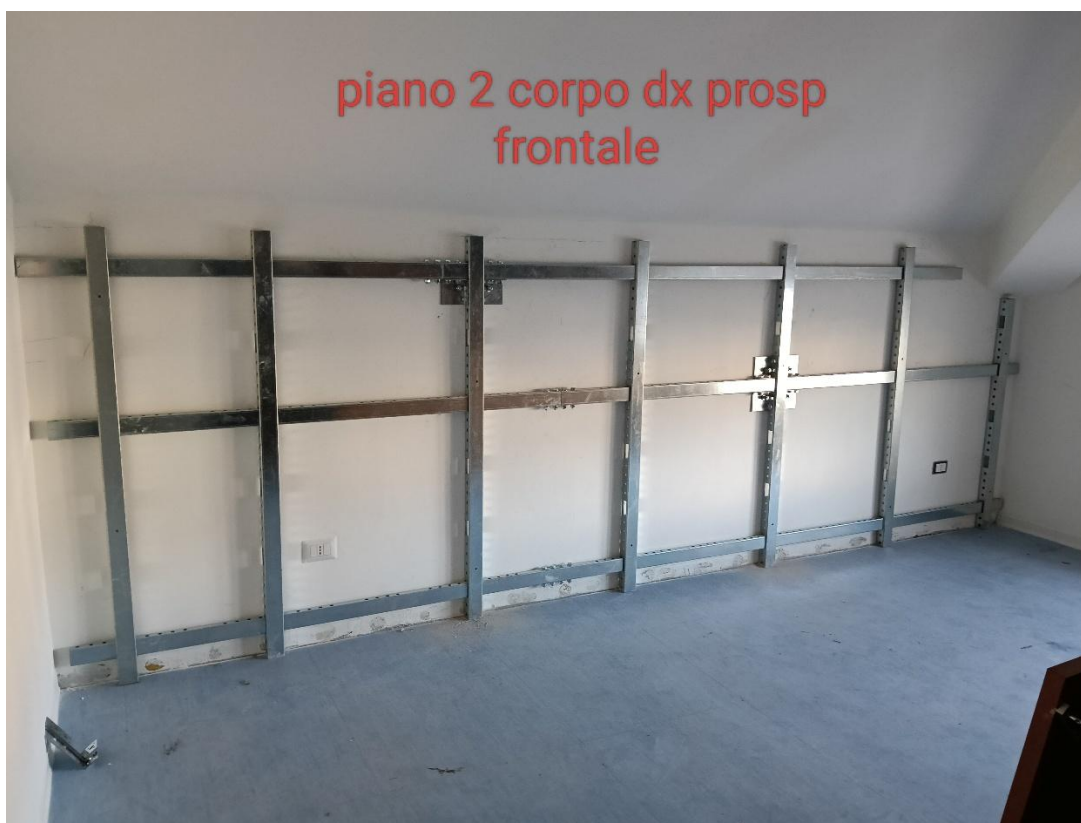
Figura 9 Rilievo fotografico del 20/10/2025