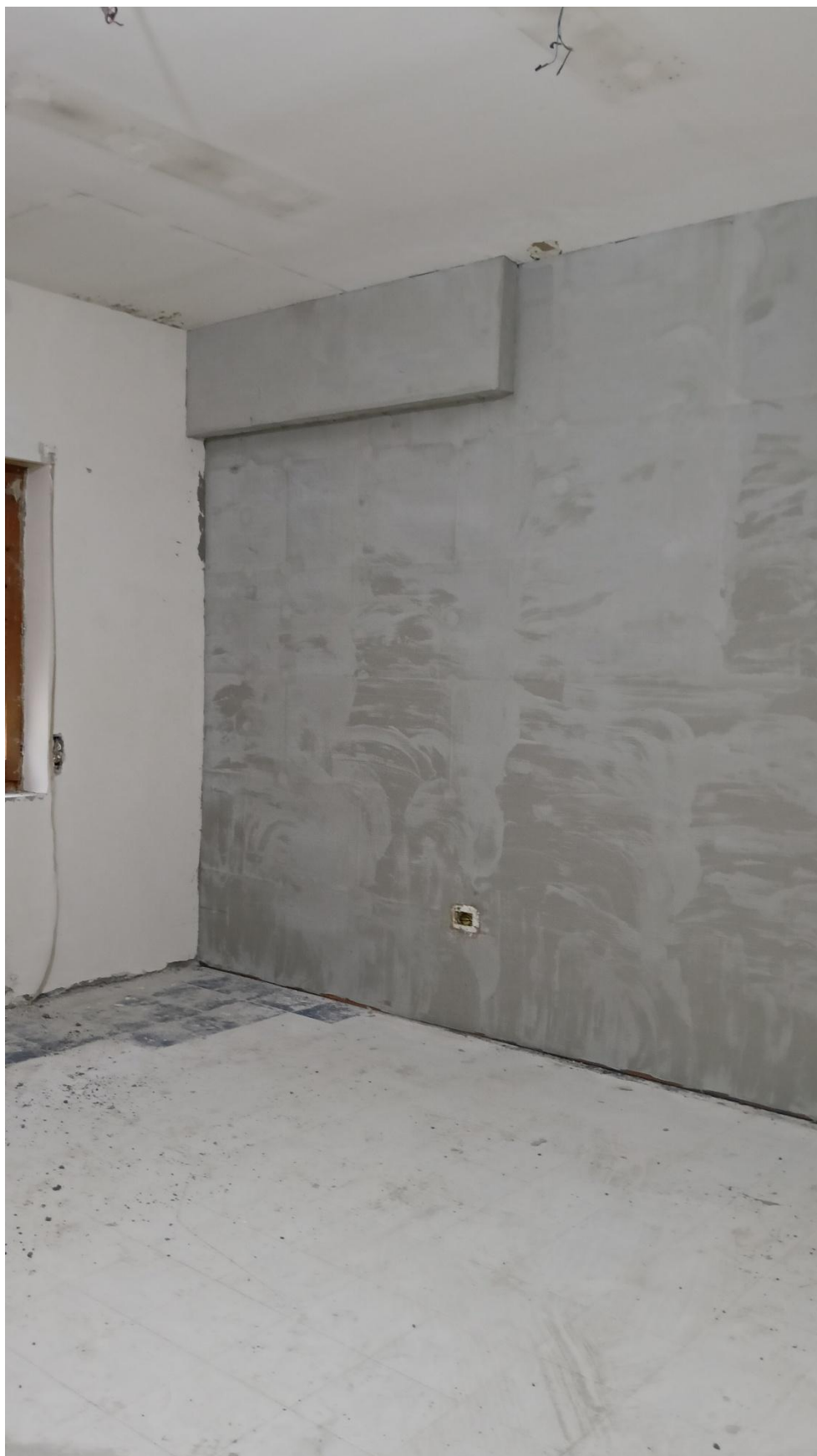
Figura 26 Rilievo fotografico del 20/10/2025