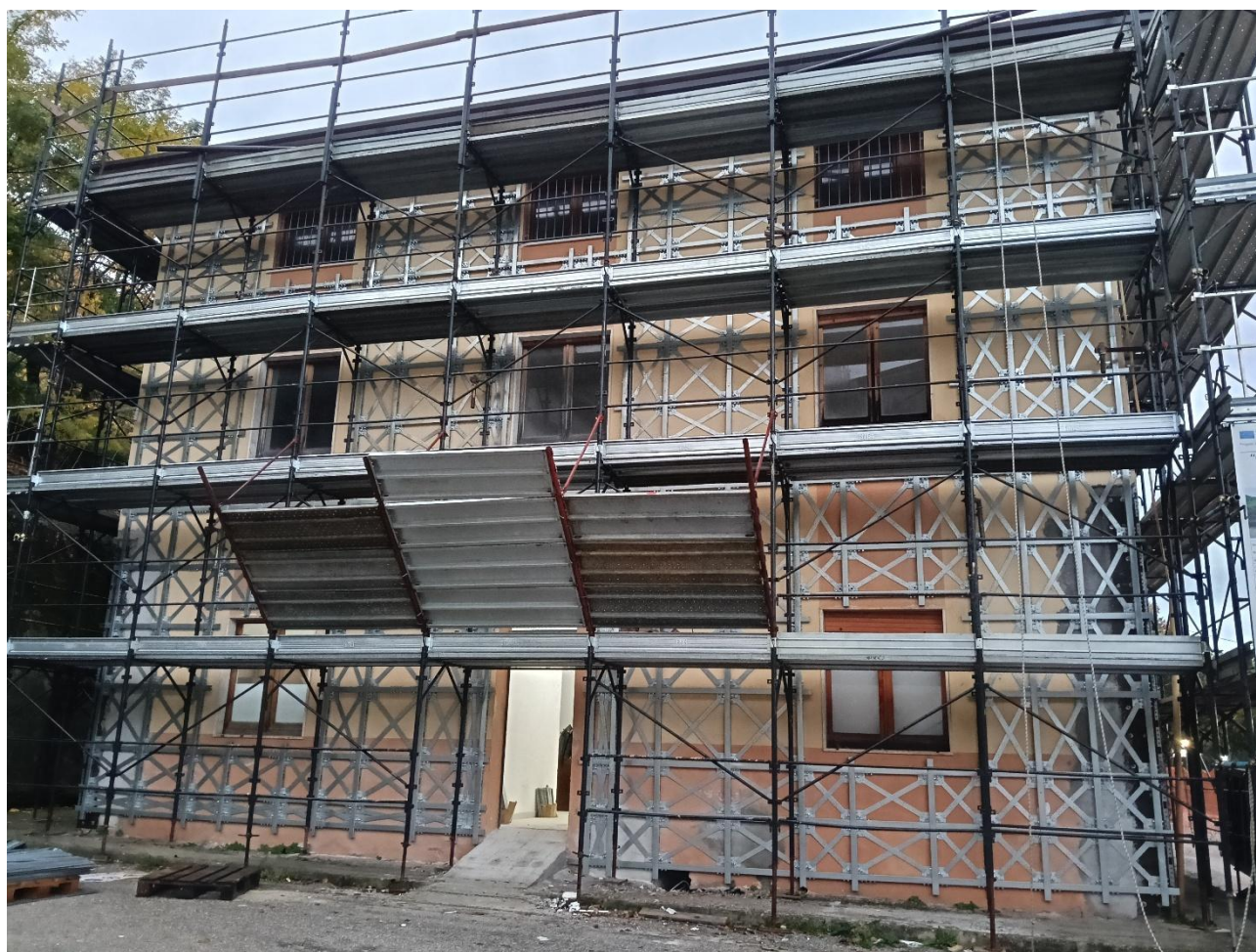
Figura 24 Rilievo fotografico del 20/10/2025