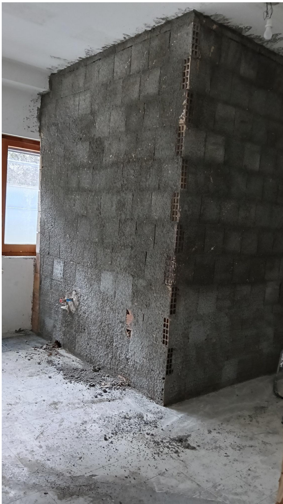
Figura 27 Rilievo fotografico del 20/10/2025