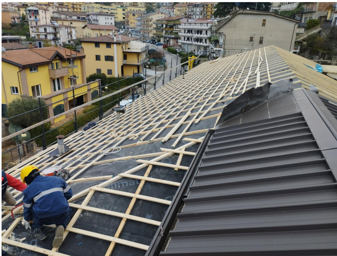
Figura 3 Rifacimento completo del tetto, rilievo fotografico del 13/12/2024