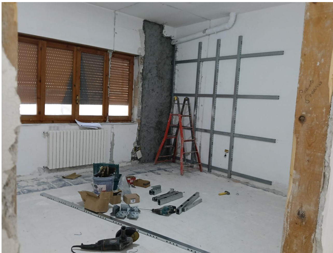
Figura 11 Rilievo fotografico del 20/10/2025