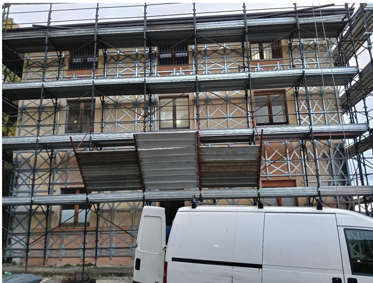
Figura 22 Rilievo fotografico del 20/10/2025