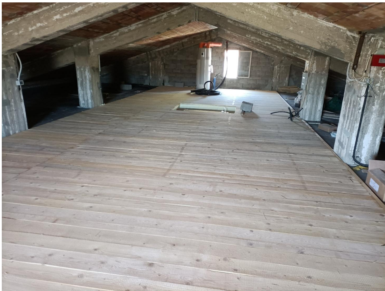
Figura 20 Installazione pompa di calore, rilievo fotografico del 18/09/2025