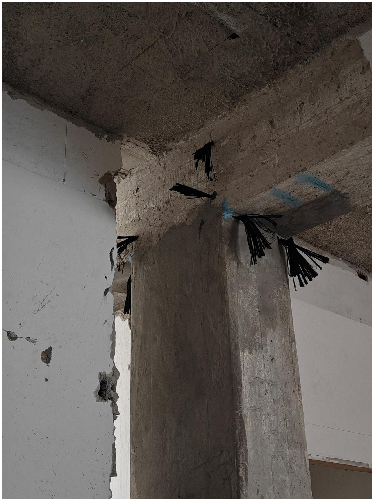
Figura 10 Rinforzo strutturale con fibra di carbonio, rilievo fotografico del 26/03/2025