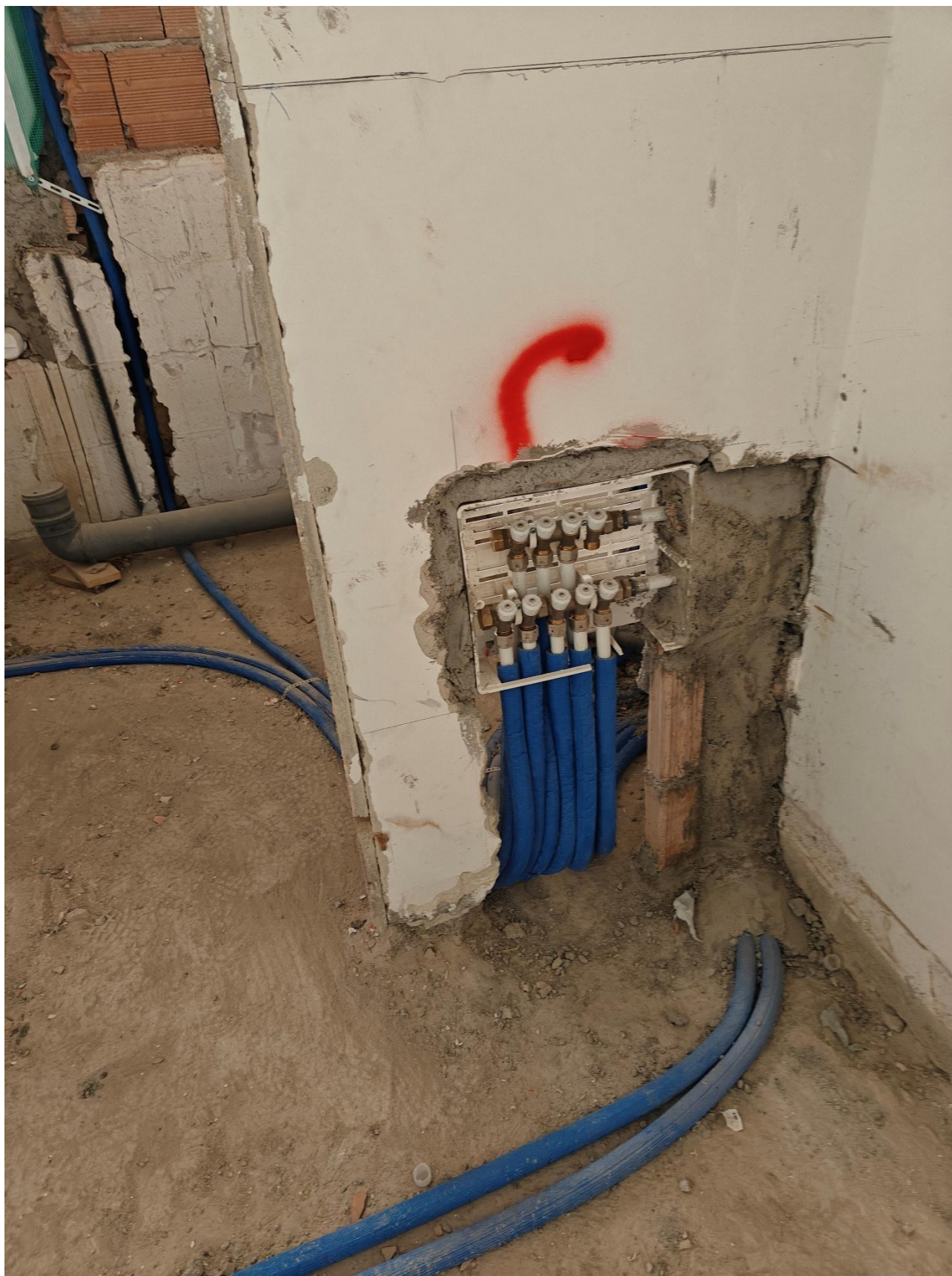
Figura 6 Realizzazione nuovo impianto idraulico, rilievo fotografico del 15/05/2025