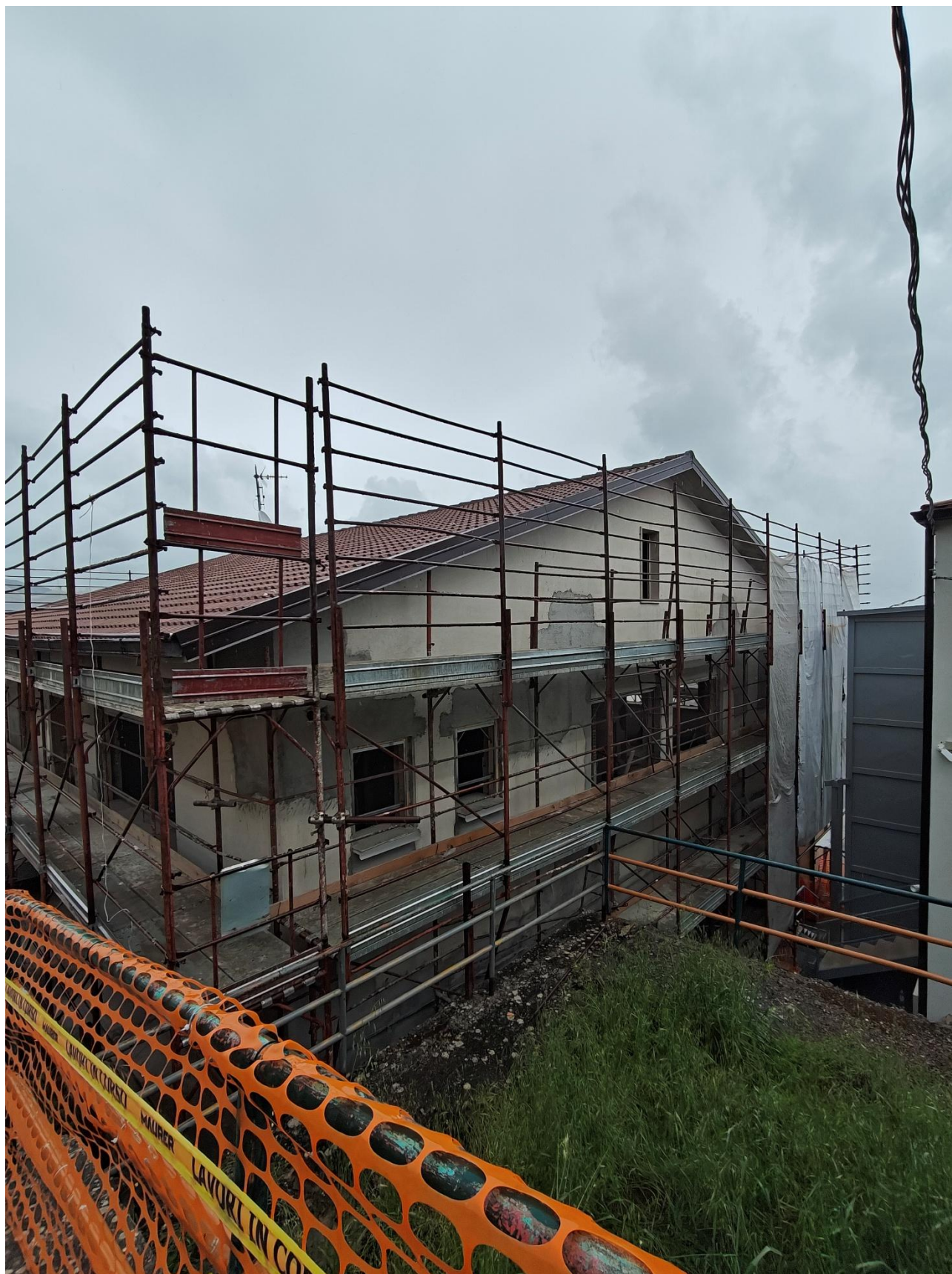
Figura 5 Installazione impalcato, rilievo fotografico del 15/05/2025