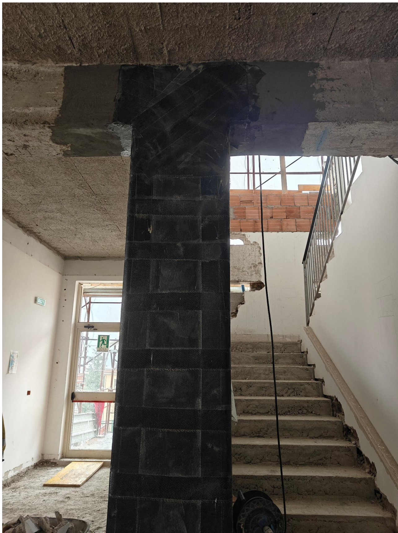
Figura 12 Rinforzo strutturale in fibra di carbonio, rilievo fotografico del 26/03/2025