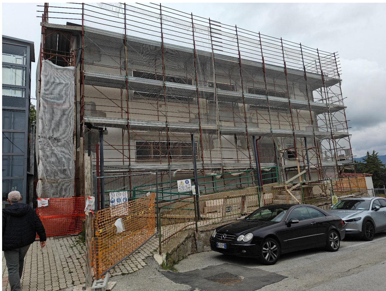
Figura 3 Installazione impalcato e delimitazione area di cantiere, rilievo fotografico del 15/05/2025