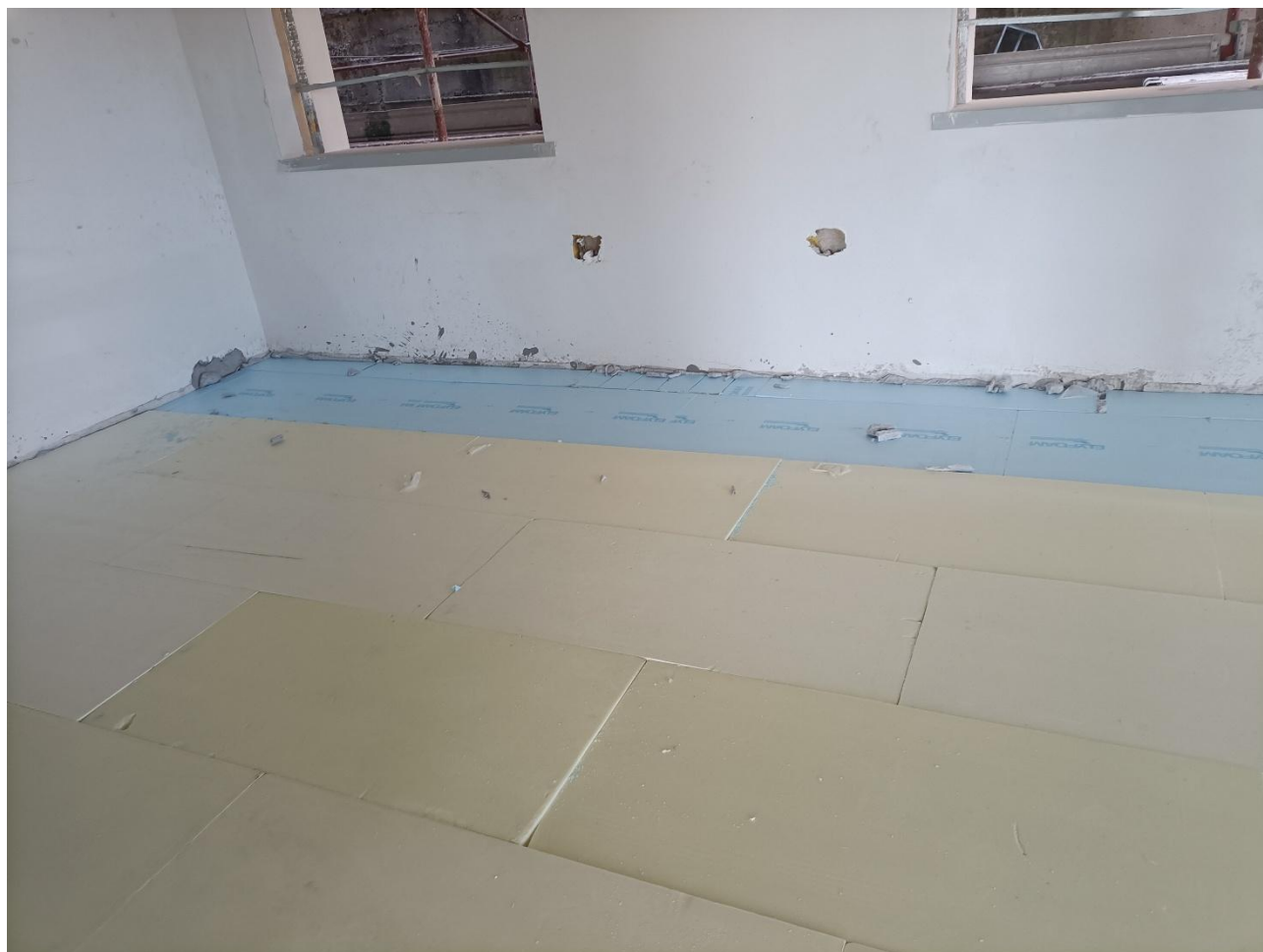
Figura 19 Rilievo fotografico del 18/09/2025