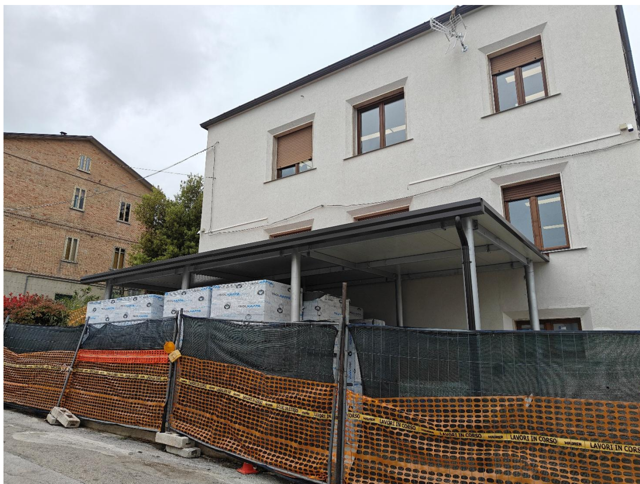
Figura 1 Ante operam, rilievo fotografico del 15/05/2025