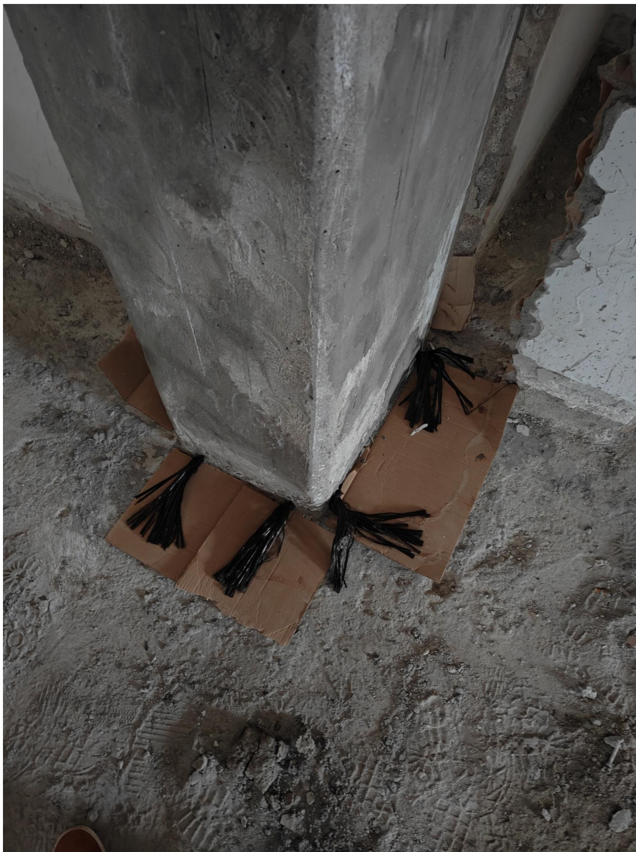
Figura 11 Rinforzo strutturale con fibra di carbonio, rilievo fotografico del 26/03/2025