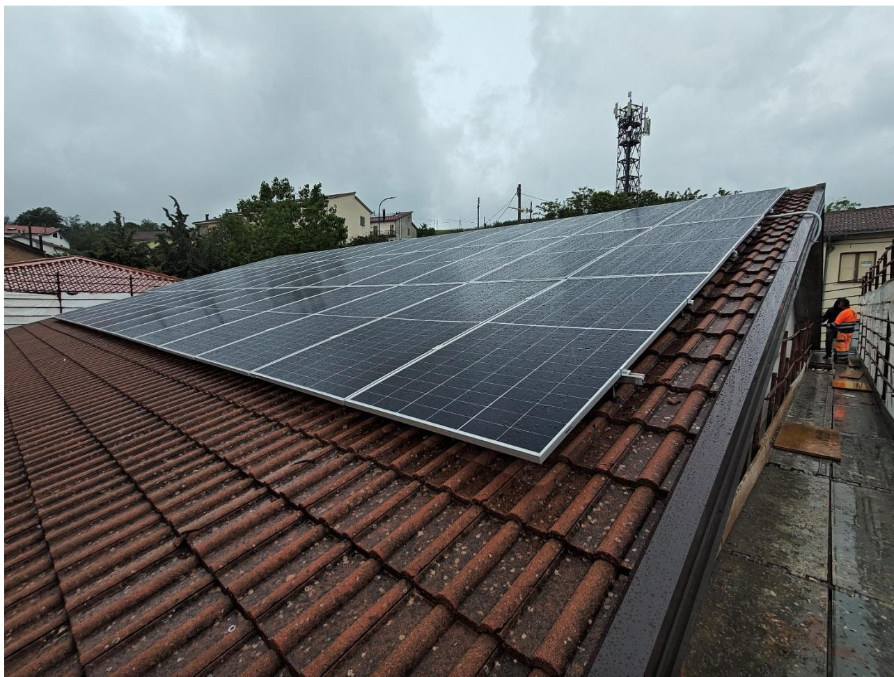
Figura 9 Installazione impianto fotovoltaico, rilievo fotografico del 15/05/2025