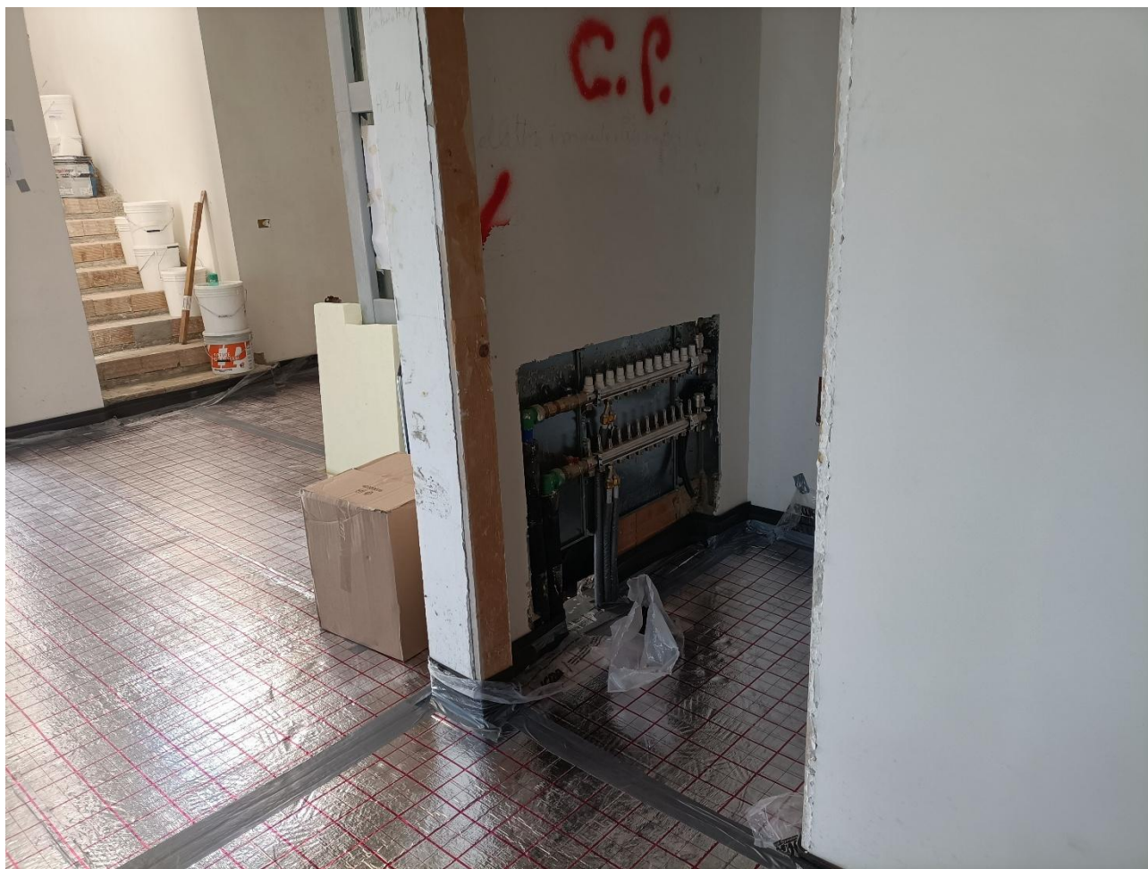
Figura 16 Installazione impianto di riscaldamento a pavimento, rilievo fotografico del 02/09/2025