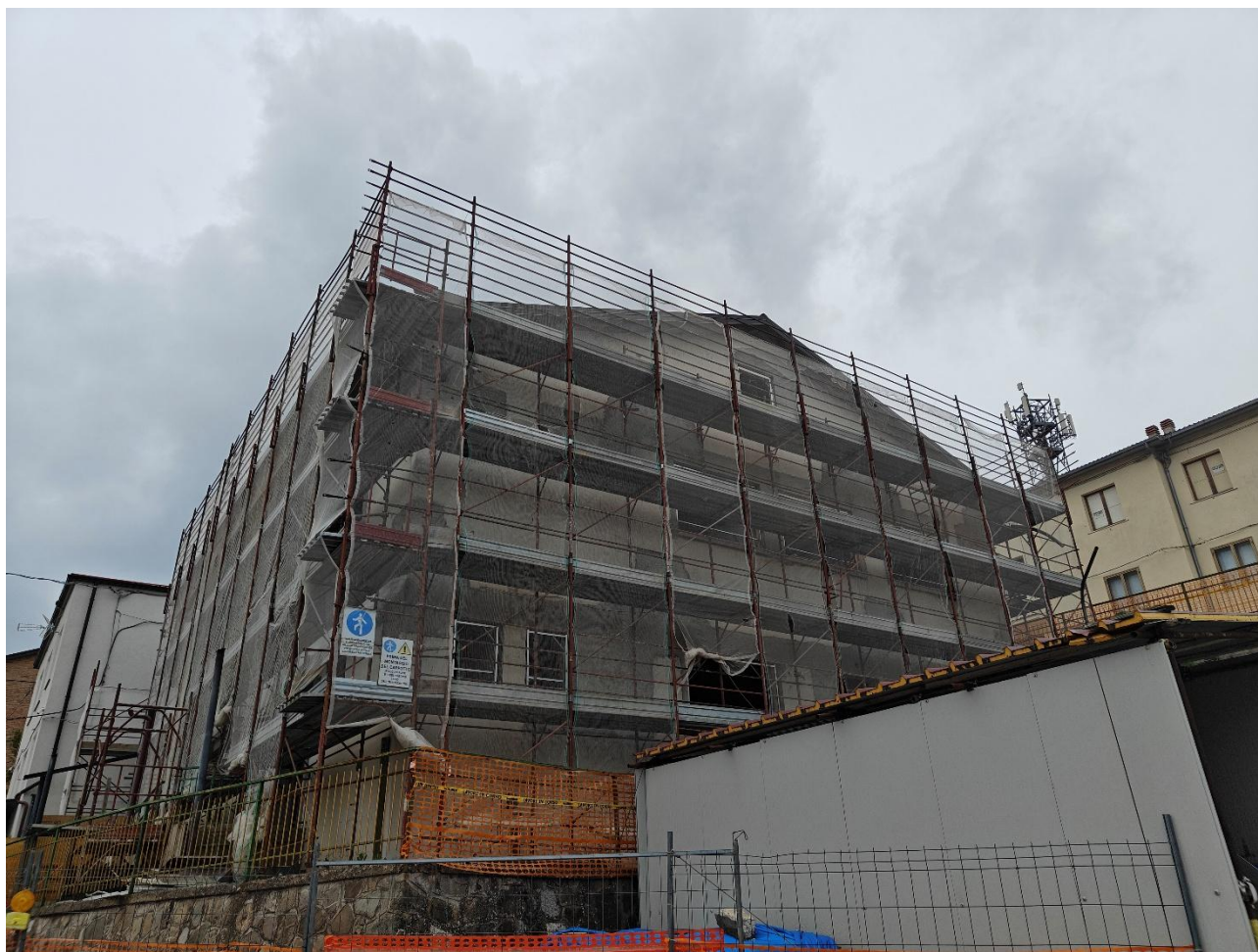
Figura 4 Installazione impalcato e delimitazione area di cantiere, rilievo fotografico del 15/05/2025