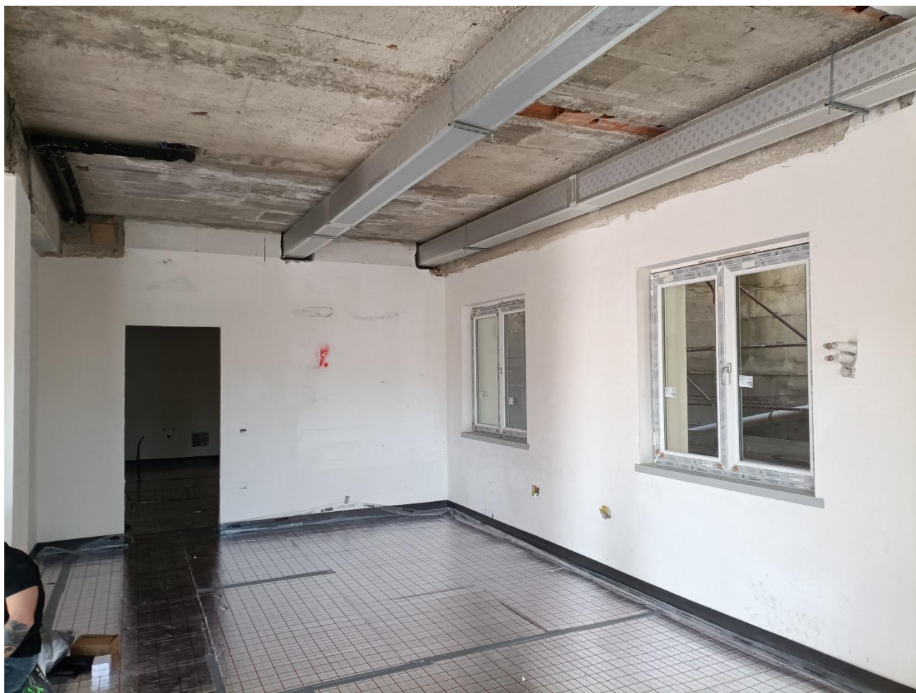
Figura 15 Installazione impianto di riscaldamento a pavimento, rilievo fotografico del 02/09/2025