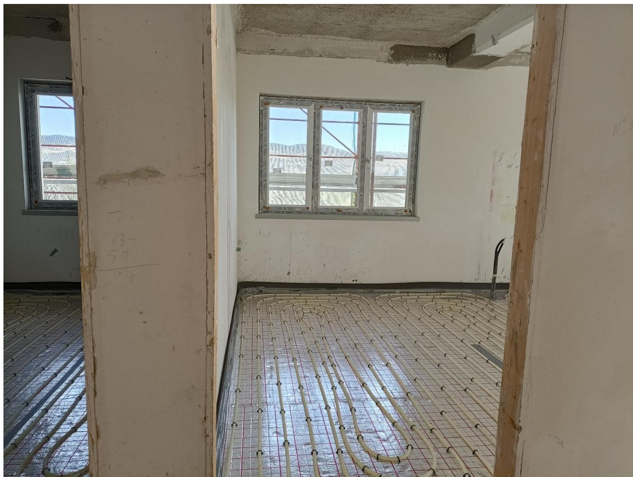
Figura 18 Installazione impianto di riscaldamento a pavimento, rilievo fotografico del 10/09/2025