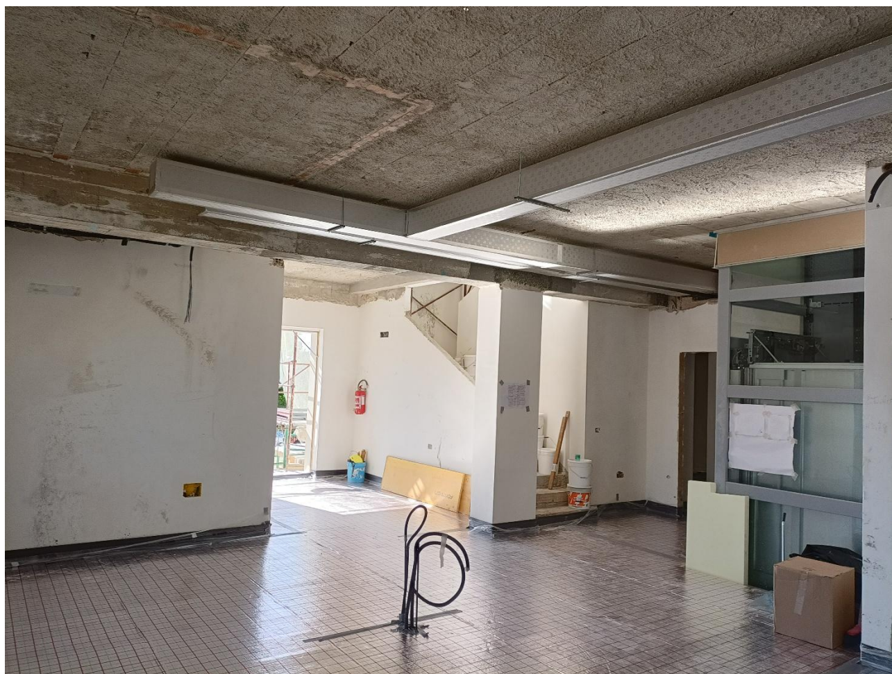
Figura 14 Installazione impianto di riscaldamento a pavimento, rilievo fotografico del 02/09/2025