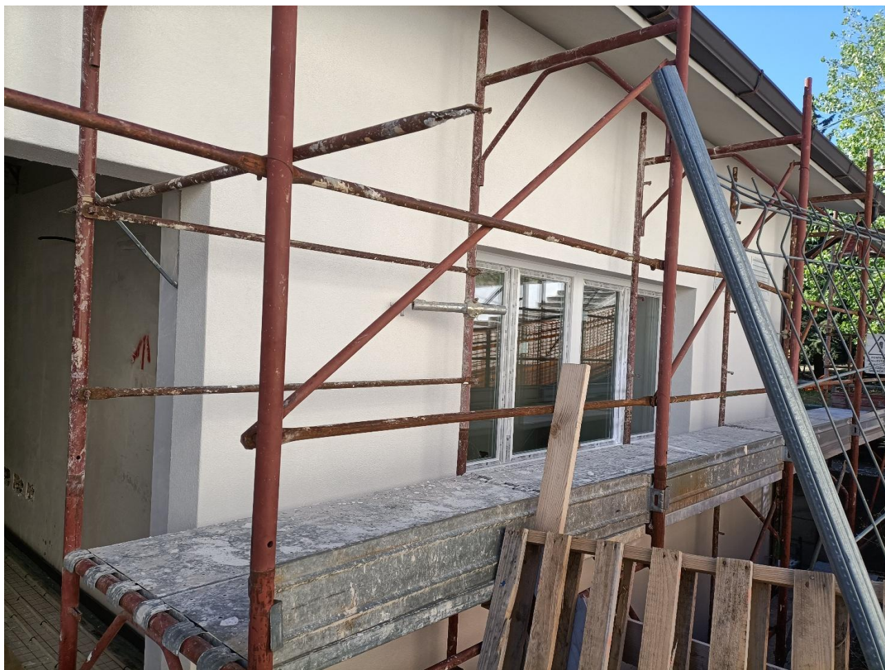
Figura 22 Rifiniture esterne, rilievo fotografico del 18/09/2025