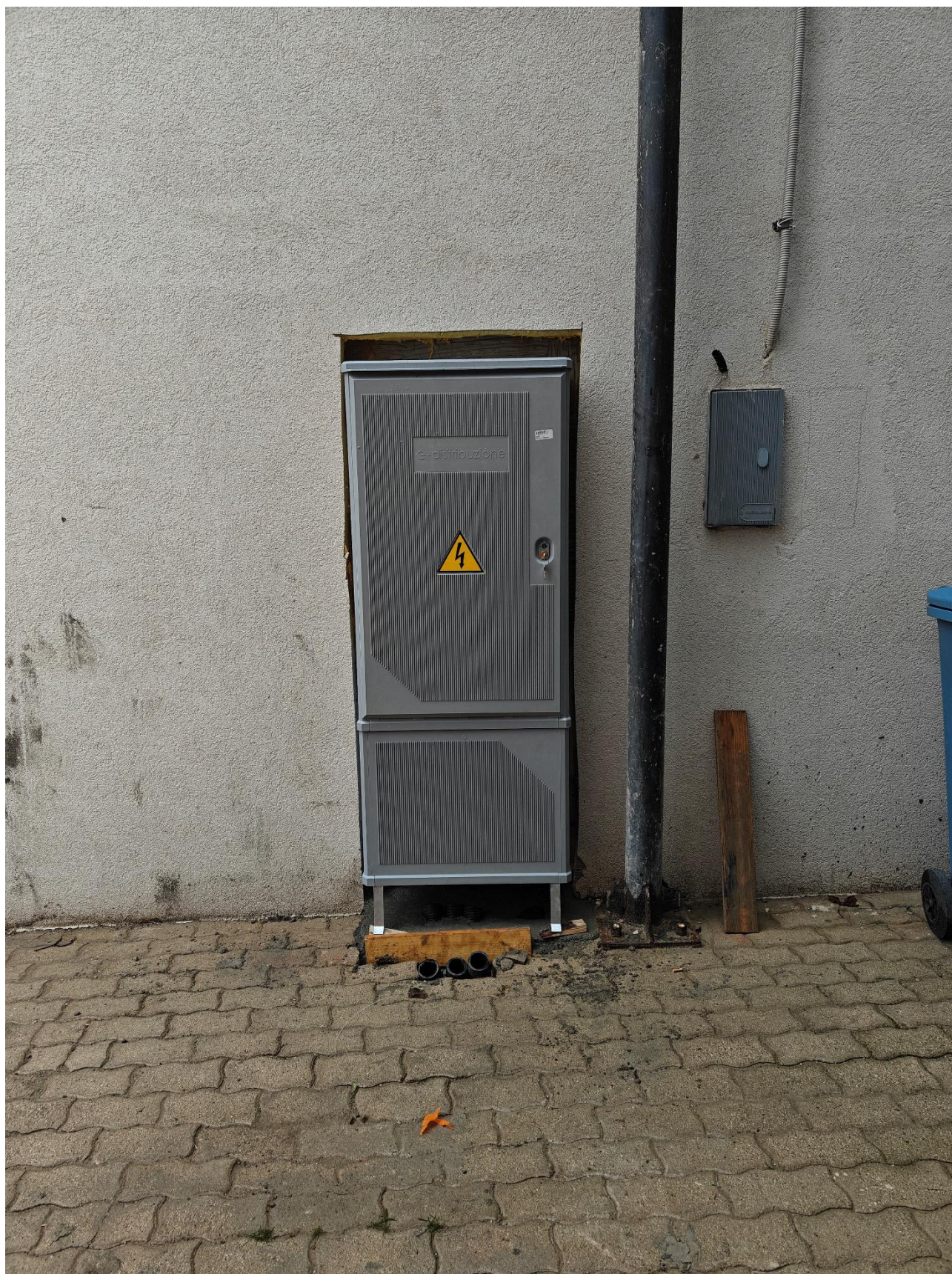
Figura 13 Nuova cabina elettrica, rilievo fotografico del 26/03/2025