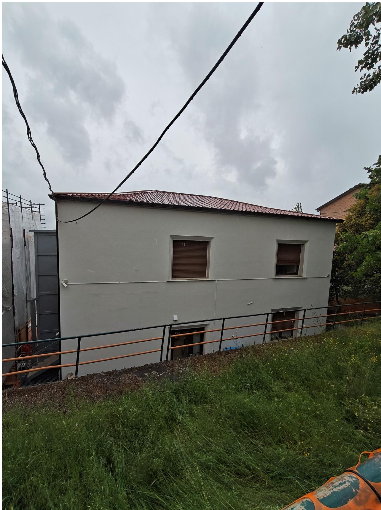
Figura 2 Ante operam, rilievo fotografico del 15/05/2025