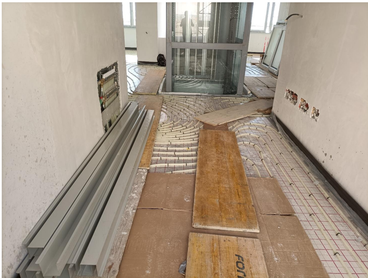
Figura 17 Installazione impianto di riscaldamento a pavimento, rilievo fotografico del 10/09/2025