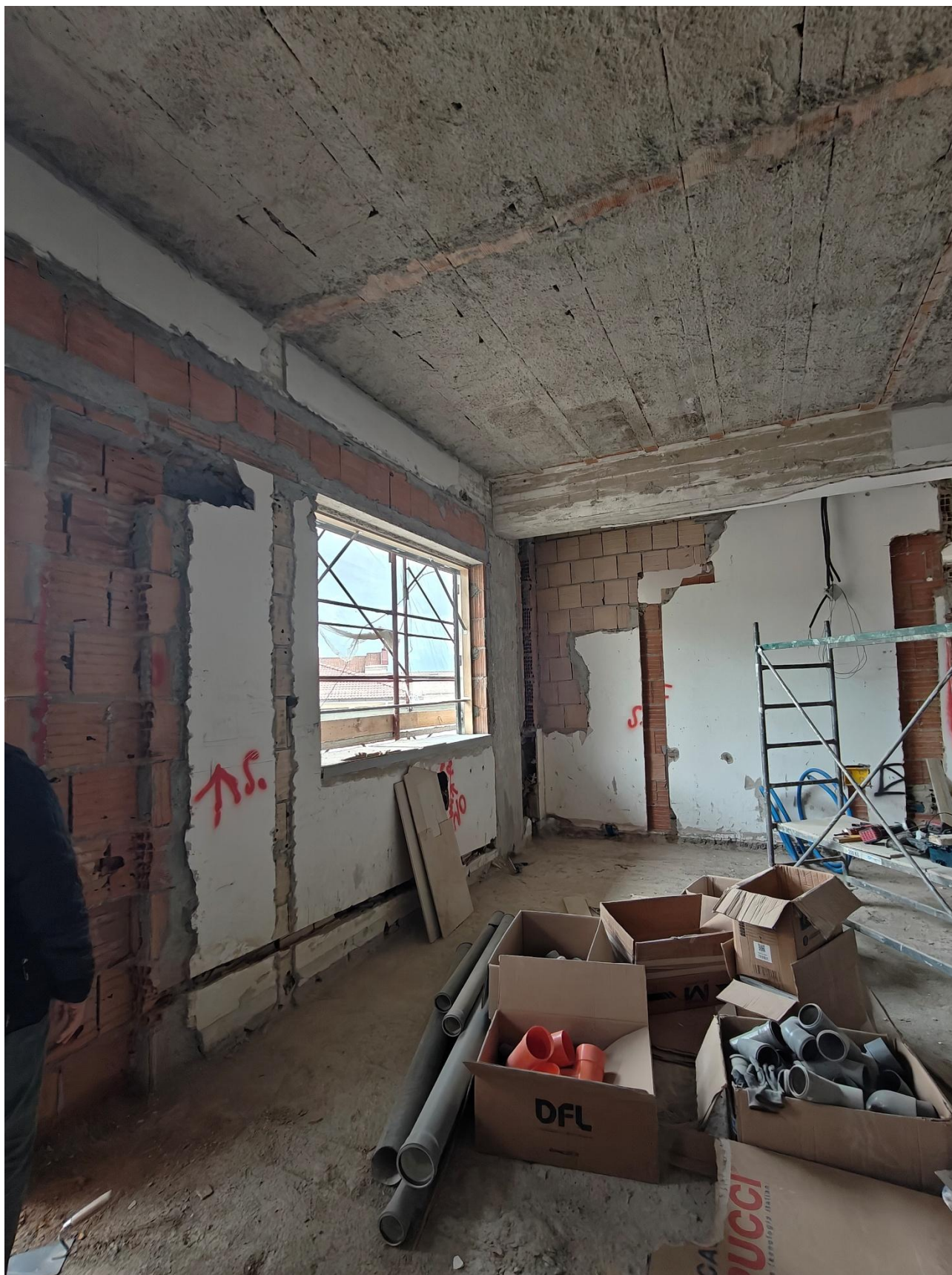
Figura 7 Ristrutturazione interni, rilievo fotografico del 15/05/2025