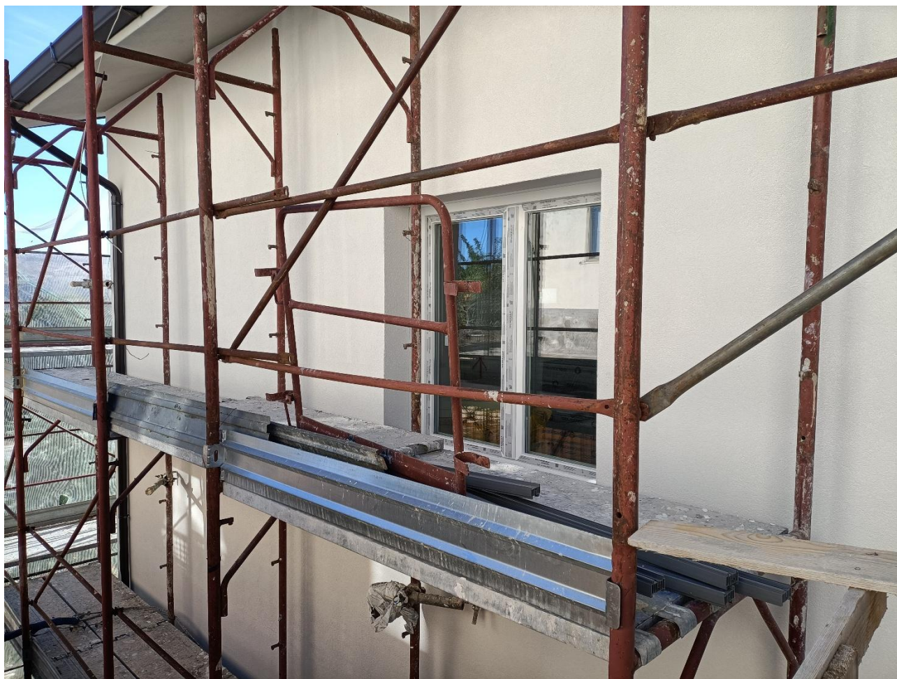
Figura 21 Rifiniture esterne, rilievo fotografico del 18/09/2025