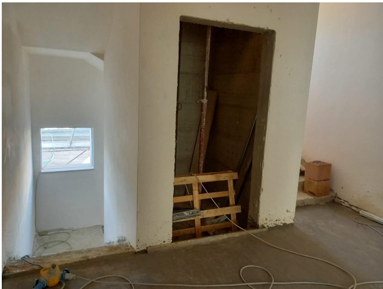
Figura 22 Rilievo fotografico del 21/10/2025