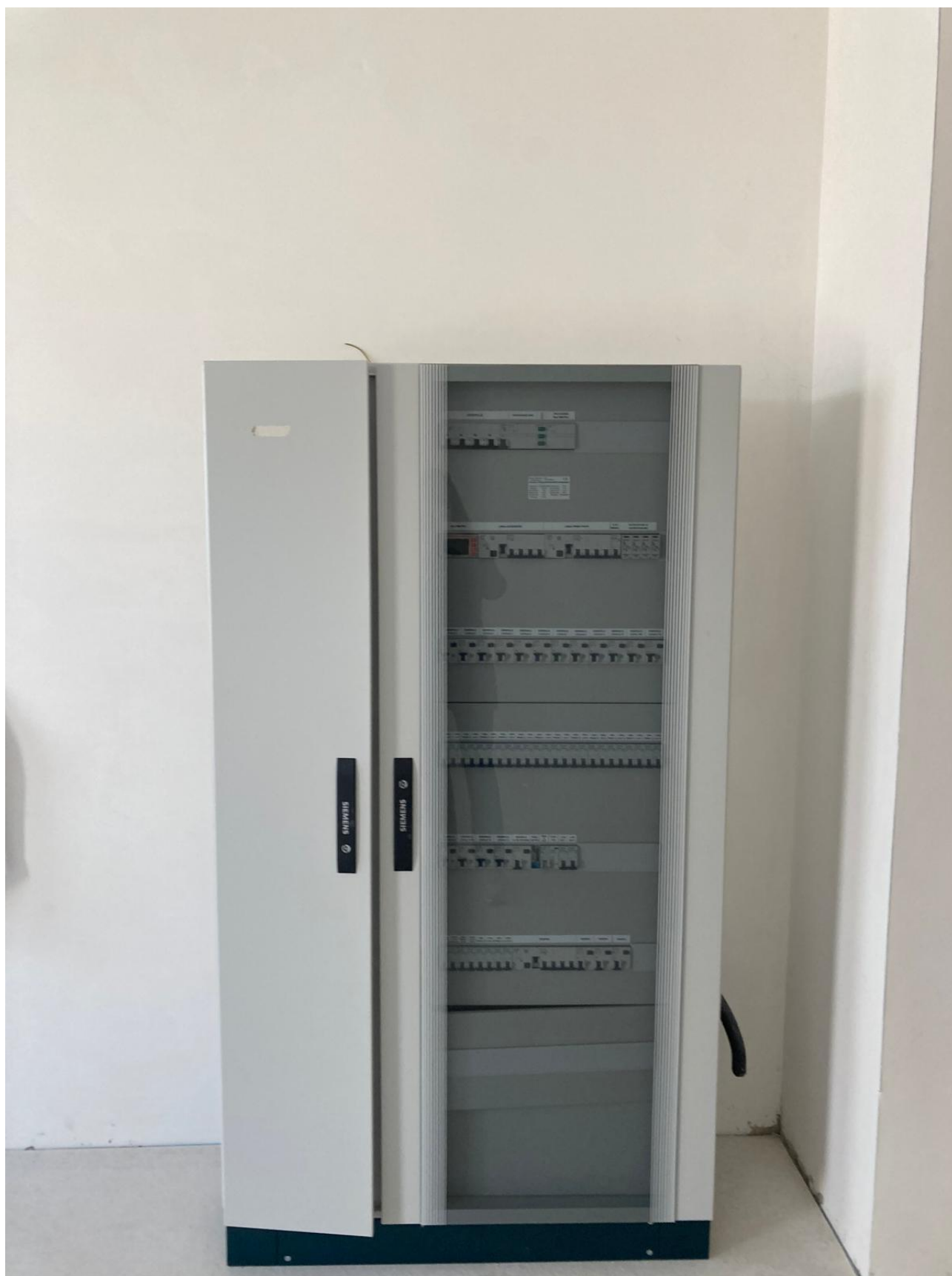
Figura 38 Rilievo fotografico del 12/11/2025