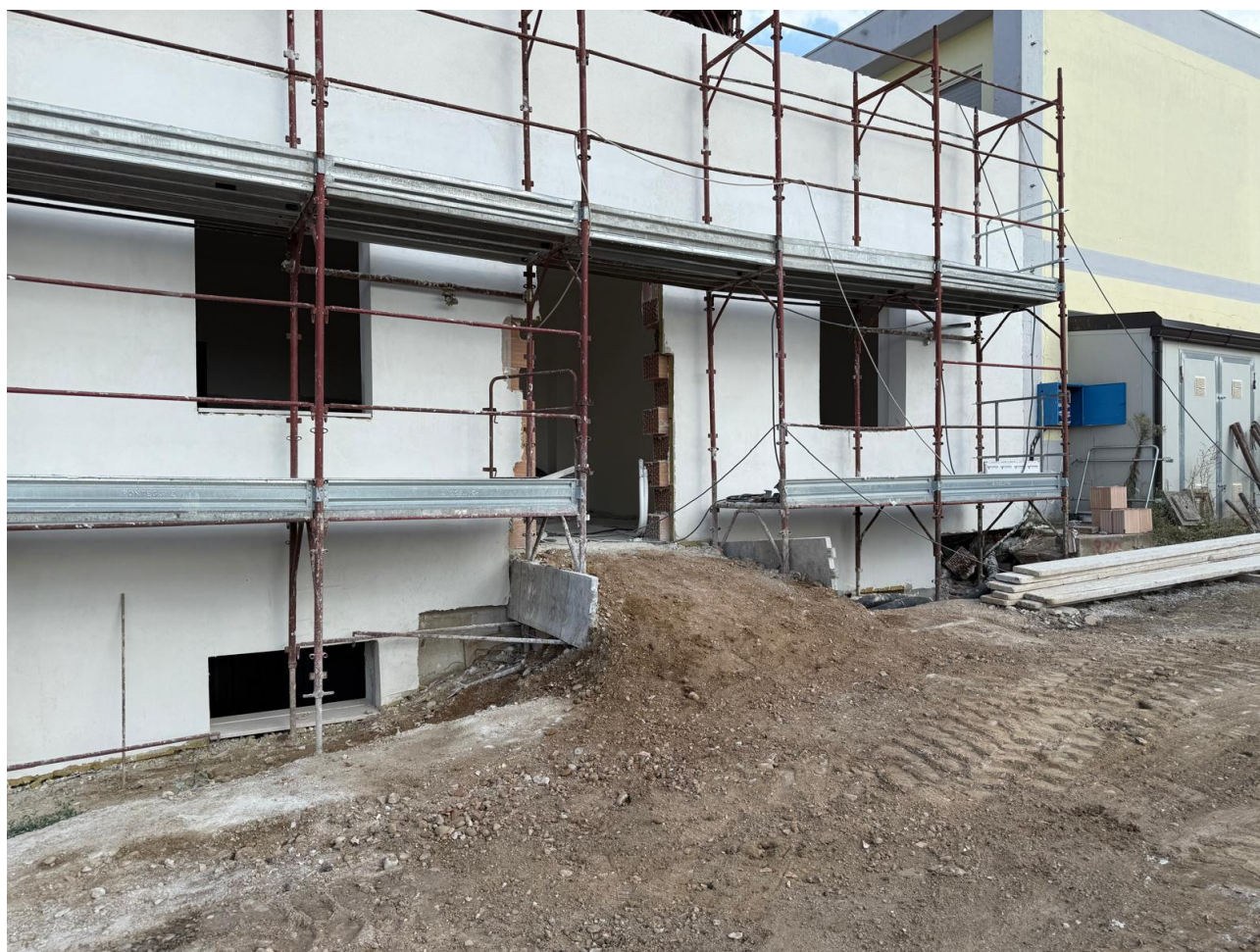
Figura 17 Rilievo fotografico del 18/09/2025