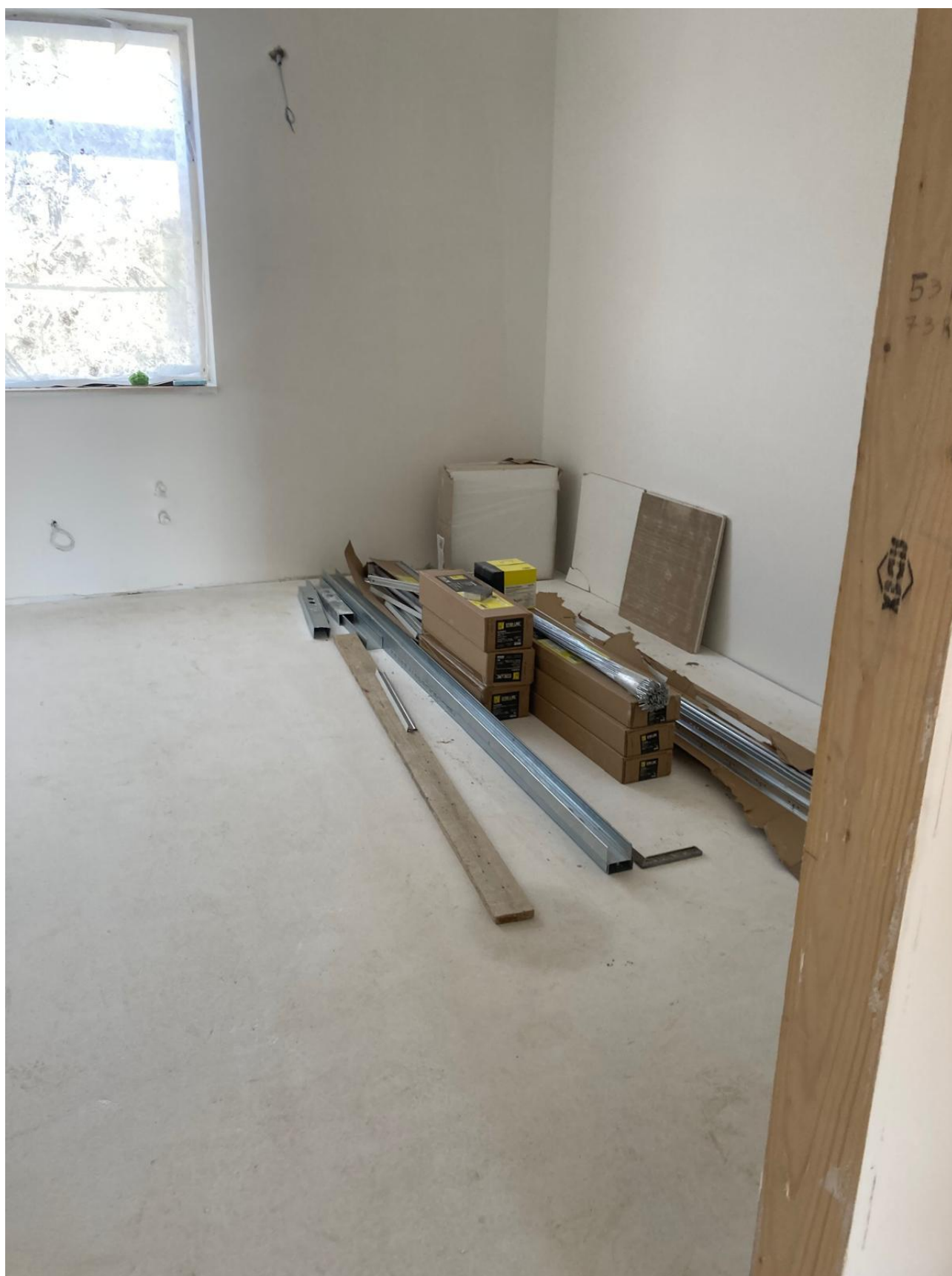
Figura 32 Rilievo fotografico del 12/11/2025