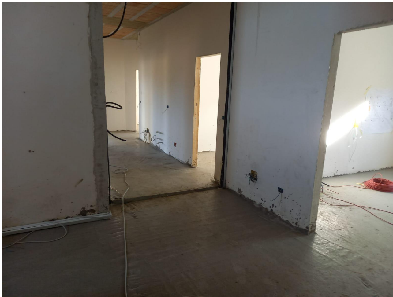
Figura 25 Rilievo fotografico del 21/10/2025