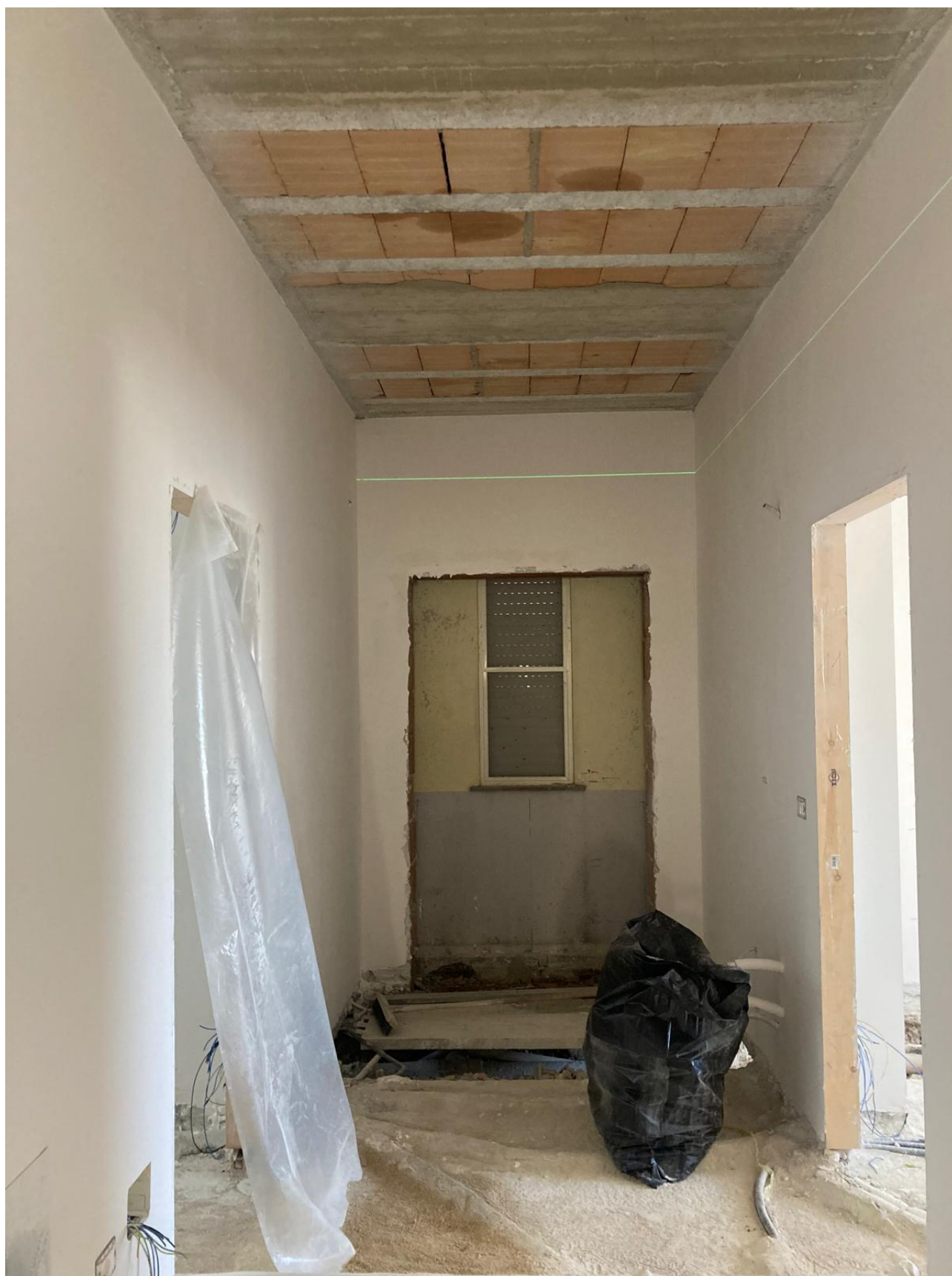
Figura 33 Rilievo fotografico del 12/11/2025