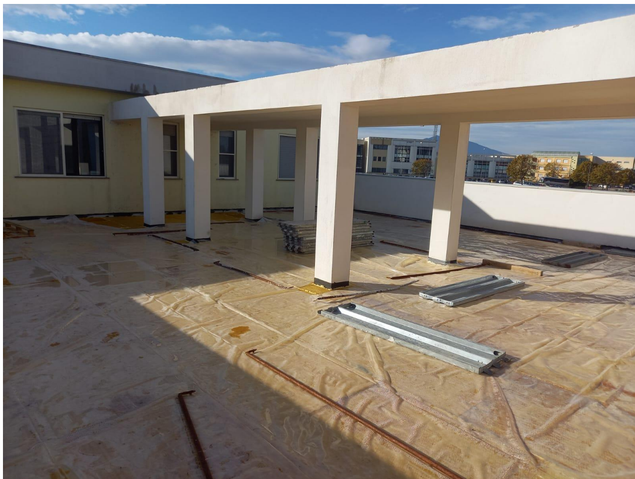
Figura 24 Rilievo fotografico del 21/10/2025