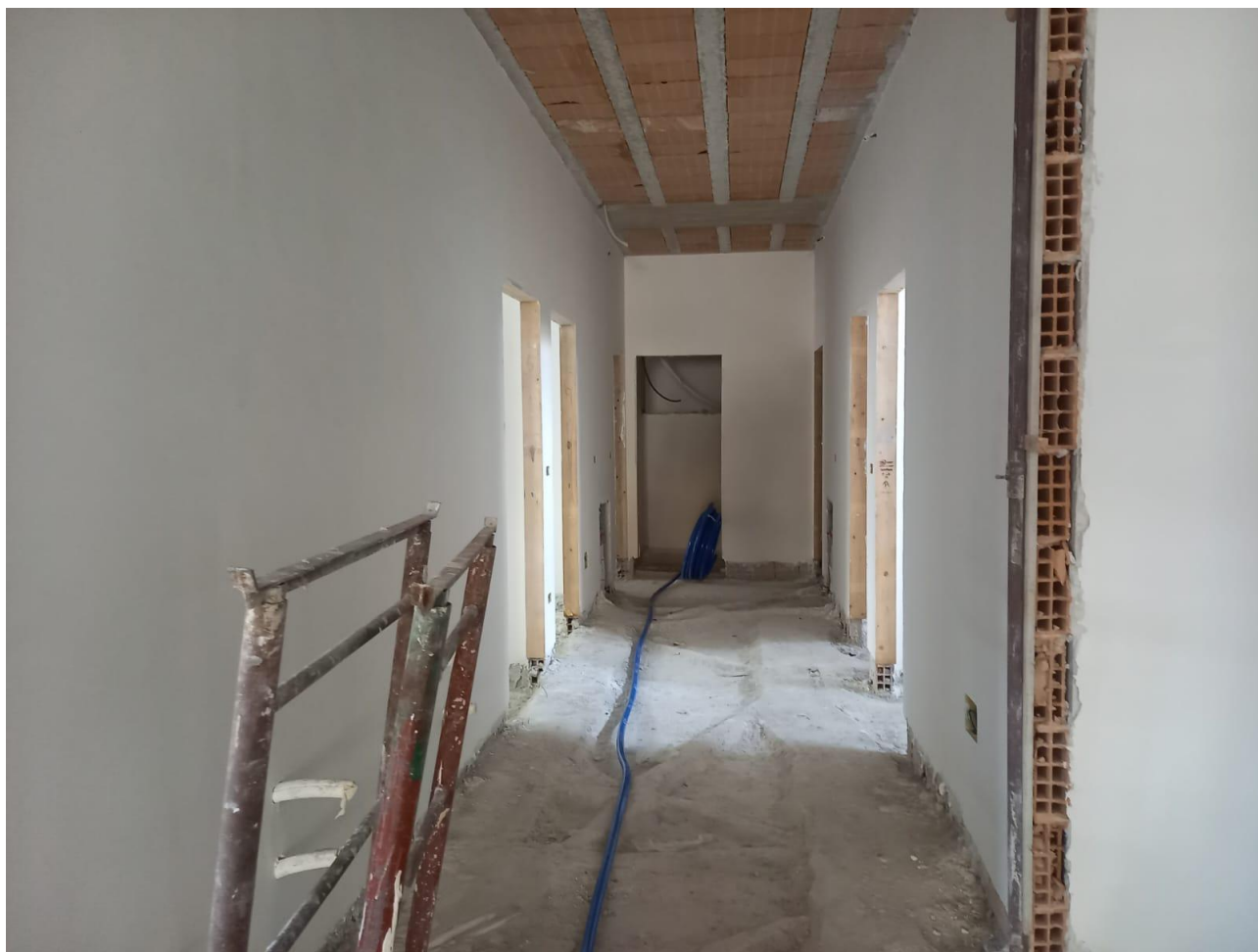
Figura 20 Rilievo fotografico del 21/10/2025