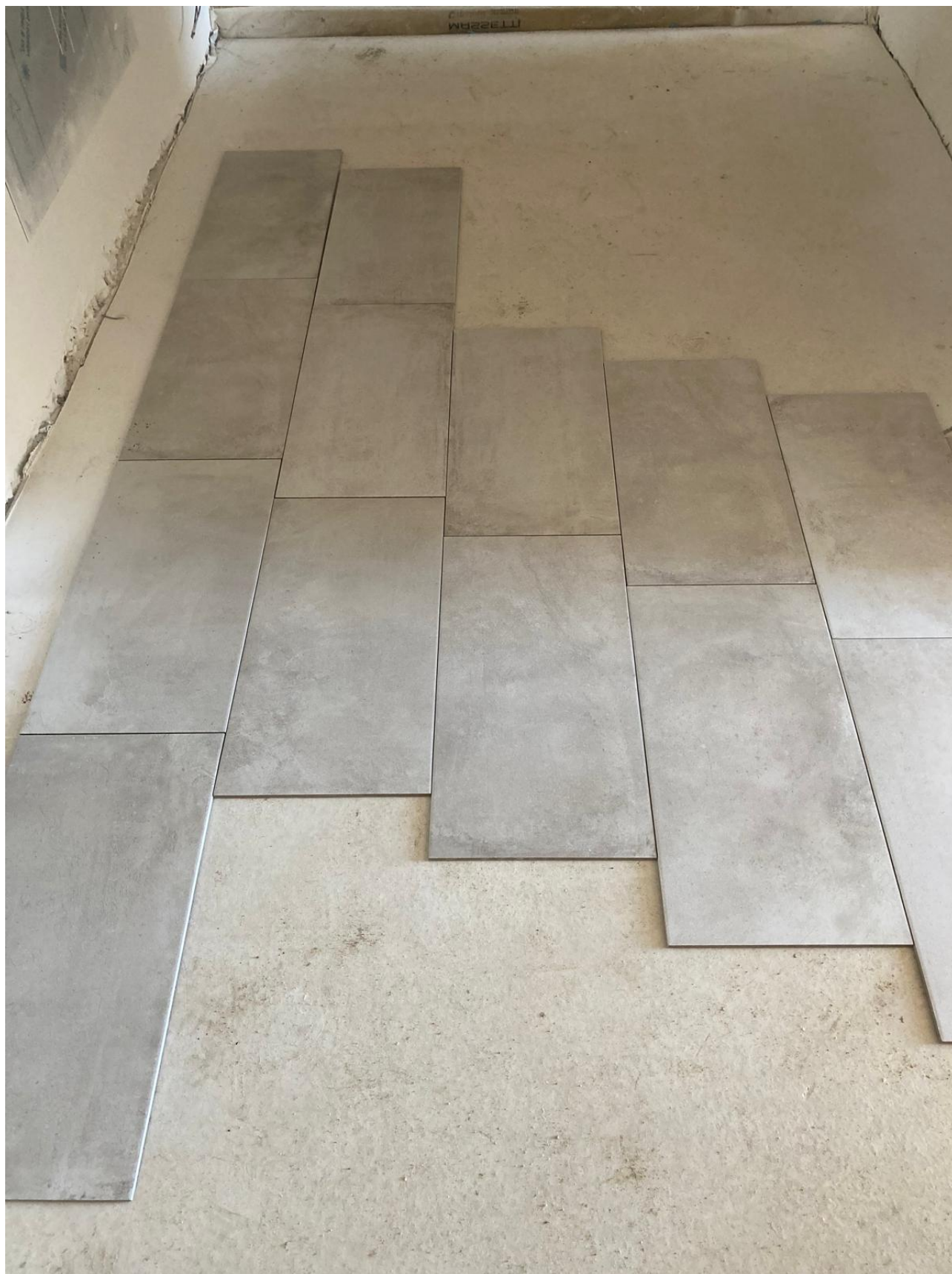
Figura 30 Rilievo fotografico del 12/11/2025