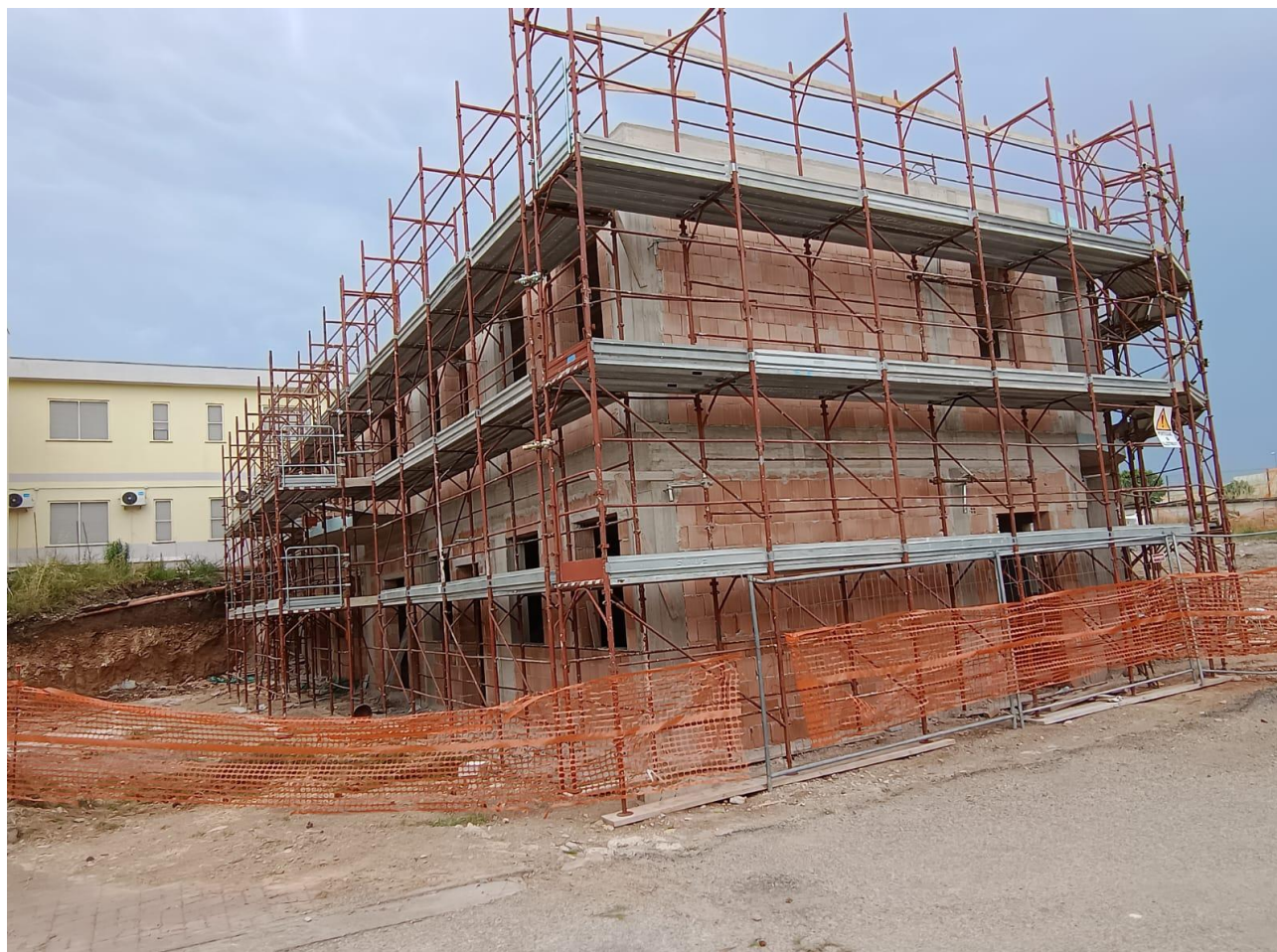
Figura 5 Realizzazione nuova struttura, rilievi fotografici del 27/06/2025