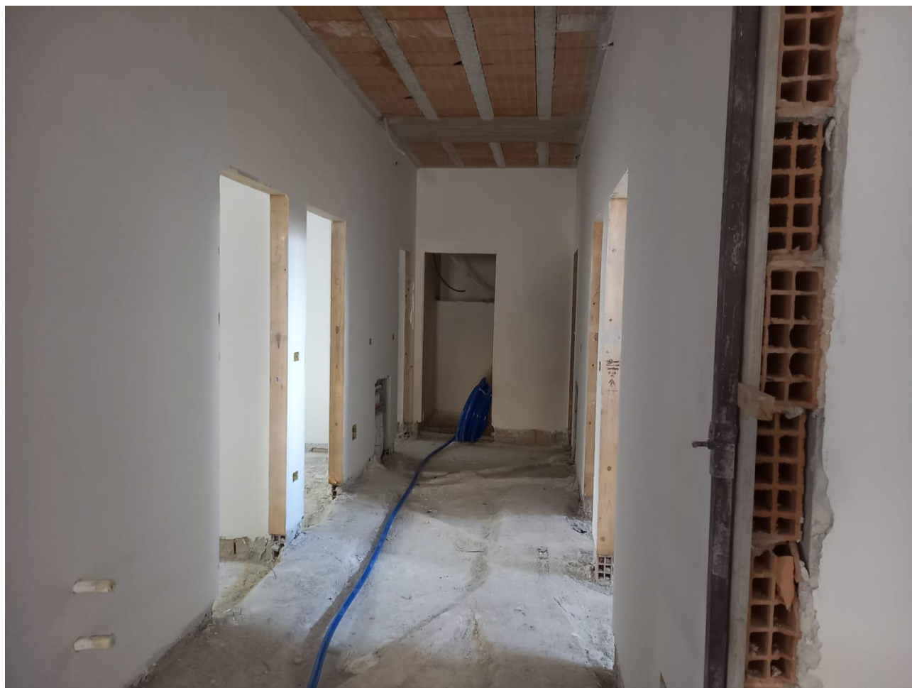
Figura 26 Rilievo fotografico del 21/10/2025