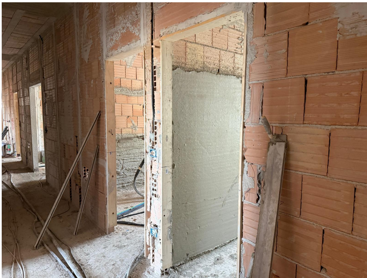
Figura 6 Realizzazione tramezzi interni, rilievo fotografici 18/09/2025