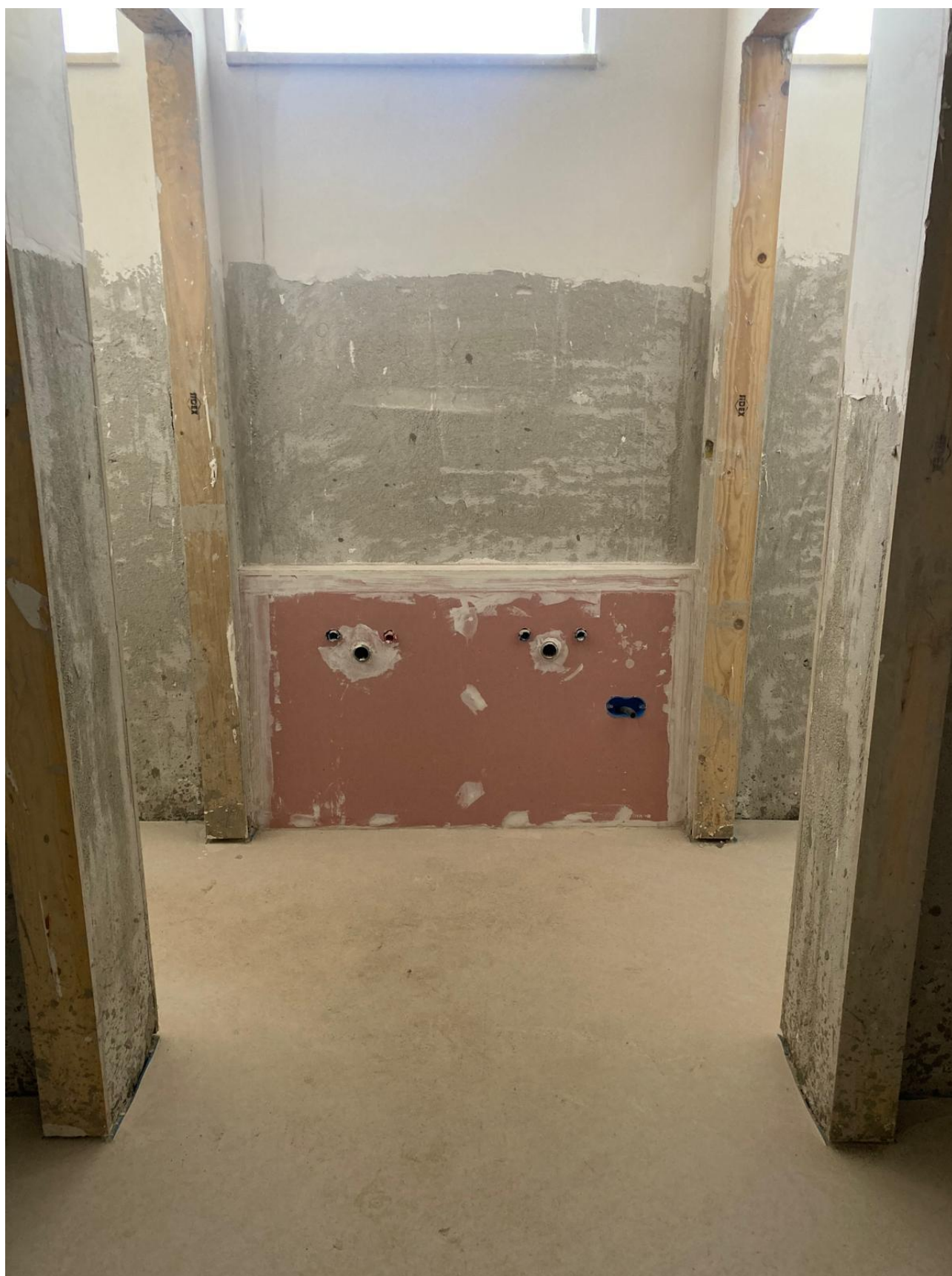
Figura 41 Rilievo fotografico del 12/11/2025