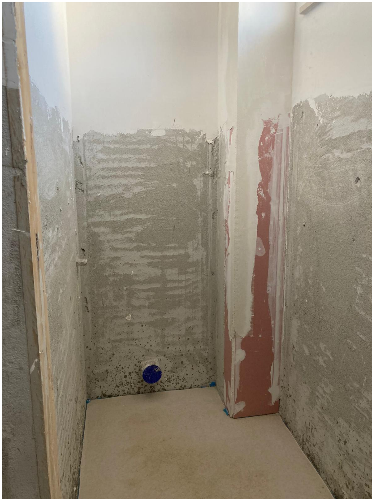
Figura 42 Rilievo fotografico del 12/11/2025