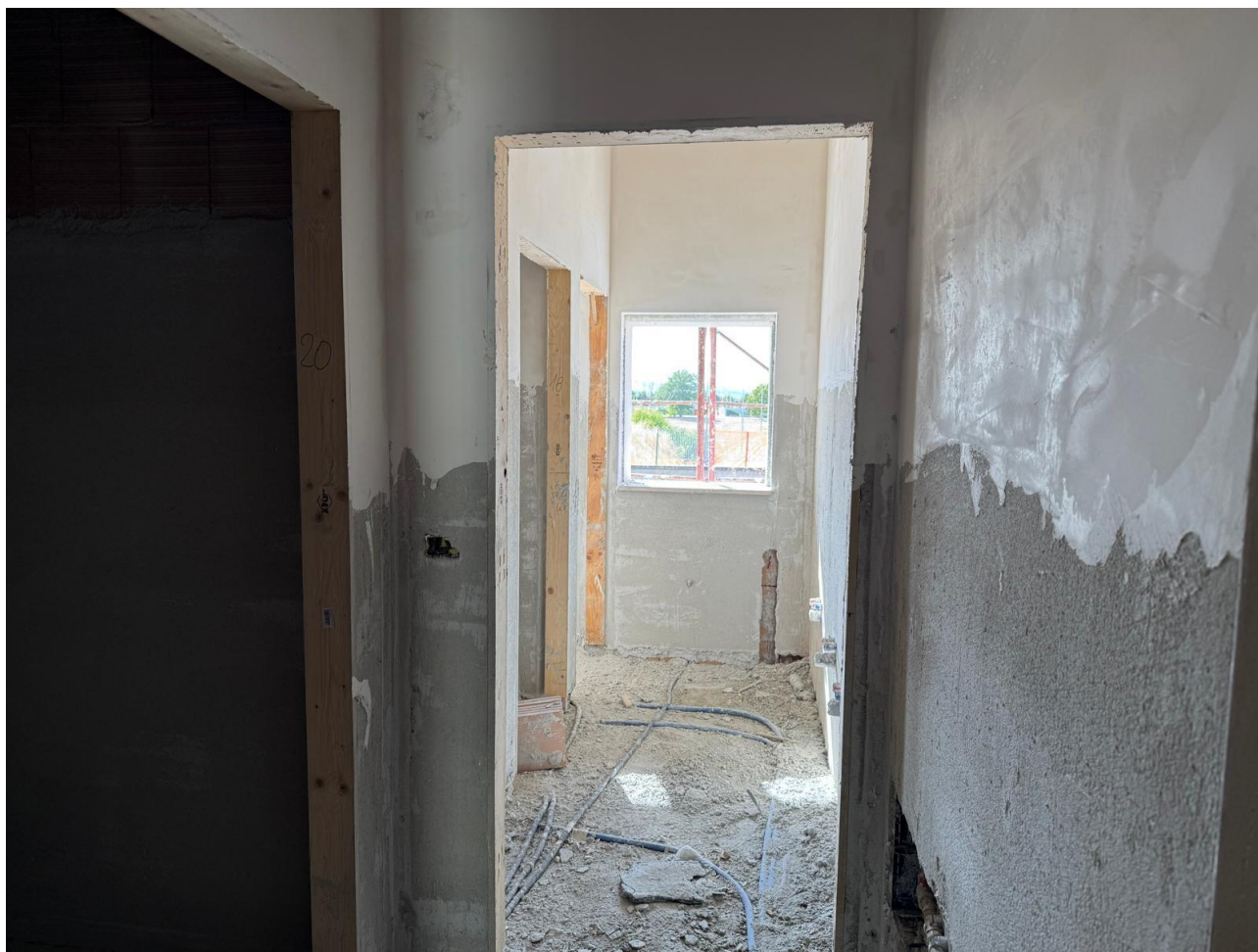
Figura 11 Rilievo fotografico del 18/09/2025