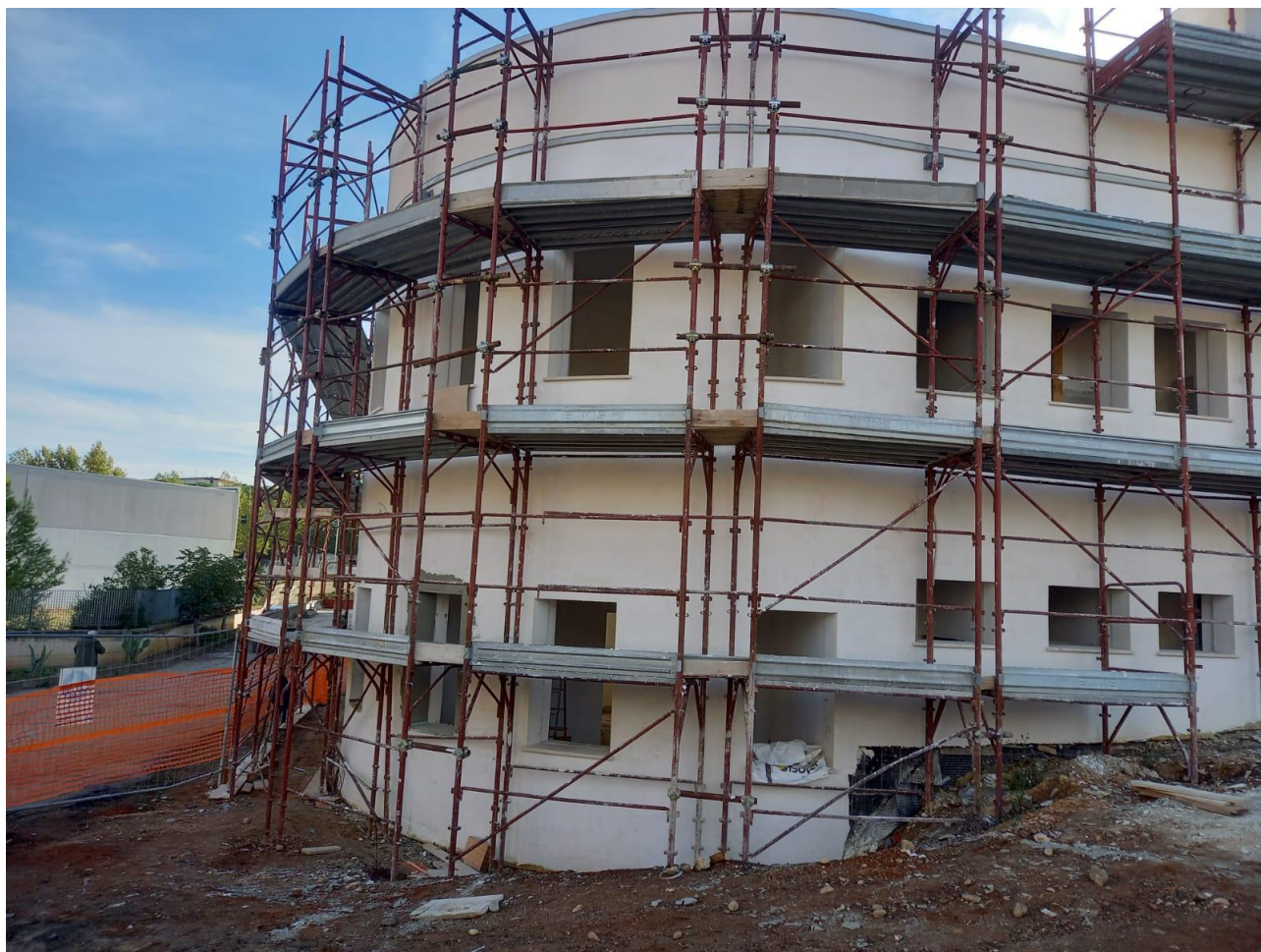
Figura 18 Rilievo fotografico del 21/10/2025