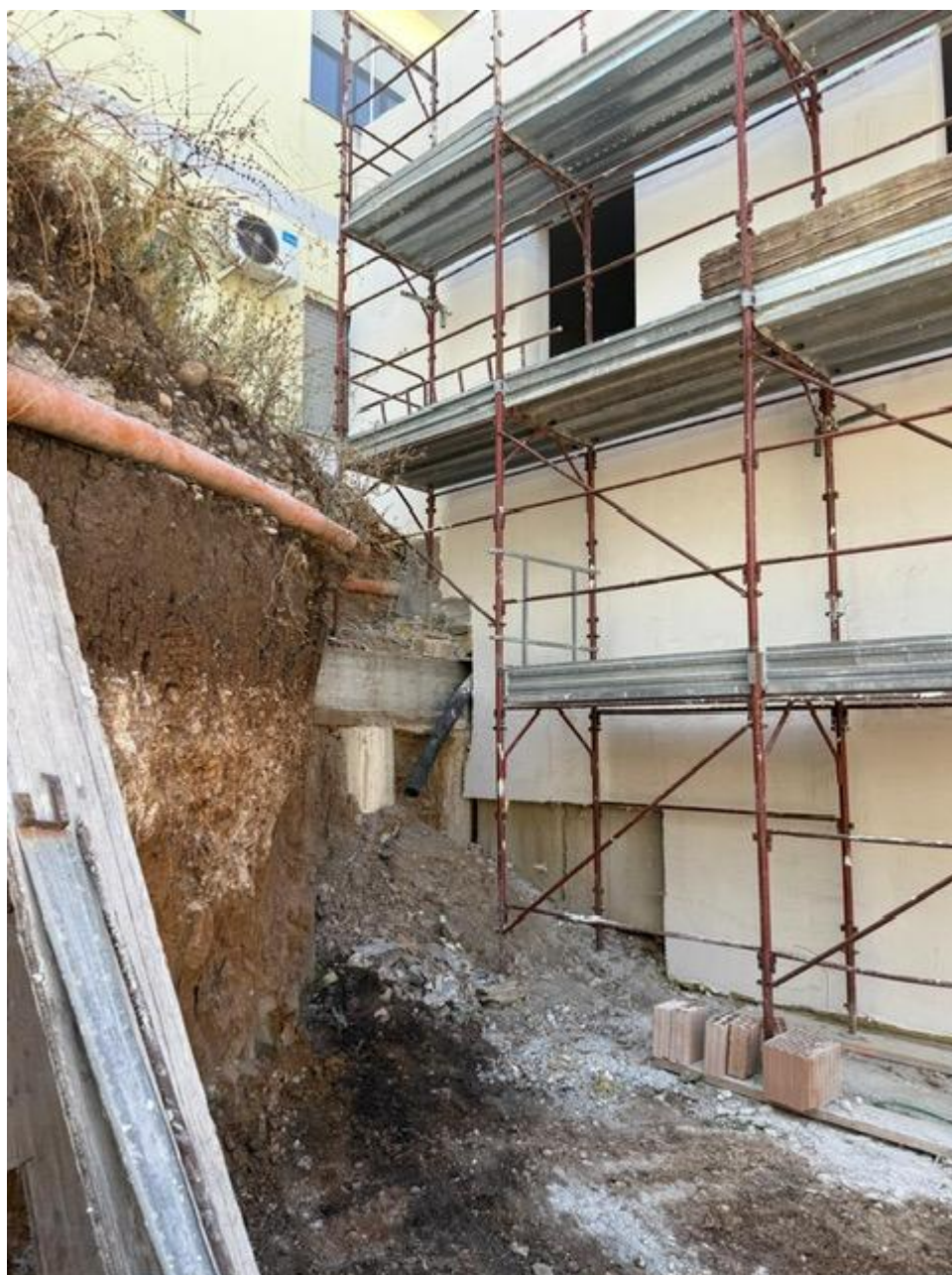
Figura 14 Rilievo fotografico del 18/09/2025