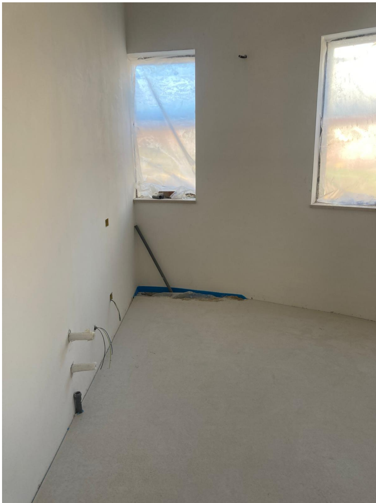
Figura 44 Rilievo fotografico del 12/11/2025