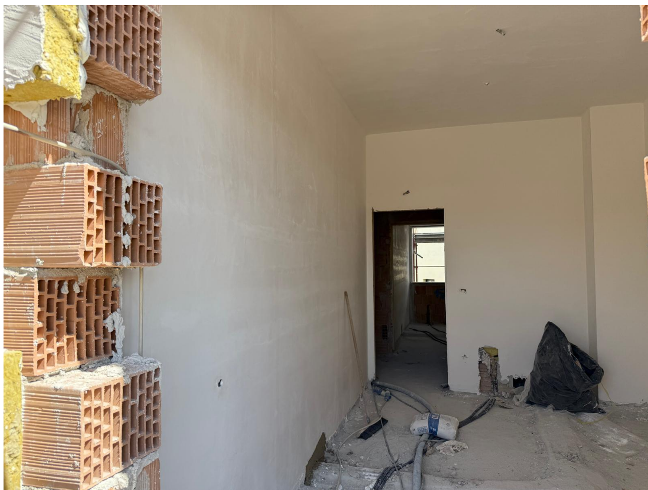
Figura 13 Rilievo fotografico del 18/09/2025