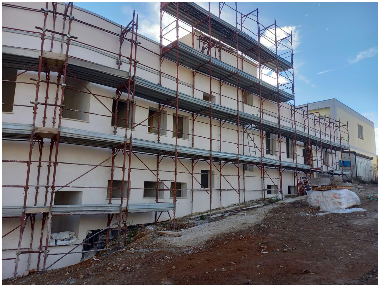
Figura 19 Rilievo fotografico del 21/10/2025