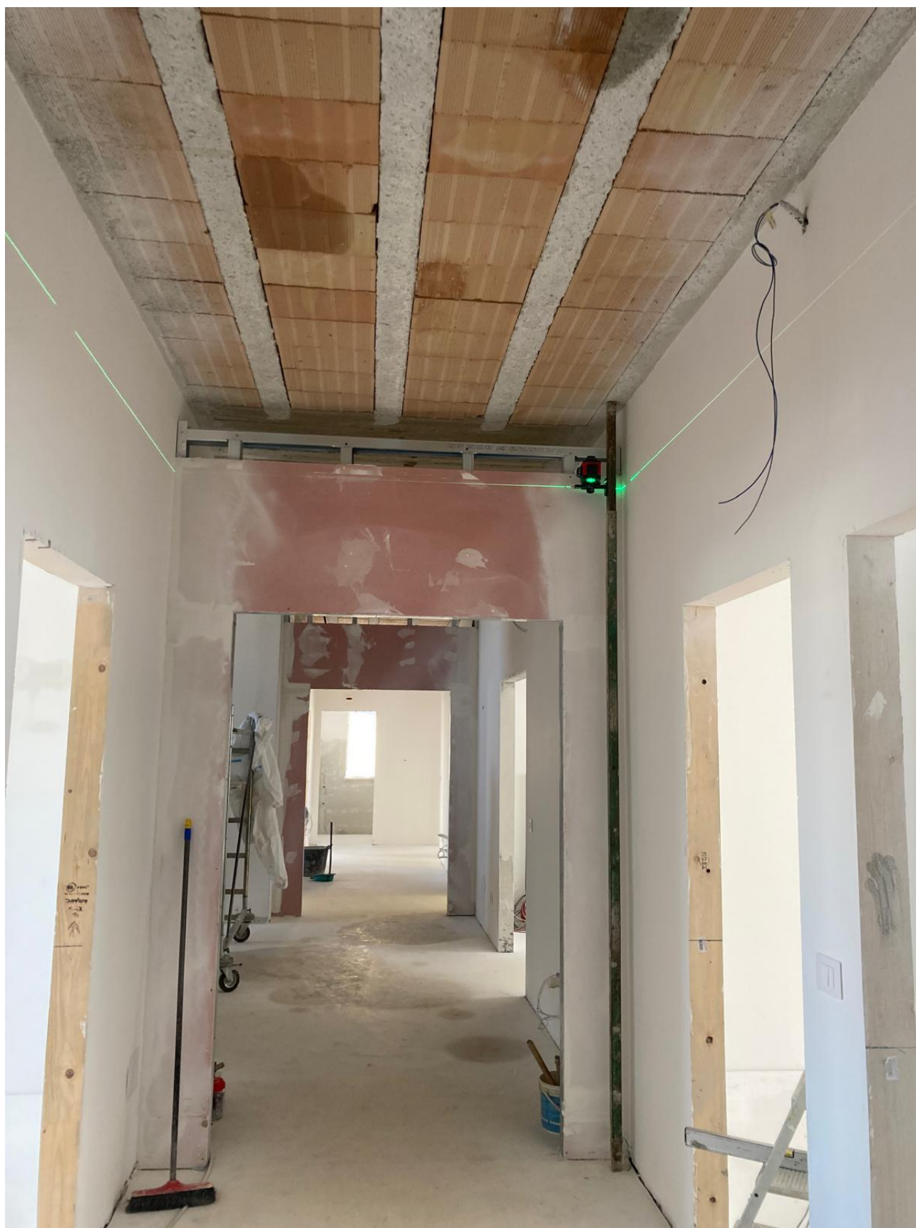
Figura 31 Rilievo fotografico del 12/11/2025