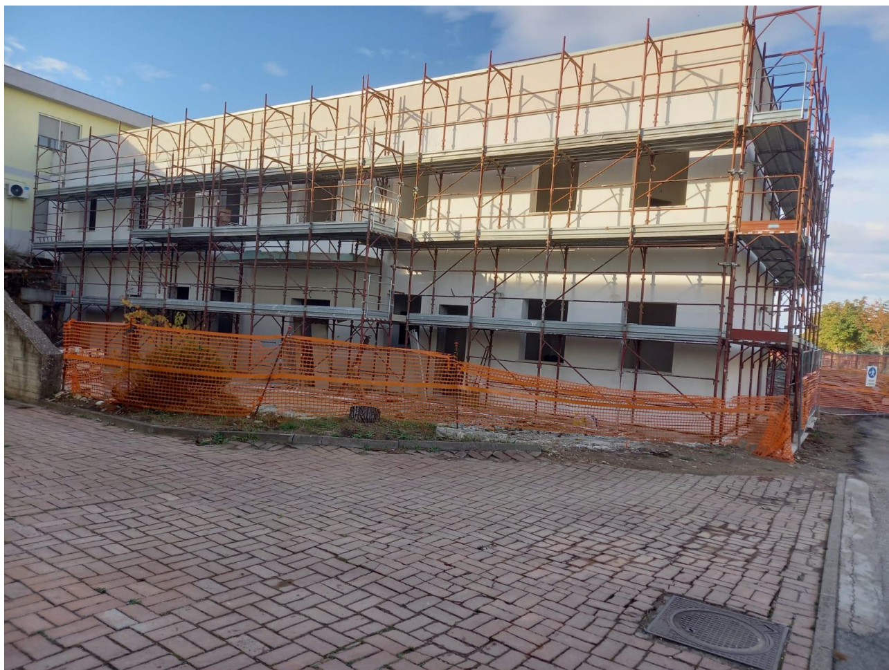
Figura 28 Rilievo fotografico del 21/10/2025