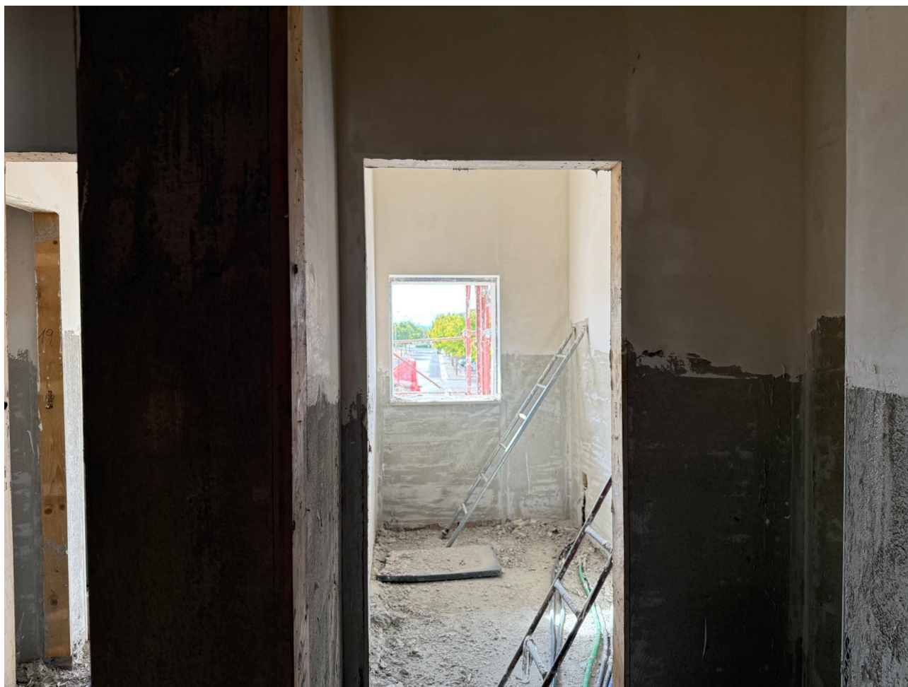
Figura 12 Rilievo fotografico del 18/09/2025