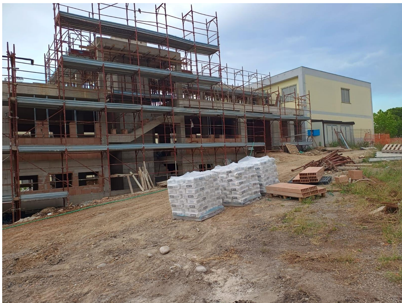
Figura 3 Realizzazione nuova struttura, rilievi fotografici del 27/06/2025