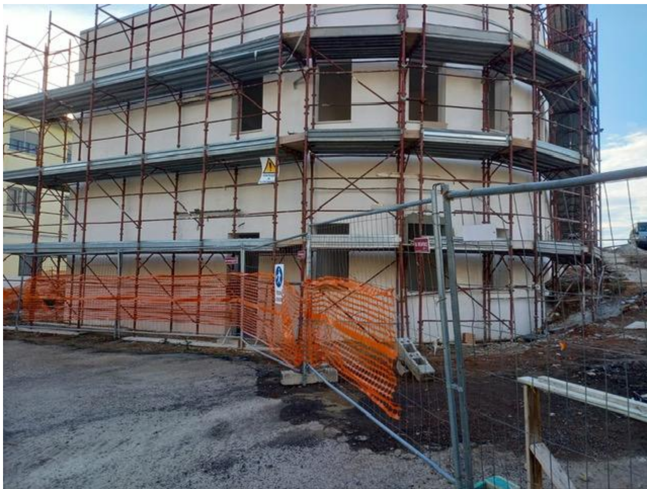
Figura 27 Rilievo fotografico del 21/10/2025