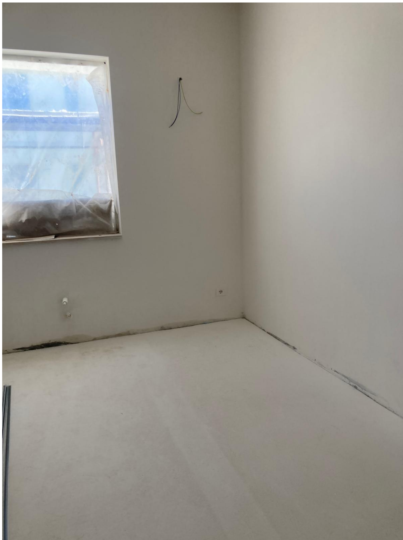
Figura 35 Rilievo fotografico del 12/11/2025