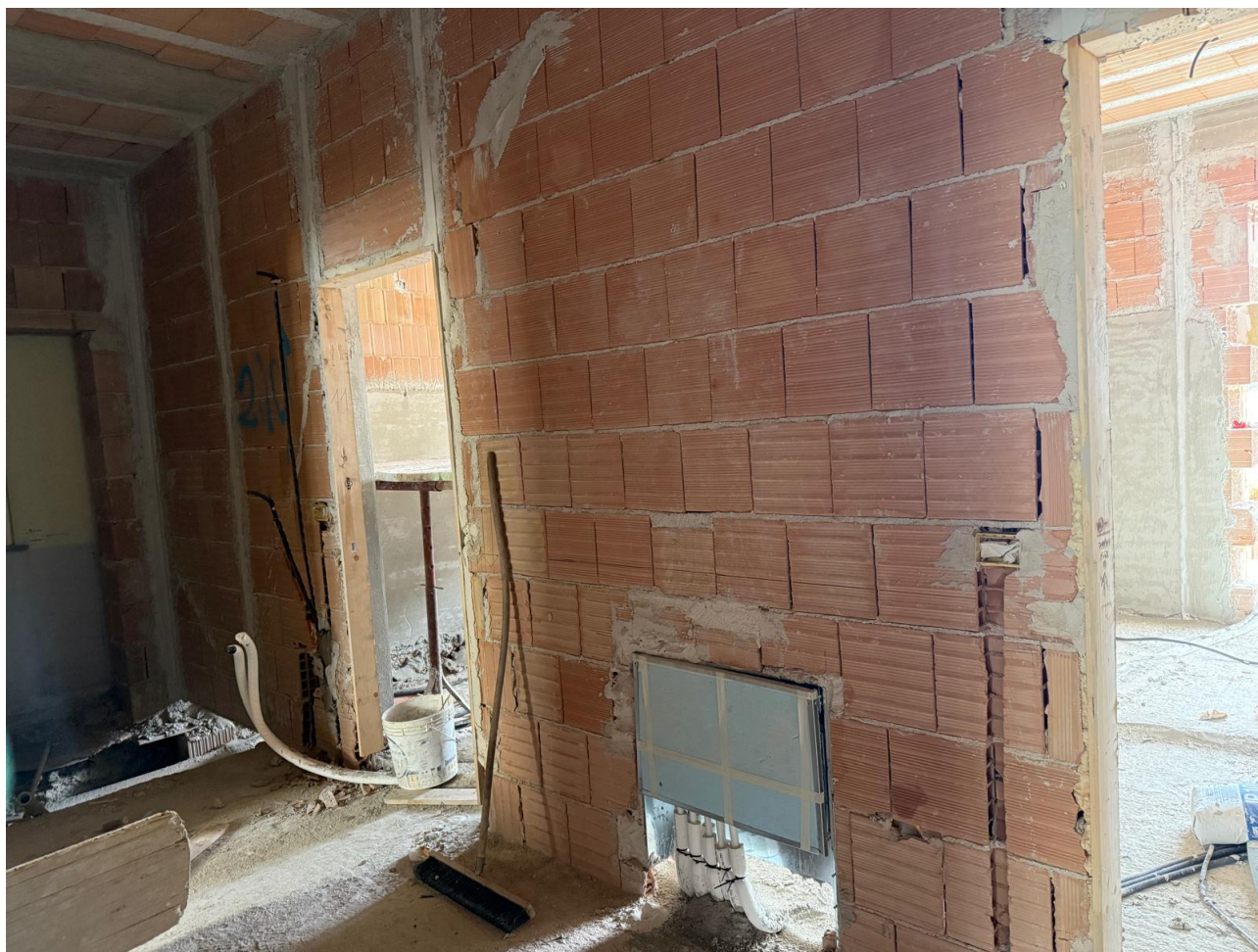
Figura 10 Realizzazione impianti, rilievo fotografico 18/09/2025