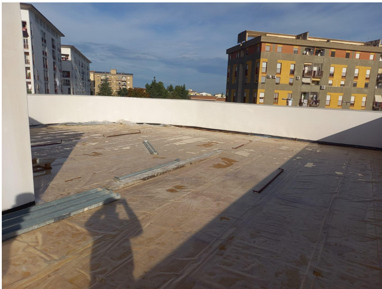
Figura 23 Rilievo fotografico del 21/10/2025