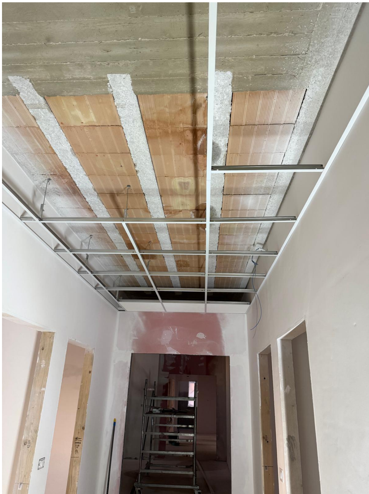
Figura 47 Rilievo fotografico del 12/11/2025