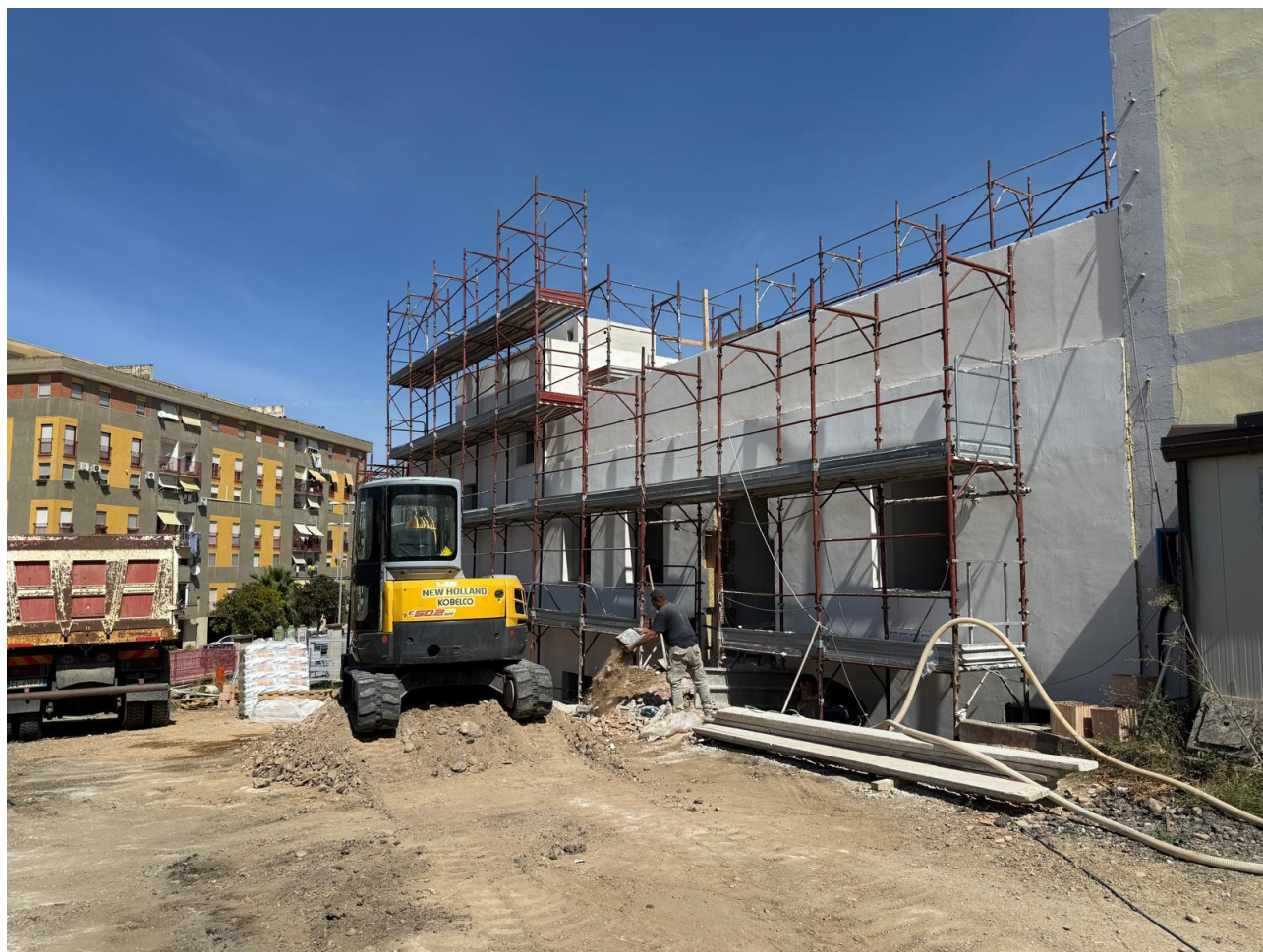
Figura 15 Rilievo fotografico del 18/09/2025