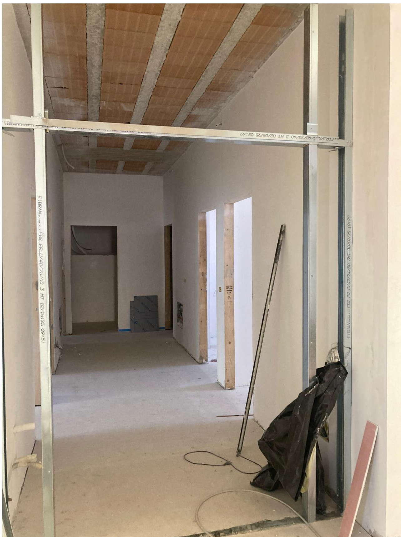
Figura 40 Rilievo fotografico del 12/11/2025