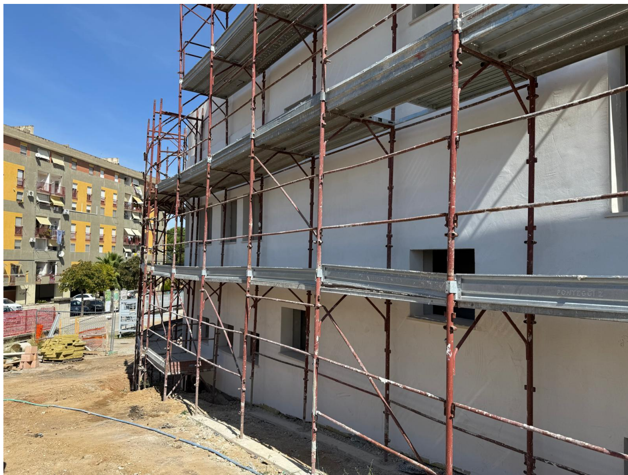
Figura 16 Rilievo fotografico del 18/09/2025