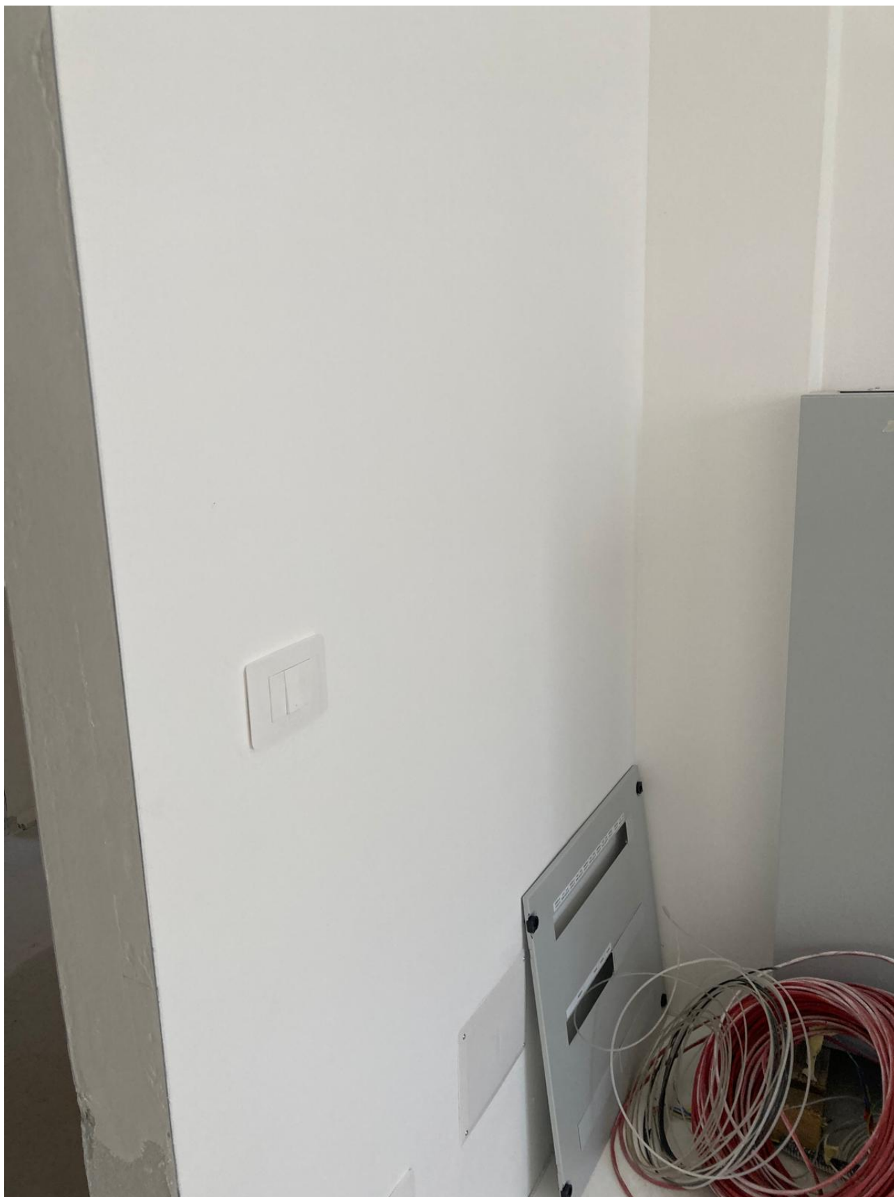
Figura 36 Rilievo fotografico del 12/11/2025