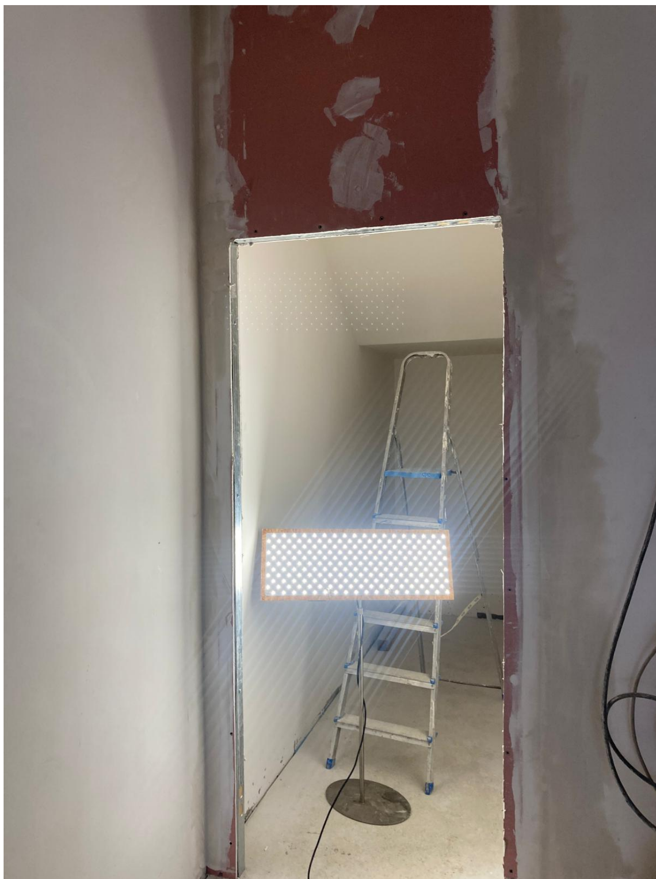
Figura 45 Rilievo fotografico del 12/11/2025