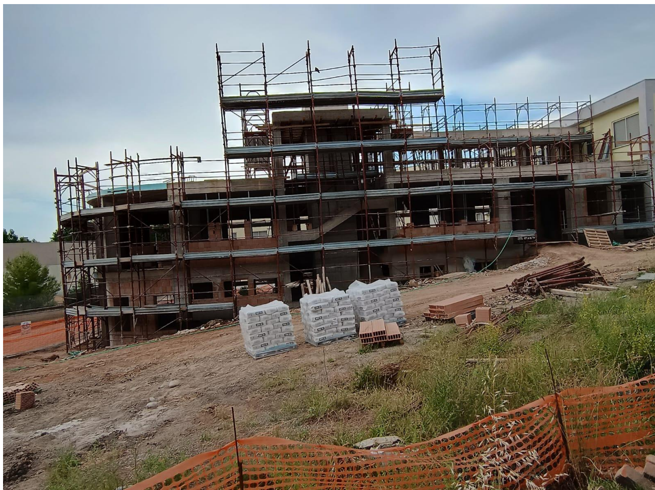
Figura 2 Realizzazione nuova struttura, rilievi fotografici del 27/06/2025