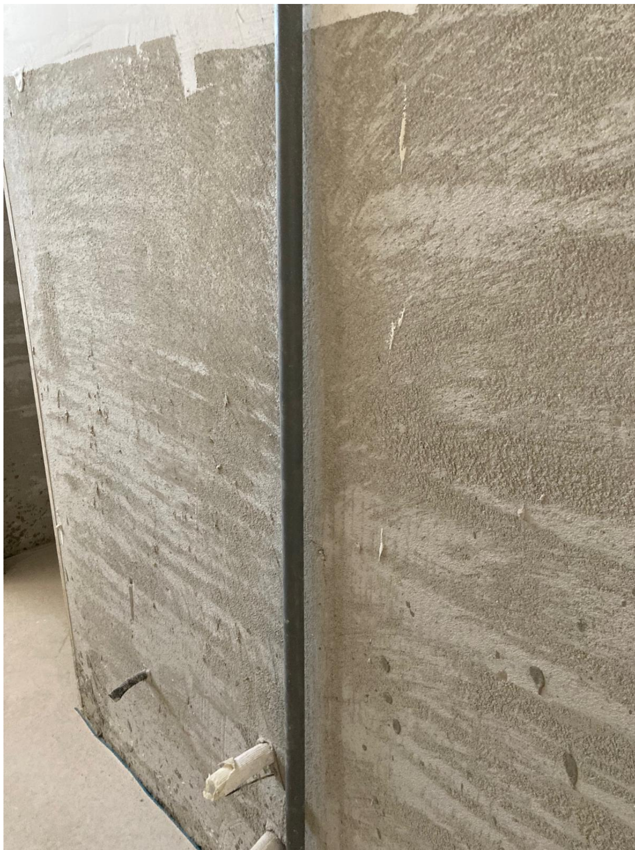
Figura 43 Rilievo fotografico del 12/11/2025