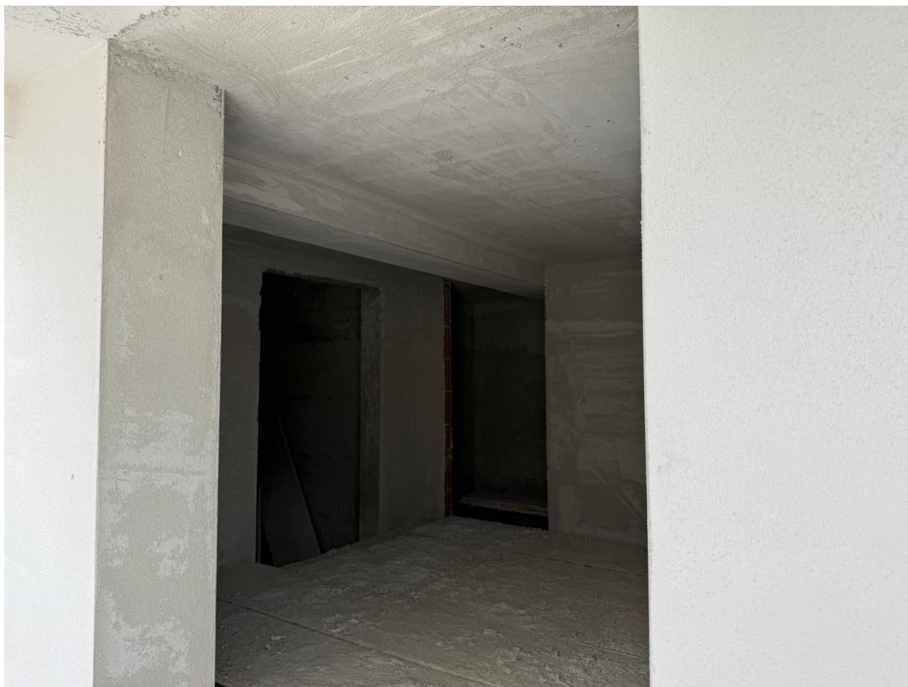
Figura 7 Lavori interni, rilievi fotografici del 18.09.2025