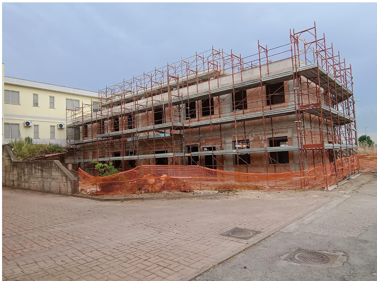
Figura 4 Realizzazione nuova struttura, rilievi fotografici del 27/06/2025