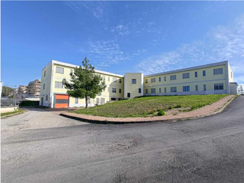
Figura 1 Ante operam