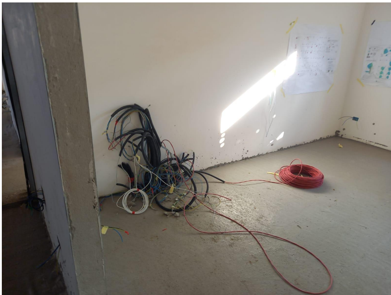
Figura 21 Rilievo fotografico del 21/10/2025