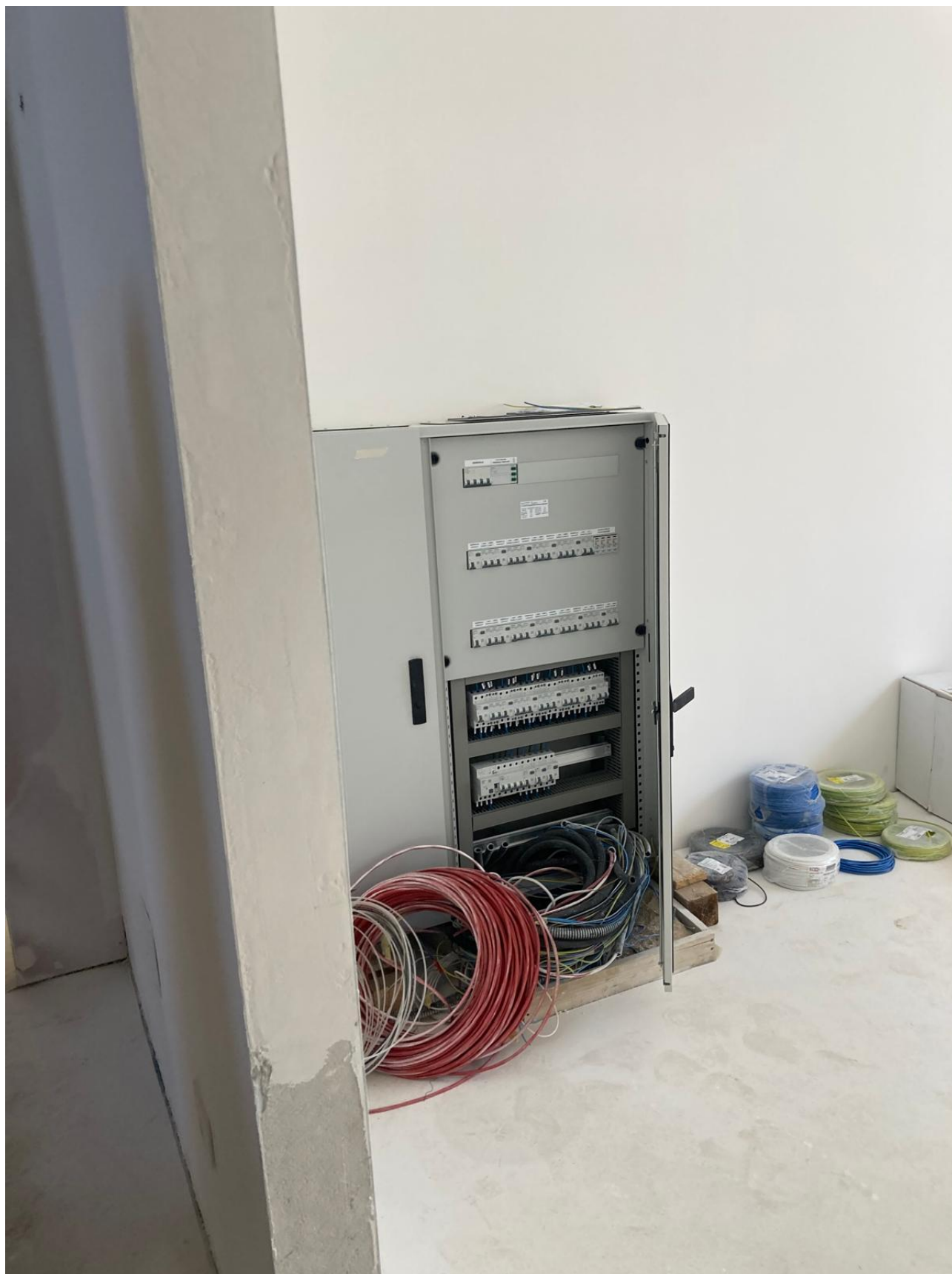
Figura 34 Rilievo fotografico del 12/11/2025