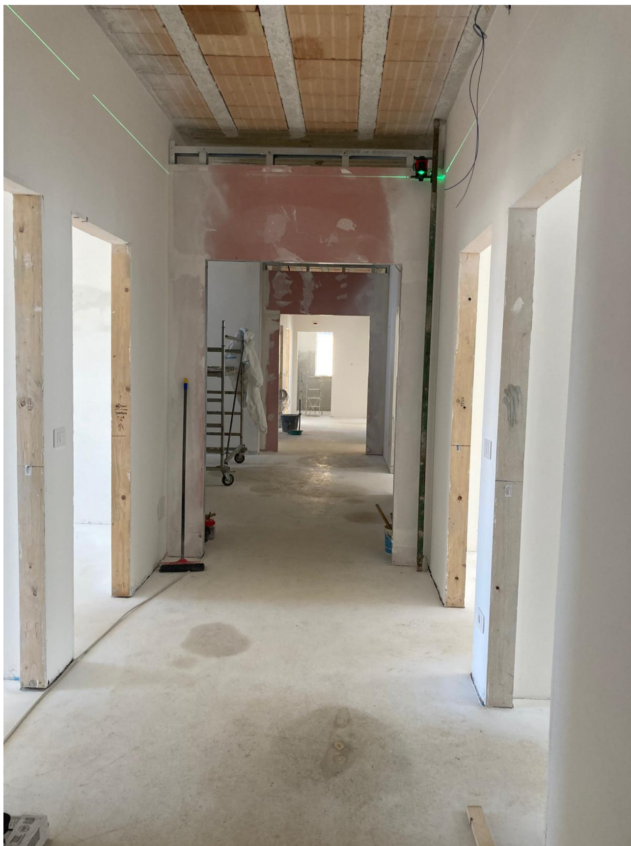
Figura 46 Rilievo fotografico del 12/11/2025