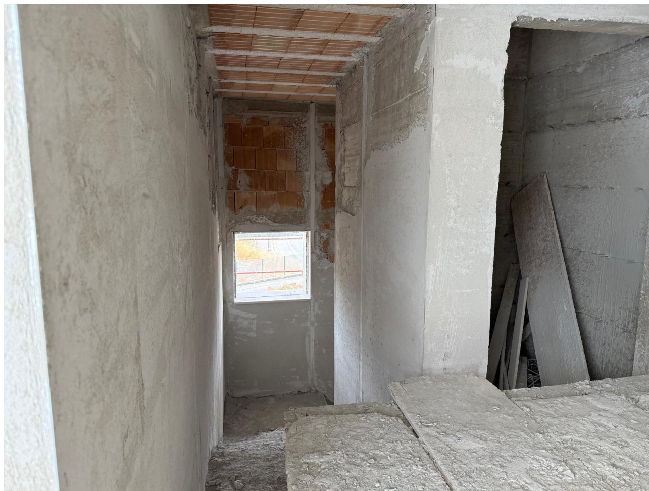
Figura 8 Lavori interni, rilievi fotografici del 18.09.2025