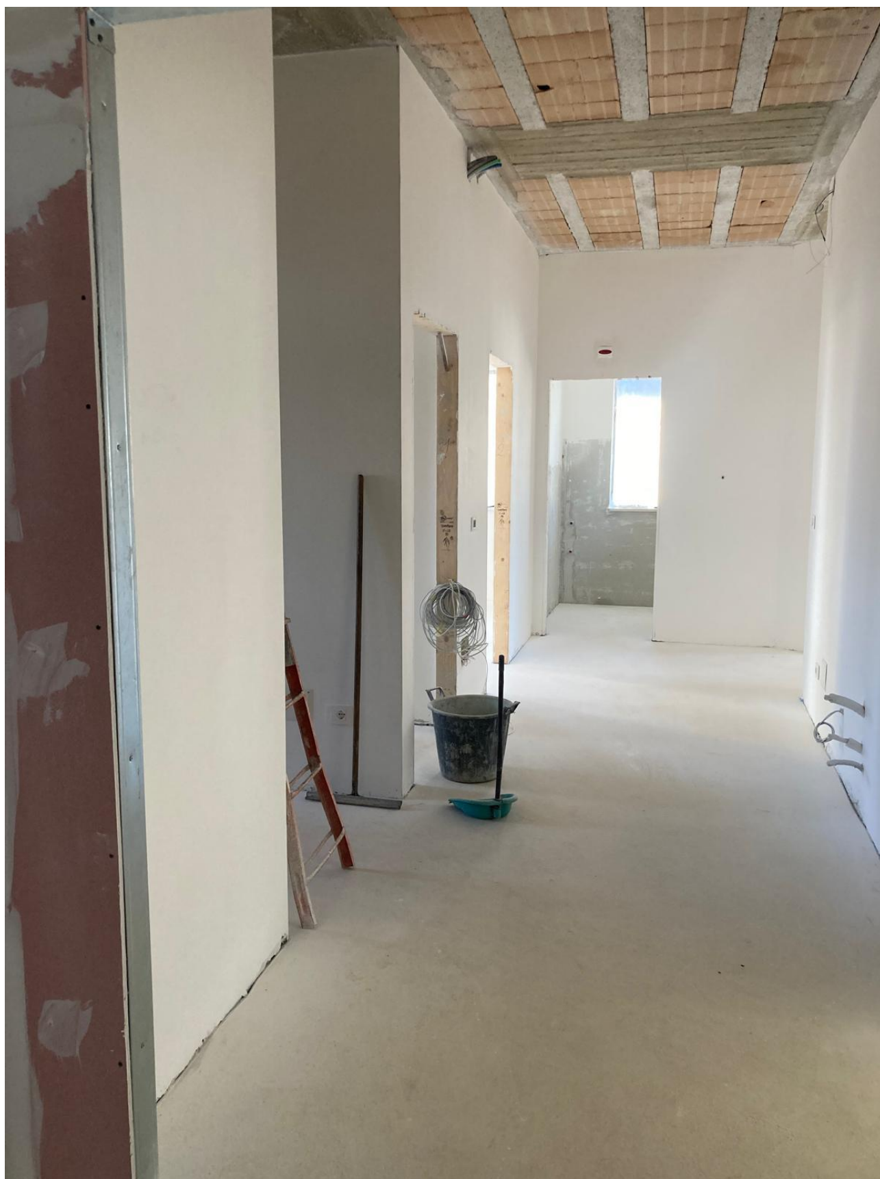
Figura 37 Rilievo fotografico del 12/11/2025