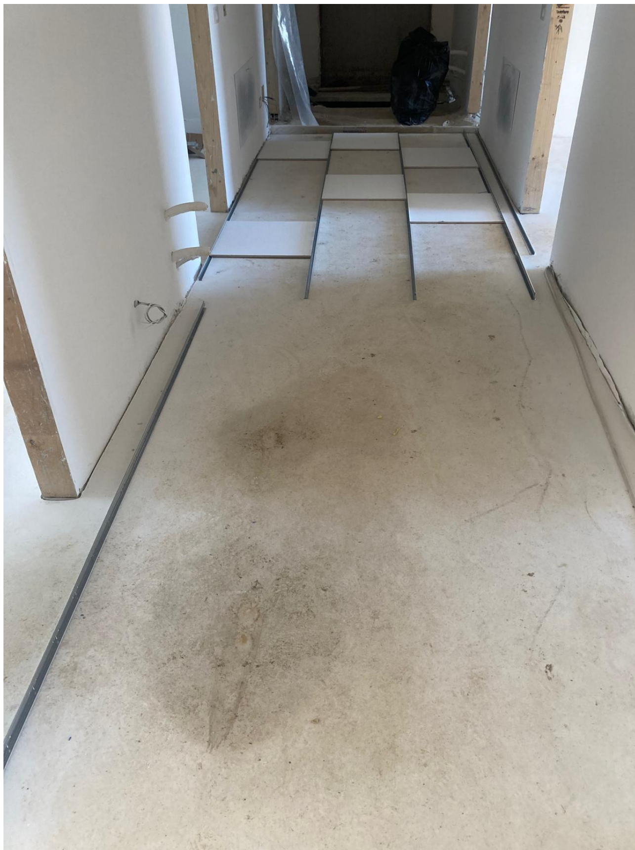
Figura 29 Rilievo fotografico del 12/11/2025