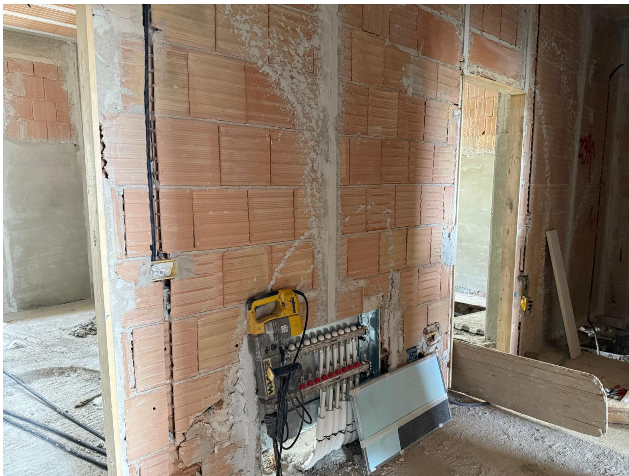
Figura 9 Realizzazione impianti, rilievo fotografico 18/09/2025